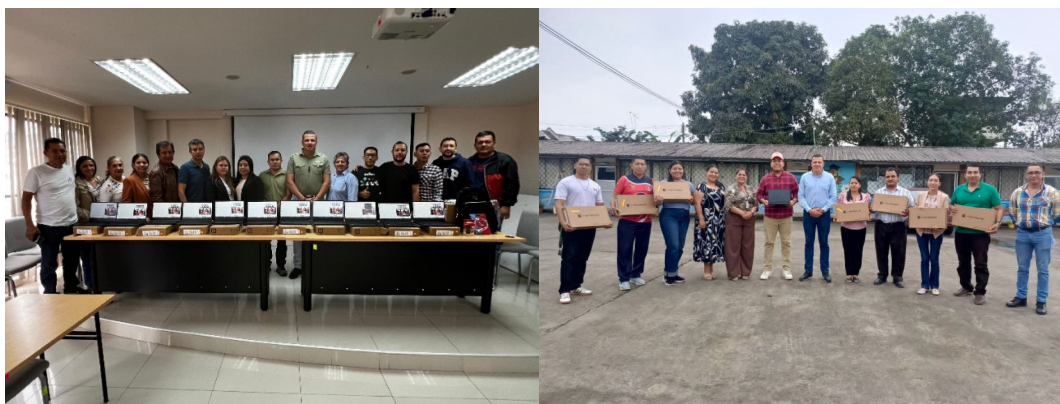
Imagen 2: Revisión y entrega de Kits tecnológicos (Laptop, mochila y candado)

En lo que respecta al Componente 2 dentro del proyecto reducción de la brecha digital se realizó a entrega de 334 proyectores, maletín para proyectora y parlantes a las Instituciones Educativas Uni, Bidocentes, conforme se detalla en la siguiente tabla.