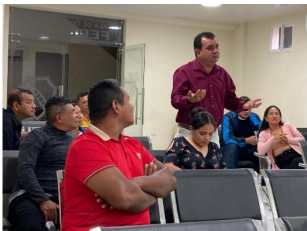
Imagen 8: Capacitación Incentivo Tributario