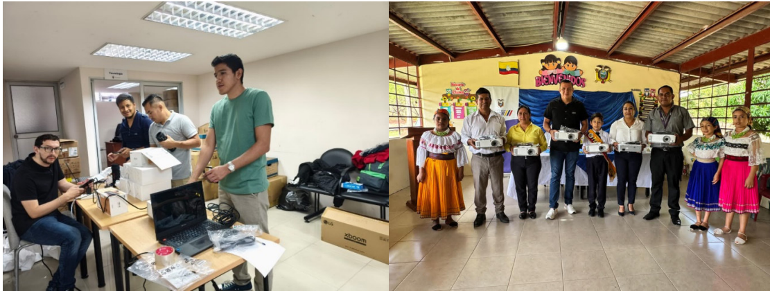
Imagen 3: Revisión y entrega de Kits proyectores y parlantes

Alimentación escolar de calidad: impulsamos la dotación de un verdadero aporte a la nutrición para el desarrollo adecuado de las capacidades cognitivas de niñas, niños y jóvenes, con el fin de que el proceso de aprendizaje sea apropiado. Se refuerza con el Programa Mundial de Alimentos para la entrega de raciones alimenticias frescas y saludables.