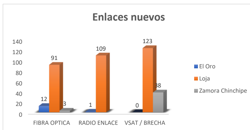
Gráfico 1. Gestión de enlaces nuevos de conectividad en las IES de la CZ7

A través de la Unidad Zonal de Tecnologías de la Información y Comunicaciones en el 2025 se mantuvieron 786 enlaces de conectividad a través de la Dirección Nacional de Tecnologías de la Información y Comunicaciones y CNT EP, a través de 03 tipos de tecnología (cobre, fibra óptica y VSAT) y 954 enlaces de internet pagados por Distrito o autogestionados.