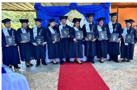
Ilustración 20: Incorporación de Bachilleres 2024-2025

Fuente: División Distrital de Apoyo, Seguimiento y Regulación.