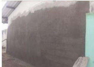
Ilustración 11: Escuela De Educación Básica Fiscal Leonardo Ruiz