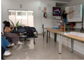
Ilustración 24: Actividades Consejos Estudiantiles