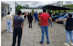
Ilustración 25: Talleres con Coordinadores Unidocentes, Bidocentes y Pluridocentes y DECES sobre Educando en Familia

Talleres con Coordinadores Unidocentes, Bidocentes y Pluridocentes y DECES sobre Educando en Familia Módulo Guía acompañamiento de familias en la construcción de proyectos de vida.