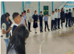
Ilustración 23: Actividades Consejos Estudiantiles