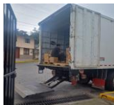
Ilustración 18: Raciones alimenticias