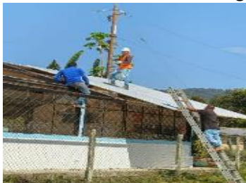
Ilustración 5: Escuela De Educación Básica Fiscal Magdalena Cabezas de Durán