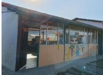
Ilustración 1: Escuela de Educación Básica Fiscal Francisco Salazar Alvarado