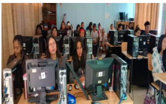
Ilustración 31: Protocolos y rutas a Coordinadores y Autoridades de las 34 I.E.