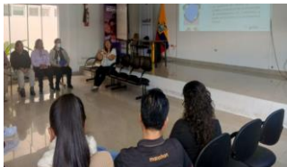
Ilustración 27: Rutas y Protocolos a los compañeros del Distrito

Rutas y Protocolos a los compañeros del Distrito.