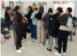
Ilustración 22: Lineamiento de acompañamiento psicosocial y socioemocional