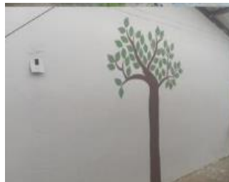
Ilustración 12: Escuela De Educación Básica Fiscal Leonardo Ruiz