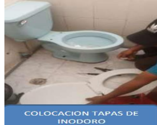
Ilustración 17: Unidad Educativa Nanegal