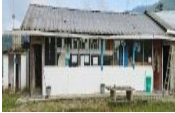
Ilustración 3: Escuela de Educación Básica Fiscal Rcto. San Francisco de Pachijal