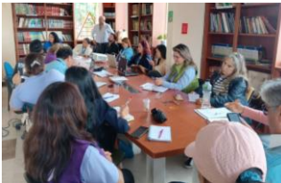
Ilustración 30: Primera reunión mesa interinstitucional