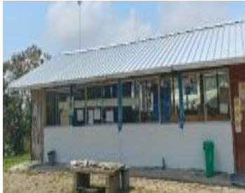
Ilustración 4: Escuela De Educación Básica Fiscal Rcto. San Francisco de Pachijal