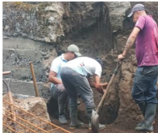
Ilustración 14: Escuela De Educación Básica 14 de Abril