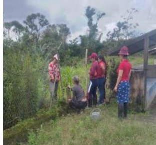
Ilustración 9: Escuela De Educación Básica Fiscal Tupac Yupanqui