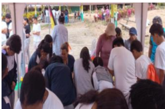
Ilustración 29: Feria en Pachijal sobre Prevención de Violencia