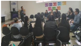
Ilustración 26: Acompañamiento Socioemocional lo primero que le mandé

Acompañamiento Socioemocional lo primero que le mandé.