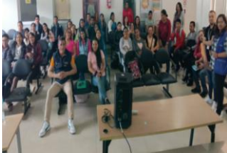
Ilustración 32: Capacitación a Docentes, autoridades en coordinación con MSP sobre ITS