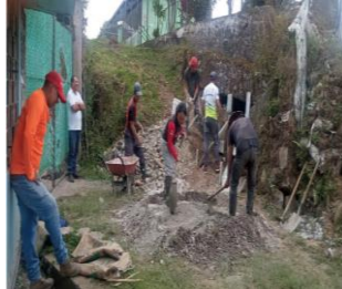
Ilustración 13: Escuela De Educación Básica 14 de Abril