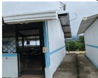
Ilustración 6: Escuela De Educación Básica Fiscal Magdalena Cabezas de Durán