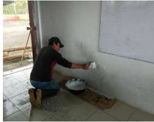
Ilustración 10: Escuela De Educación Básica Fiscal Tupac Yupanqui