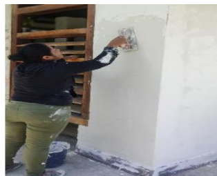
Ilustración 15: Escuela de Educación Básica Fiscal Cumandá