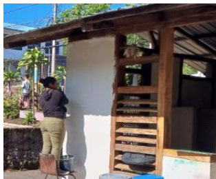
Ilustración 16: Escuela de Educación Básica Fiscal Cumandá