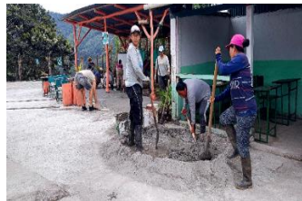
Ilustración 7: Escuela De Educación Básica Fiscal Luz de América