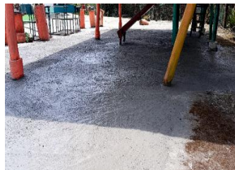
Ilustración 8: Escuela de Educación Básica Fiscal Luz de América