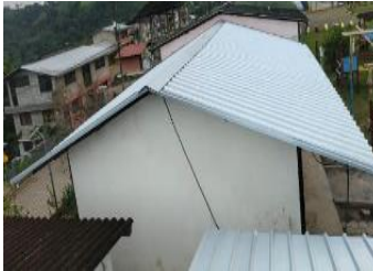
Ilustración 2: Escuela de Educación Básica Fiscal Francisco Salazar Alvarado