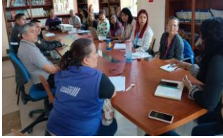
Ilustración 28: Mesa Interinstitucional en Nanegalito