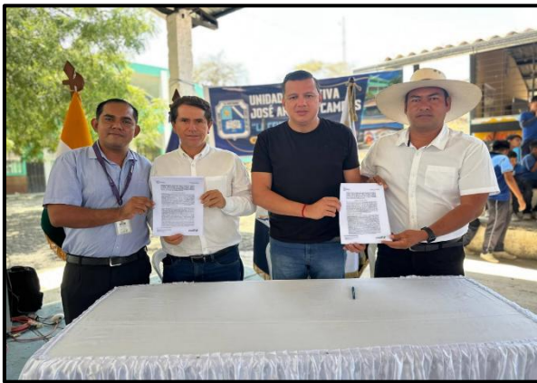
Ilustración 3 Suscripción de convenio interinstitucional COORDINACION ZONAL 7, GADM ZAPOTILLO Y GAD PARROQUIALES (Infraestructura educativa)