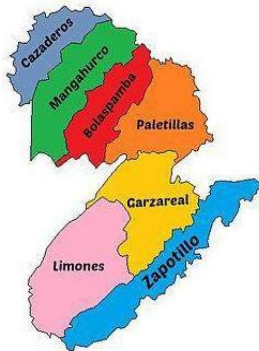
Ilustración 1 Mapa político del cantón Zapotillo