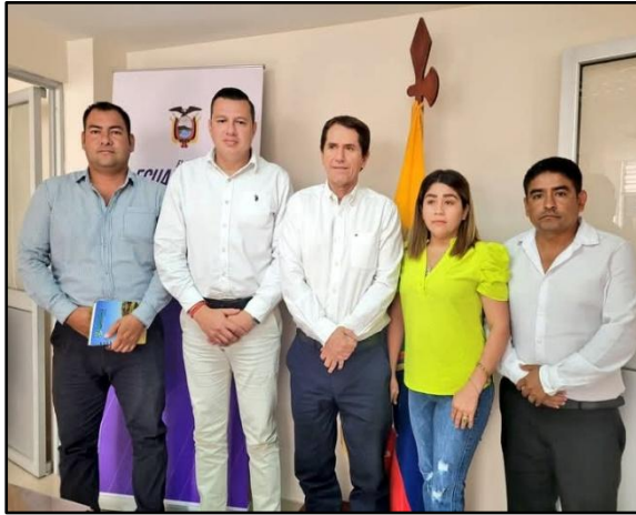
Ilustración 3 Convenio interinstitucional COORDINACION ZONAL 7, GADM ZAPOTILLO Y GAD PARROQUIALES (Transporte escolar)