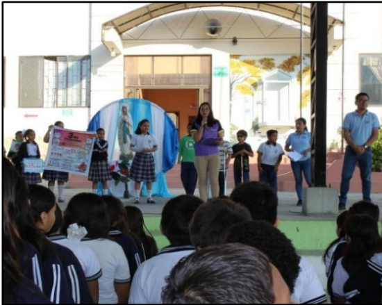
Ilustración 2 Servicios UDAI 11D09 Zapotillo