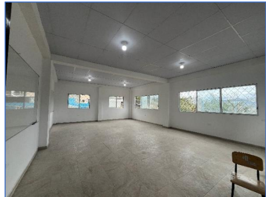
Ilustración 4 Adecuaciones de una nueva aula y mantenimiento de la EEB. Rosalino Montaño