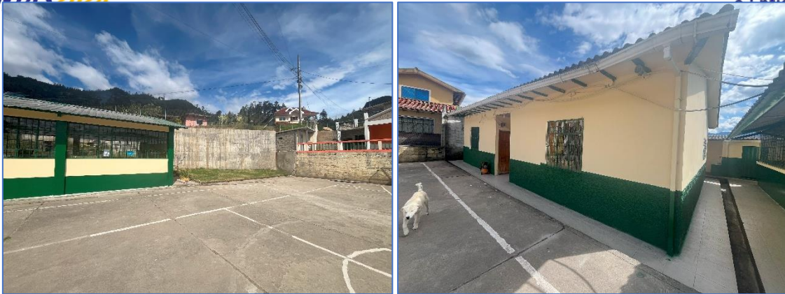
Ilustración 5: Mantenimiento de aulas y construcción de muro CECIB. Francisco Terán.