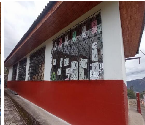
Ilustración 12: Mantenimiento aulas y salón de uso múltiple de la EEB. Ingapirca