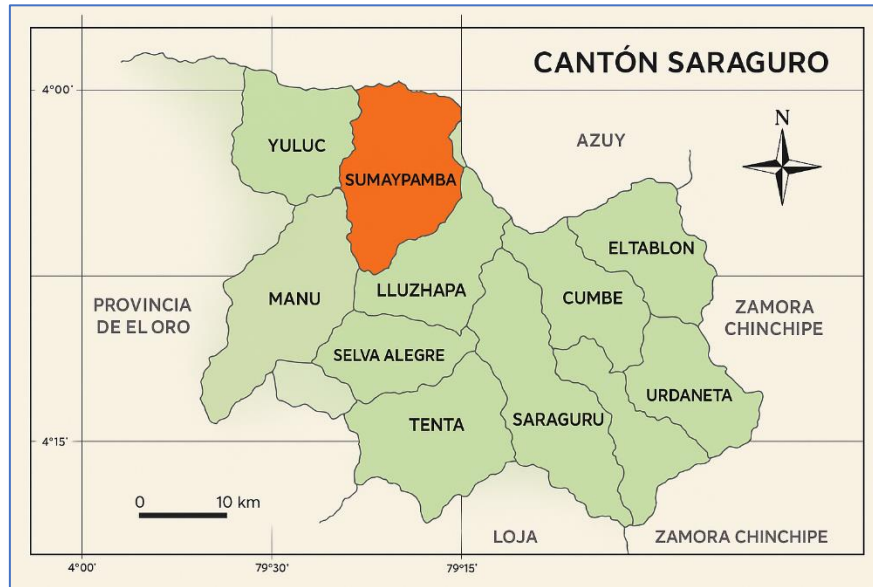
Ilustración 1: Mapa nivel desconcentrado 11D08