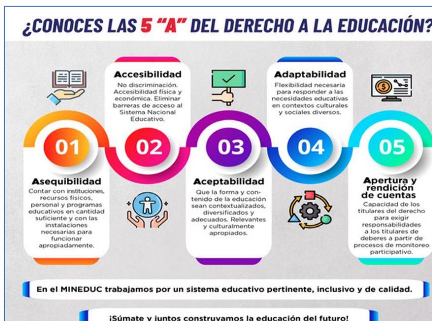
Ilustración 1: 5 "A" de derecho a la educación