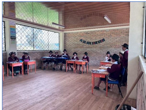
Ilustración 14: Entrega de mobiliario