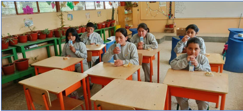
Ilustración 3: Entrega de alimentación escolar.