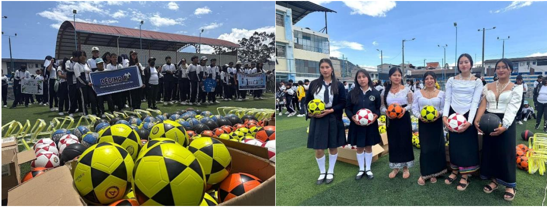
Ilustración 13: Entrega de implementos deportivos