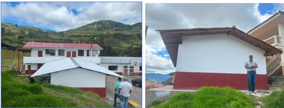
Ilustración 6: Mantenimiento del CECIB. Primicias de la Cultura de Quito.