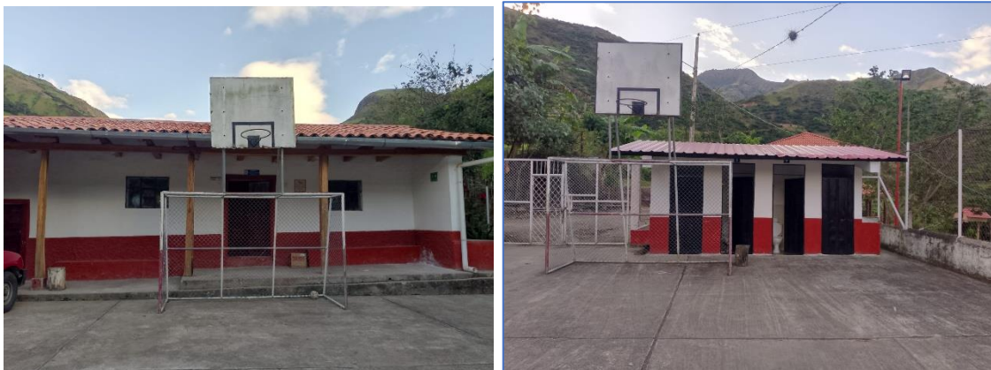
Ilustración 5 Mantenimiento de EEB. Carlos Freire Zaldumbide.