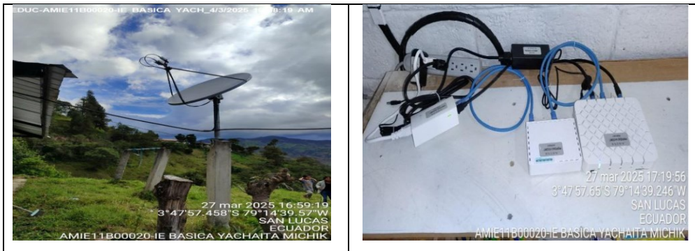
Ilustración 8. Dotación servicio de internet 2025 CPP-E

El servicio de internet en la actualidad es una herramienta digital muy indispensable y más aún para las Instituciones Educativas de los sectores rurales, es así como el Ministerio de Educación, Deporte y Cultura inició a ejecutar en el año 2025, el proyecto denominado “Reducción de Brecha Digital”, en el que se han ejecutado 2 fases beneficiando a 34 establecimientos educativos del distrito 11D01, con servicio de internet satelital, más 1 computador portátil con su debido equipamiento que comprende mouse, mochila y candado de seguridad