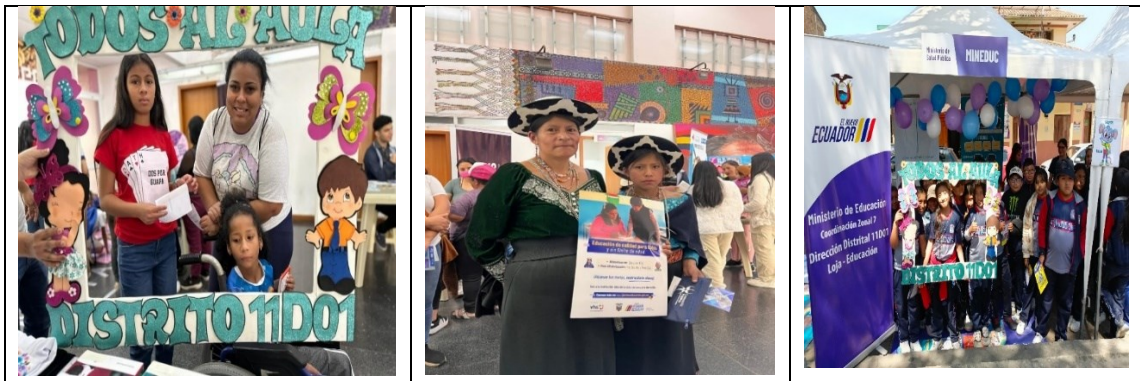
Ilustración 3: Todos al aula