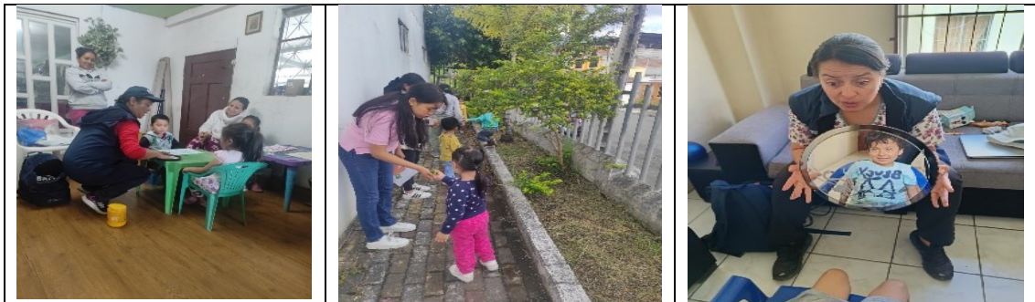
Ilustración 2: Servicio Educativo SAFPI