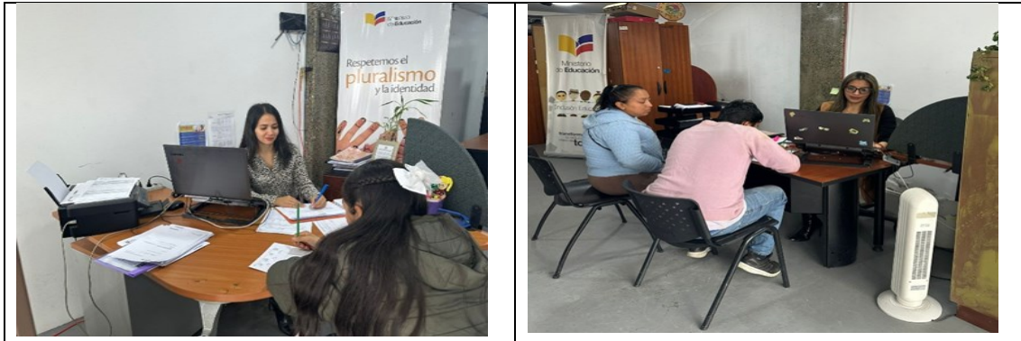
Ilustración 1. Unidad de Apoyo a la Inclusión- UDAI

Inclusión educativa de estudiantes con necesidades educativas específicas vinculadas o no a una discapacidad.