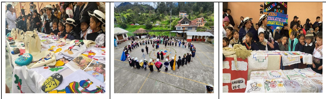
Ilustración 4. Educación Intercultural Bilingüe

En el marco de la Educación Intercultural Bilingüe (EIB) representa el compromiso activo, participativo y corresponsable de la comunidad educativa del pueblo kichwa Saraguro incluyendo autoridades comunitarias, familias, sabias y sabios, maestras y maestros, estudiantes y organizaciones comunitarias en la gestión, diseño, implementación, seguimiento y evaluación de los procesos educativos, en armonía con su cosmovisión, lenguas propias y prácticas culturales. Este eje se articula con los lineamientos curriculares definidos por la Resolución Nro. SEIBE-SEIBE-2025-0017-R , que establece el Plan de Estudios con Periodos Mínimos para los procesos educativos del Sistema de EIB, promoviendo la pertinencia cultural, lingüística y territorial en cada etapa del aprendizaje.