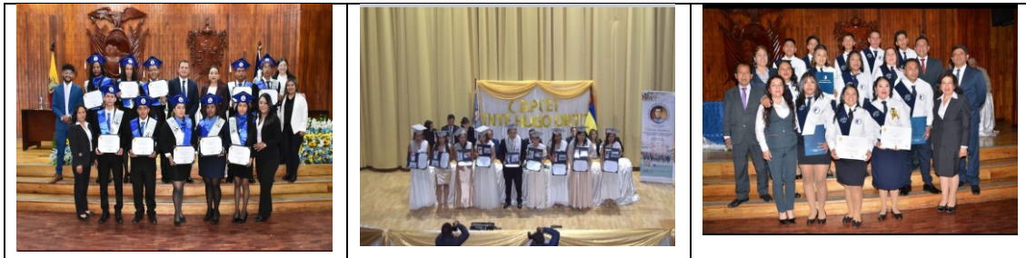
Ilustración 6. Oferta jóvenes y adultos - 2025

La educación para jóvenes y adultos ha sido un pilar fundamental para llegar a los sectores más afectados por el rezago escolar, personas mayores de 18 años que no han continuado con los estudios básicos superiores ni bachillerato por situaciones adversas. En nuestra jurisdicción contamos con una Institución Educativa de sostenimiento fiscal régimen sierra que oferta la educación formal, modalidad semipresencial y virtual.