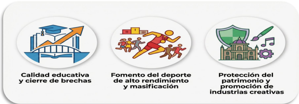
Imagen 1 Ejes