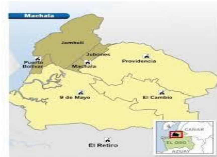
Ilustración N° 1 Parroquias que conforman el Distrito 07D02 Machala-Educación

Durante el año 2025 la gestión del Distrito estuvo enfocada en la planificación del Ministerio de Educación, y se operativizó bajo los siguientes Ejes de acción: Educación segura, Alimentación escolar de calidad, Reinserción escolar, Revalorización docente, Fortalecimiento de la educación en valores y Fortalecimiento institucional.