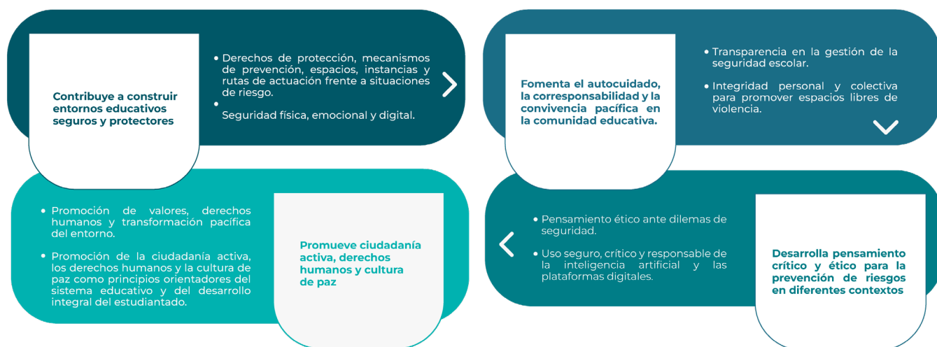
Figura 2. Razones clave para la oportunidad Curricular de Seguridad Integral.

El proceso realizado a través de las mesas técnicas ha permitido identificar que el currículo nacional vigente ofrece una oportunidad clave para abordar temáticas relacionadas con la seguridad integral. De esta manera, el sistema educativo promueve el desarrollo de competencias socioemocionales y ciudadanas, esenciales para el bienestar colectivo y la protección de los derechos de los estudiantes. A continuación, se presentan las razones clave para identificar y abordar estos enfoques dentro del currículo nacional, destacando su relevancia en la formación integral de los educandos.