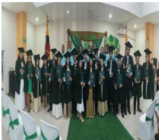
Ilustración 4 estudiantes titulados