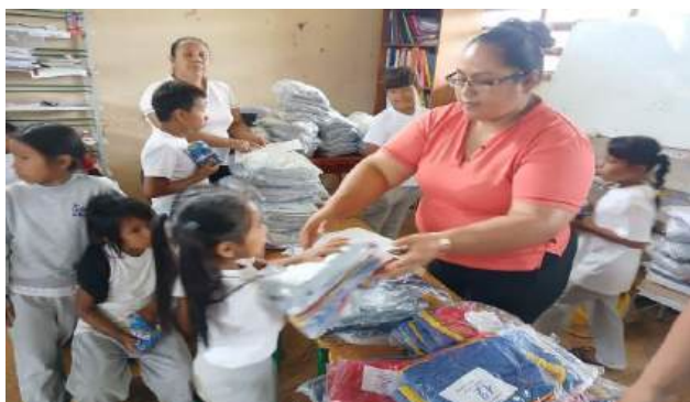
Ilustración 10 fotografías uniformes escolares