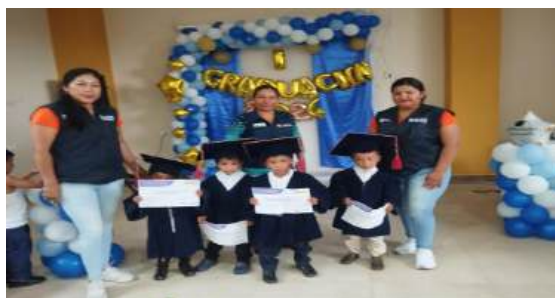
Ilustración 3 fotografía SAFPI

Es un Servicio extraordinario, que se implementa a las familias que tienen niños y niñas de 3 y 4 años que no asisten a otro servicio o modalidad de educación inicial, o que, por diversas circunstancias, ubicación geográfica o por decisión de los padres y madres, no acuden a una institución educativa.