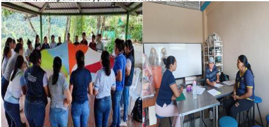
Ilustración 6, 7 Fotografías rutas y protocolos en casos de violencia