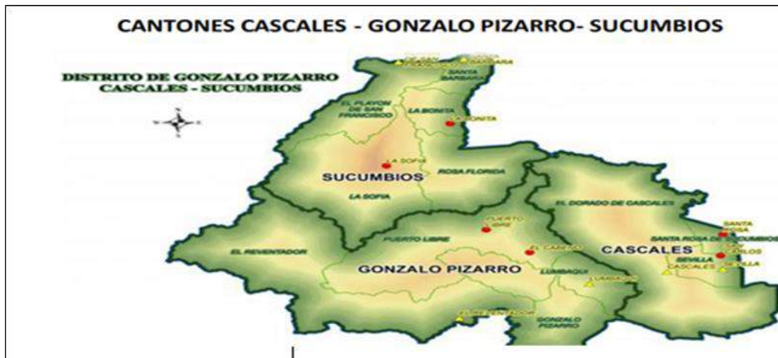
Gráfico 1 Ubicación de la Dirección Distrital 21D01

“Juntos cumplimos y lo hacemos con todos ustedes”