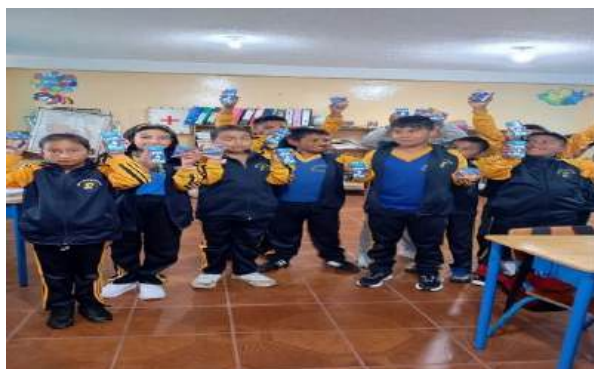
Ilustración 7 Alimentación Escolar

Se implementa el Plan Distrital de Gestión de Riesgos en las 69 instituciones educativas, con actualización y seguimiento constante para garantizar ambientes escolares seguros y resilientes. Se organizan brigadas escolares, comités de riesgos y simulacros periódicos, además de coordinar con autoridades locales para la prevención y respuesta ante emergencias. Se gestionan trámites para la entrega y mejora de infraestructura, como la Unidad Educativa Reventador, asegurando espacios adecuados y seguros para la comunidad educativa.