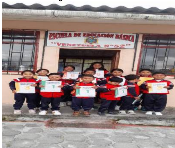
Ilustración 9 Fotografía textos escolares