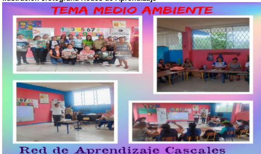
Ilustración 5 fotografía Redes de Aprendizaje

Las Redes de Aprendizaje, son estrategias de apoyo a la calidad educativa en los niveles de Educación Inicial y Preparatoria, que fortalece la aplicación de los Currículos Nacionales y las prácticas docentes. Las Redes de Aprendizaje en Educación Inicial y Preparatoria se han consolidado gracias al apoyo brindado por las autoridades nacionales y de niveles desconcentrados, facilitando la participación de todos los docentes de las instituciones educativas que oferta educación inicial y preparatoria del distrito 21DO1 Cascales-Gonzalo Pizarro-Sucumbíos – Educación.