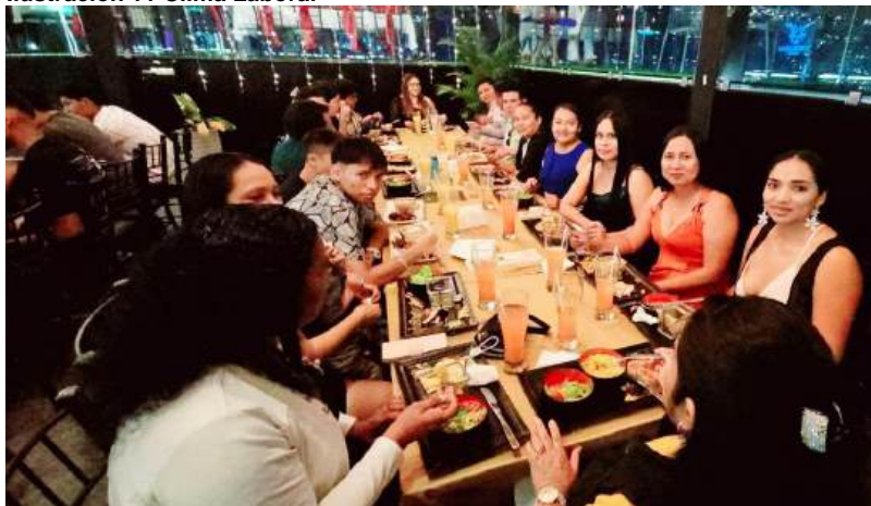
Ilustración 11 Clima Laboral

Con el fin de conservar un ambiente laboral favorable, se ha mantenido capacitaciones entre los servidores públicos trimestrales durante todo el año 2024, con el objeto de mantener un clima excelente donde se sientan a gusto sabiendo que sus expectativas se cubren, realizando charlas, talleres, conversatorios internos sobre temas inherentes a la necesidad del área por parte de los colaboradores del