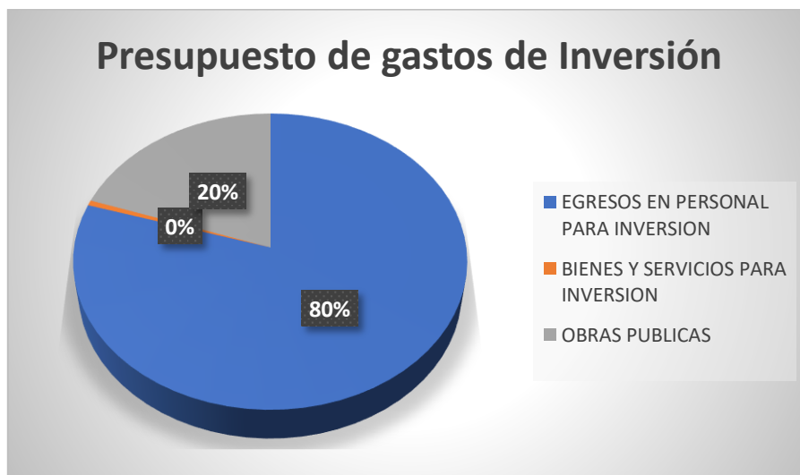
Gráfico 2: Presupuesto de Gasto inversión

Fuente: Unidad Distrital Administrativo Financiero Elaboración: Unidad Distrital de Planificación