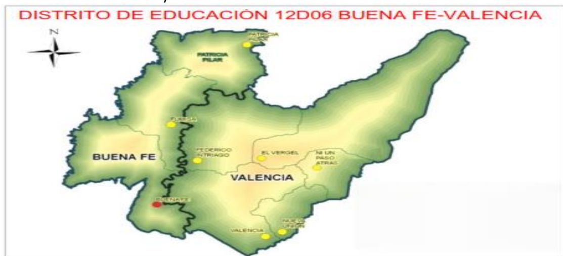
Tabla 1.- Mapa Geográfico

La Dirección Distrital 12D06, ubicado en el Cantón Buena Fe tiene la jurisdicción en dos Cantones de la Provincia de los Ríos, Buena Fe y Valencia; está conformado por 10 Circuitos Educativos, donde se atiende a 94 Instituciones Educativas de Sostenimiento Fiscal, 9 Particular, y 1 Fiscomisional.