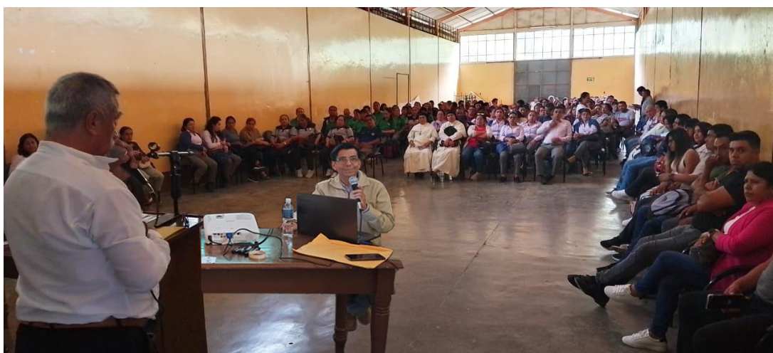
Ilustración 19. Socialización y orientación para la Conformación de organismos escolares