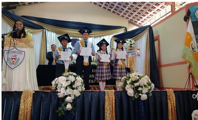
Unidad Educativa Monseñor Luis Alfonso Crespo Chiriboga