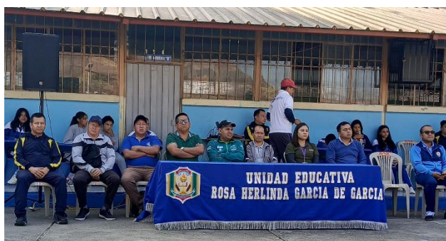
Ilustración 18. Campeonato intercolegial.

Con el fin de fomentar el compañerismo y la participación estudiantil, se realizó el campeonato intercolegial; en el cual, participaron estudiantes de 11 Instituciones Educativas, creando oportunidades de aprendizaje y crecimiento, desarrollando destrezas y habilidades del trabajo en equipo.