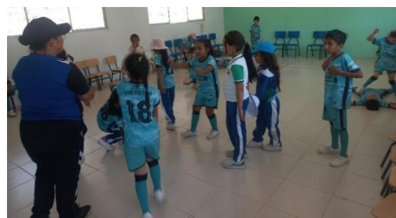
Ilustración 5. Recorrido Participativo en Prevención de Violencia Sexual