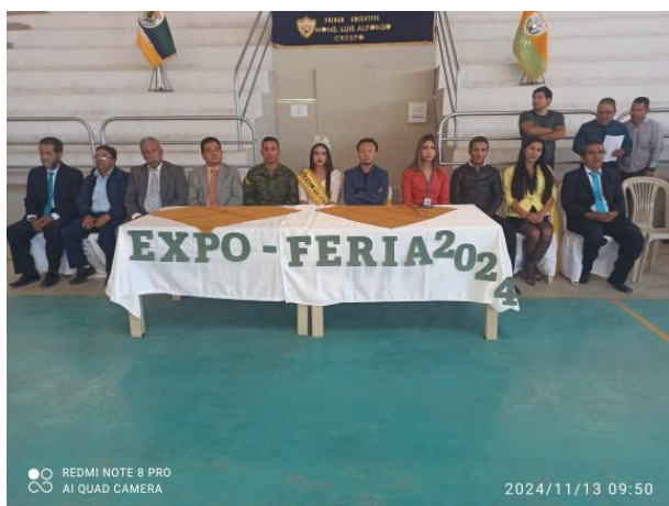
Ilustración 17. Estudiantes de la especialidad técnico en agropecuaria