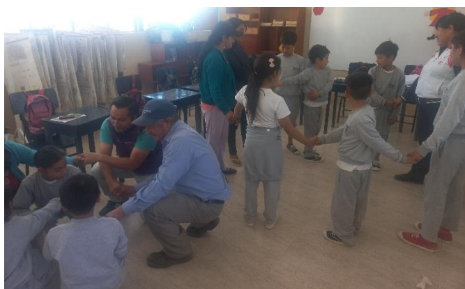
Ilustración 16. Socialización OVP