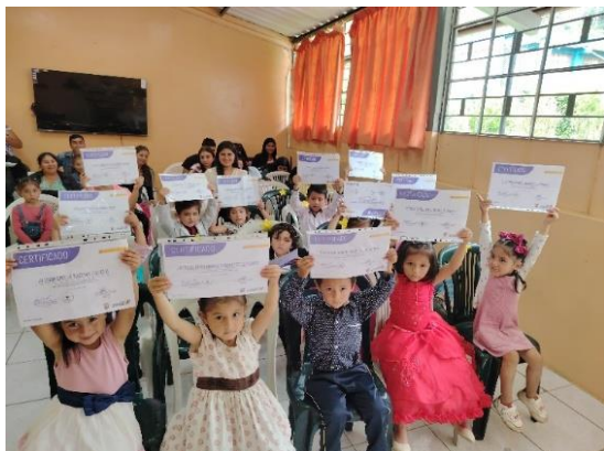
Clausura del año lectivo de los niños grupo 4 años SAFPI 2024