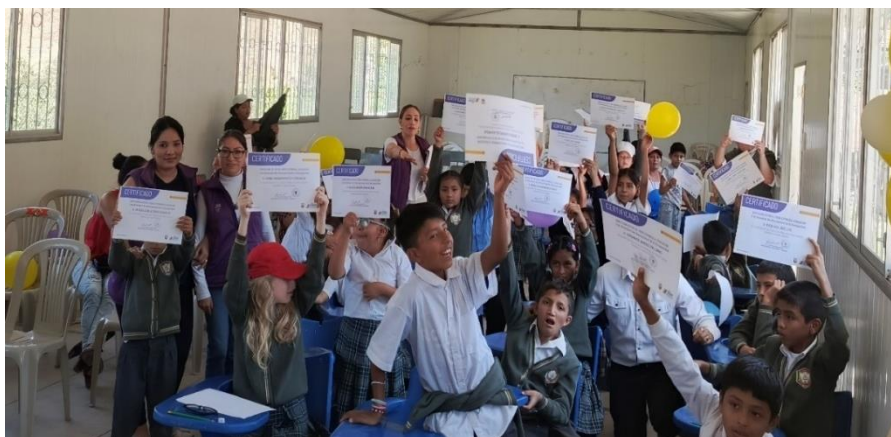
Ilustración 9. Agasajo a niños, niñas y adolescentes por el 3 de diciembre "Día Internacional de las Discapacidades"

Así también se sensibilizó y Orientó a todos los docentes de las 58 Instituciones Educativas pertenecientes a nuestro Distrito, y a padres de familia en diferentes temas relacionados a la Inclusión Educativa.