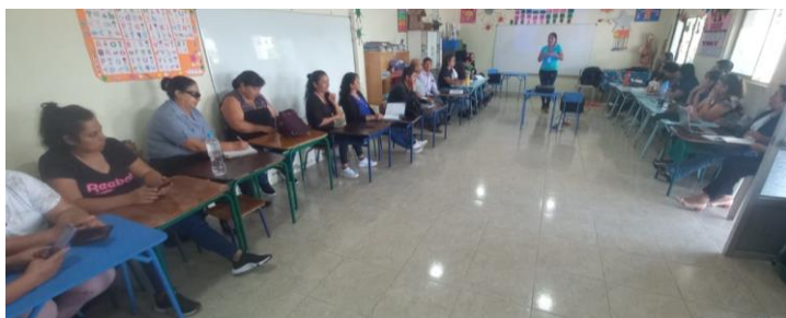
Ilustración 10. Docentes sensibilizados de diferentes Instituciones Educativas

Dentro del sistema educativo y por medio del Archivo Maestro de Instituciones Educativas (AMIE) se obtiene información detallada sobre los datos de los estudiantes promovidos, no promovidos, desertores, a mayo 2024.