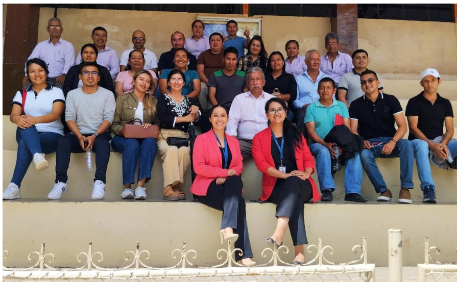
Ilustración 20. Capacitación de docentes en el área de matemáticas.

226 docentes y 58 directivos de las diferentes Instituciones Educativas de Sostenimiento Fiscal y Fiscomisional de nuestra Jurisdicción 11D05 – Espíndola - Educación, participaron en el 2do encuentro informativo y de capacitación, realizado los días 25 y 26 de abril de 2024, enfocados en brindar los conocimientos y las indicaciones adecuadas para que, los directivos puedan asignar la correcta carga horaria a cada uno de los docentes que se encuentran bajo su tutela, acorde a la Malla Curricular vigente: “mineduc-mineduc-2023-00008-a_curriculum_priorizado,_planes_estudio_y_jornada_docente”.