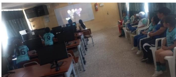
Ilustración 4. Actividades de Prevención de Bullying.