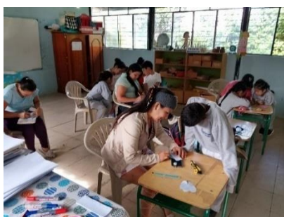
Ilustración 14. Socialización Estrategia ENEIS