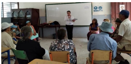
Ilustración 12. Estudiantes de Alfabetización