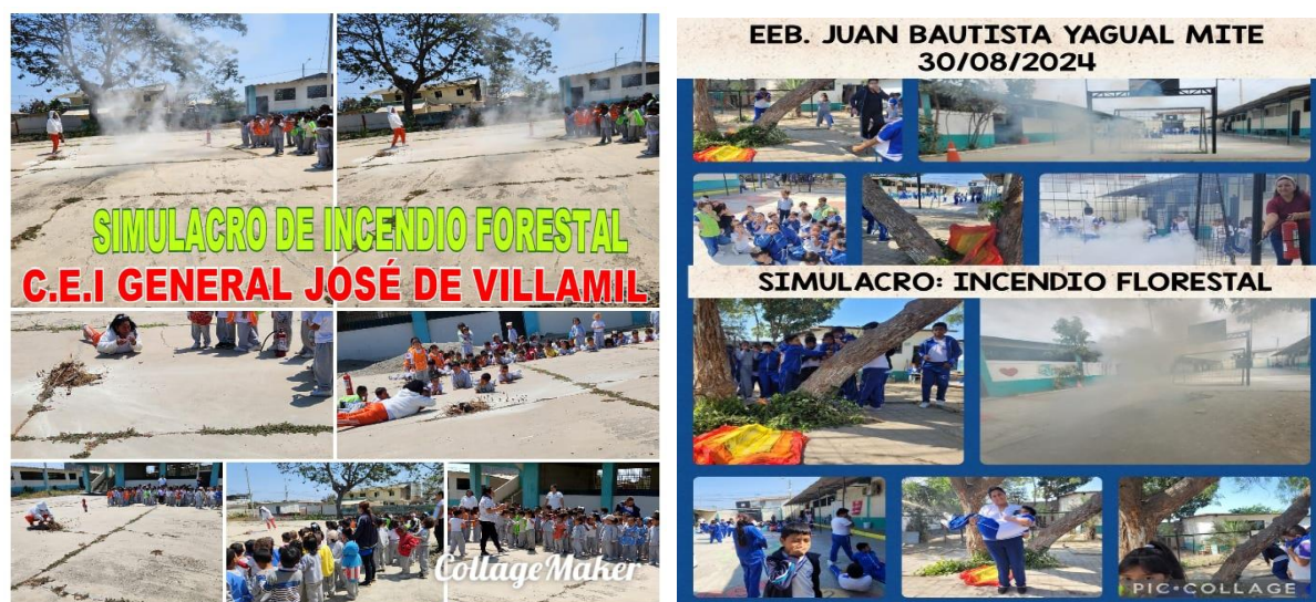
Ilustración 7: Elaborado por la Dirección Distrital 09D22, fuente MINEDUC)

Dando cumplimiento con las directrices emitidas, se desarrolló un ejercicio de simulacro el último viernes de cada mes, en las 35 instituciones educativas fiscales, particulares y fisco misional de las jornadas matutina y vespertina.