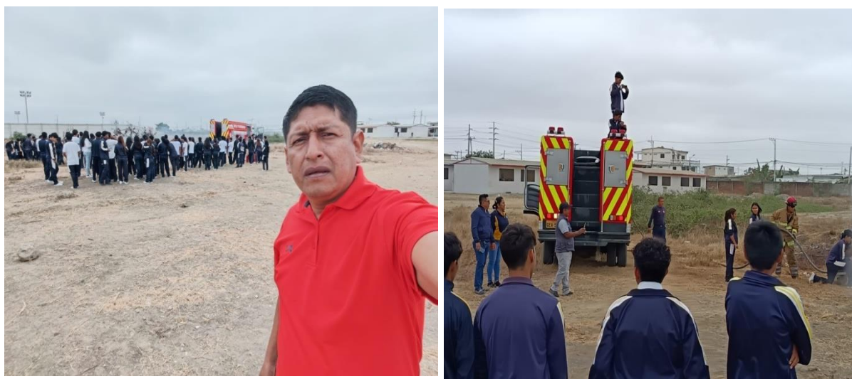
Ilustración 3: Elaborado por la Dirección Distrital 09D22, fuente MINEDUC)