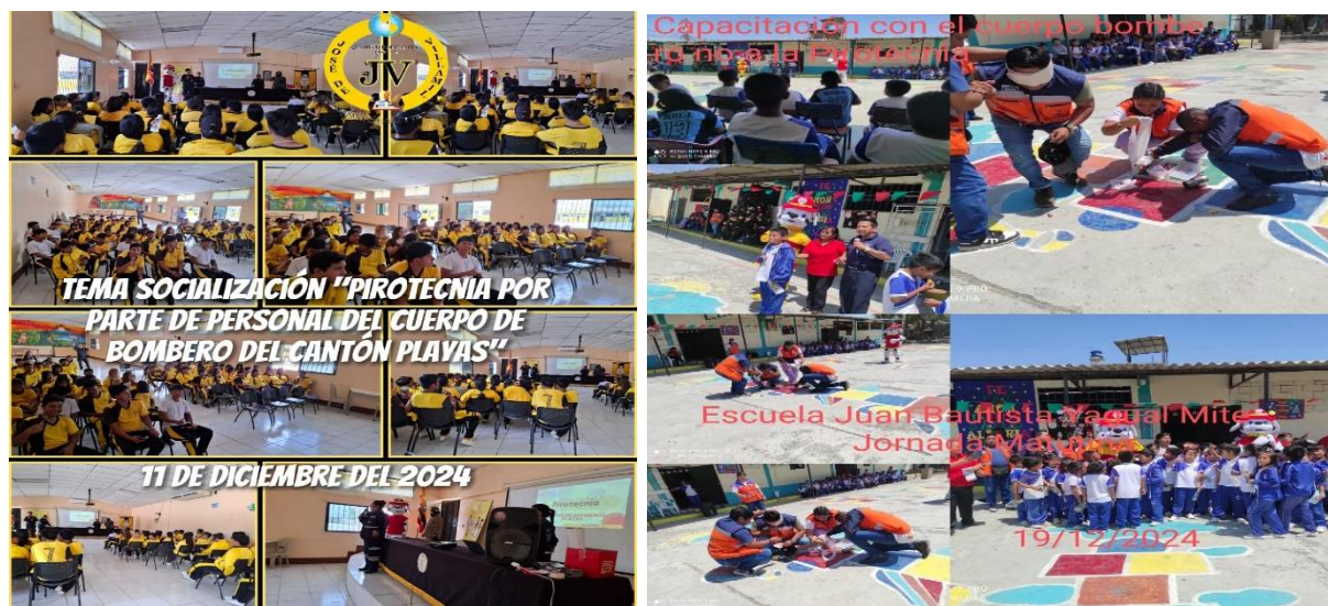
Ilustración 5: Elaborado por la Dirección Distrital 09D22, fuente MINEDUC