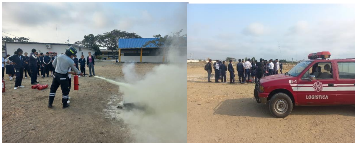
Ilustración 2: Elaborado por la Dirección Distrital 09D22, fuente MINEDUC)