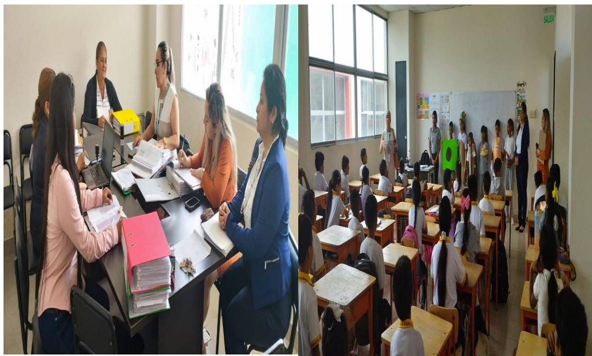
Ilustración 8 Elaborado por la Dirección Distrital 09D22, fuente MINEDUC)