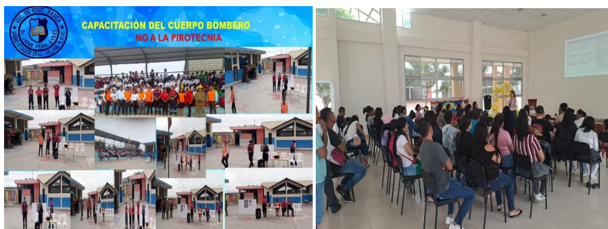
Ilustración 6: Elaborado por la Dirección Distrital 09D22, fuente MINEDUC

Treinta y cinco instituciones educativas cuentan con un Plan de Reducción de Riesgo, diseñados para prevenir los desastres naturales y antrópicos.