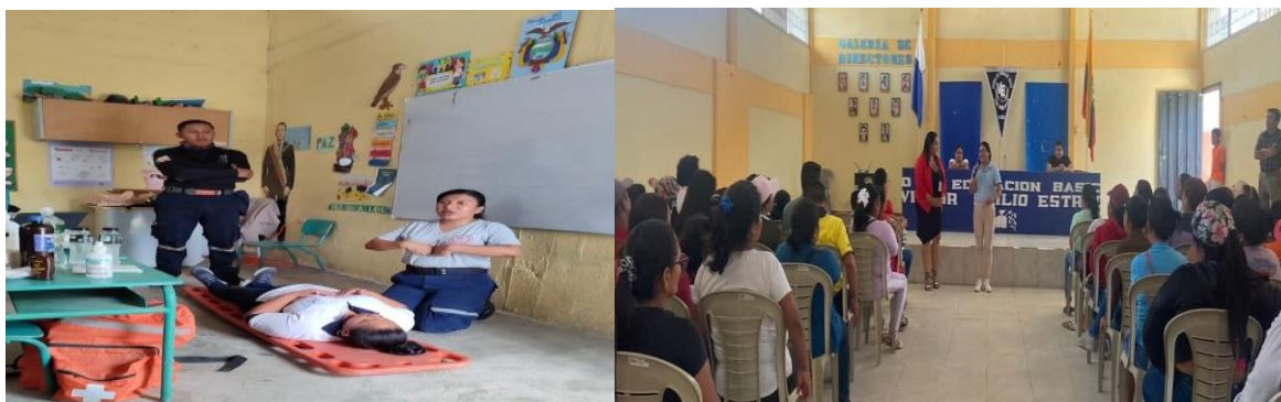
Ilustración 4: Elaborado por la Dirección Distrital 09D22, fuente MINEDUC)