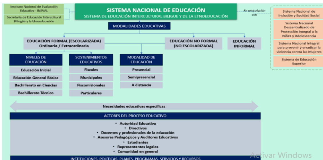
Ilustración 2.- Conformación del Sistema Nacional de Educación.