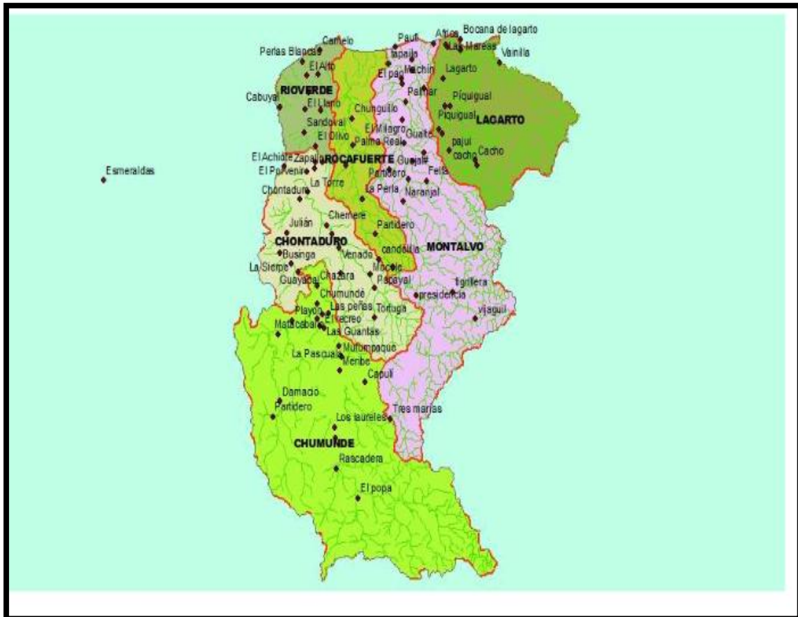
Ilustración 3.- Mapa de la distribución geográfica

La Dirección Distrital 08D06 RIOVERDE-EDUCACIÓN, mantiene su sede administrativa en la ciudad de Rioverde, está integrada por el cantón Rioverde entre las principales características de la región, es la mayor en diversidad de pueblos y nacionalidades indígenas, entre los que se destacan: Chachi, el pueblo afroecuatoriano se encuentra asentado en la región. Para ello el servicio educativo regula alrededor de 85, Instituciones Educativas de todos los niveles y tipos de sostenimiento.