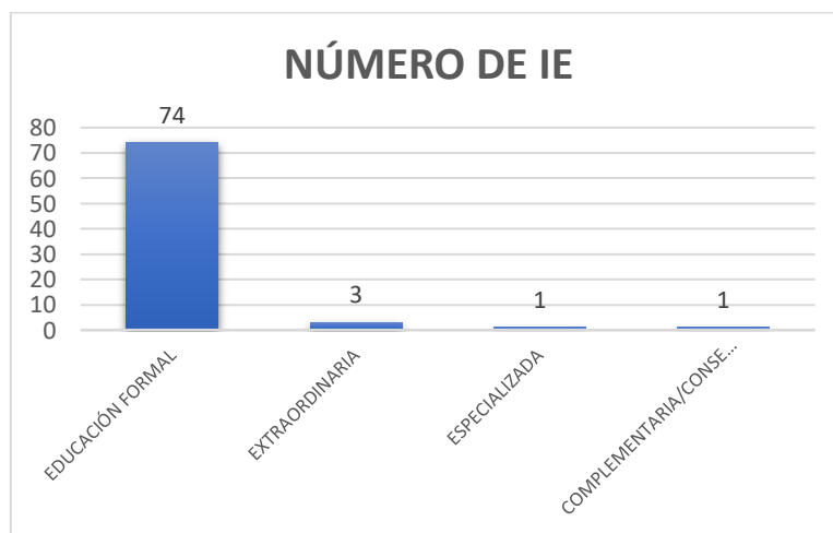
Gráfico 3: Cantidad de instituciones educativas por tipo de educación