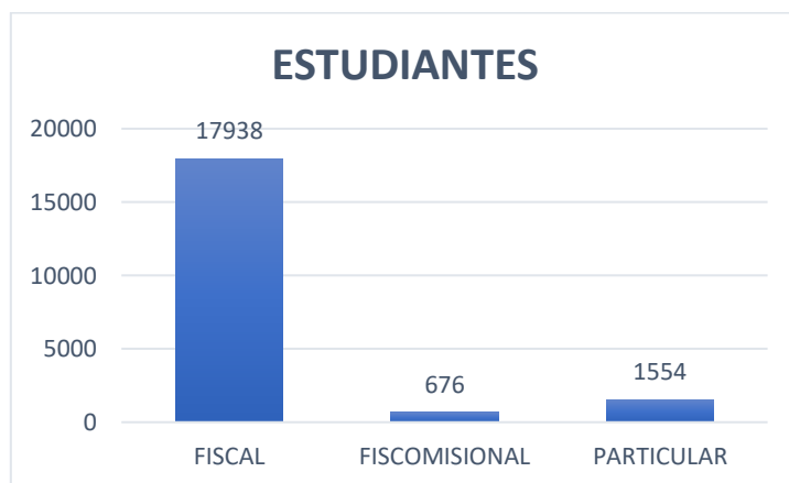
Gráfico 2: Número de estudiante por sostenimiento

El programa Comunidades Educativas Seguras y Protectoras está destinado a fortalecer la seguridad en el sistema educativo, con enfoques diferenciados según los niveles de riesgo y promoviendo la participación de toda la comunidad educativa. Además, se establece una priorización de las unidades educativas según su nivel de riesgo, lo que permite una intervención más efectiva y la asignación de recursos adecuados.