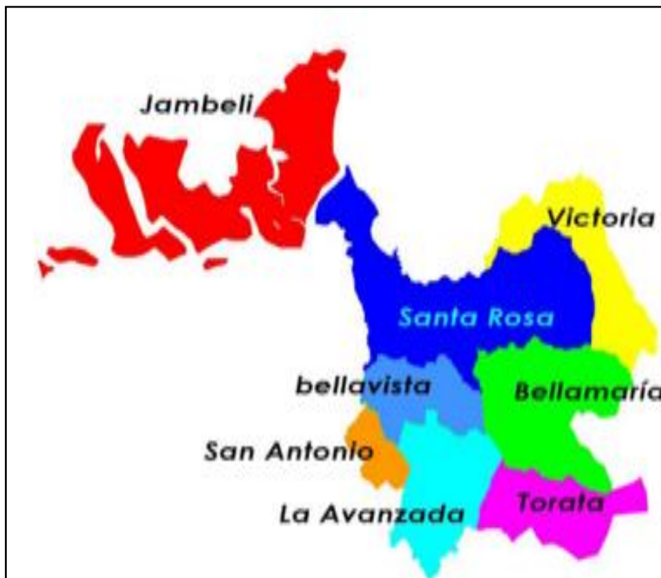
Gráfico 1: Distribución del Distrito 07D06