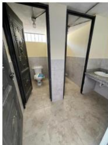
EEB. HOLGER LINO ESTRADA