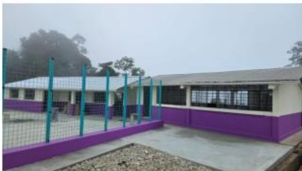
EEB. 27 DE FEBRERO