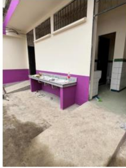
EEB. 3 DE NOVIEMBRE