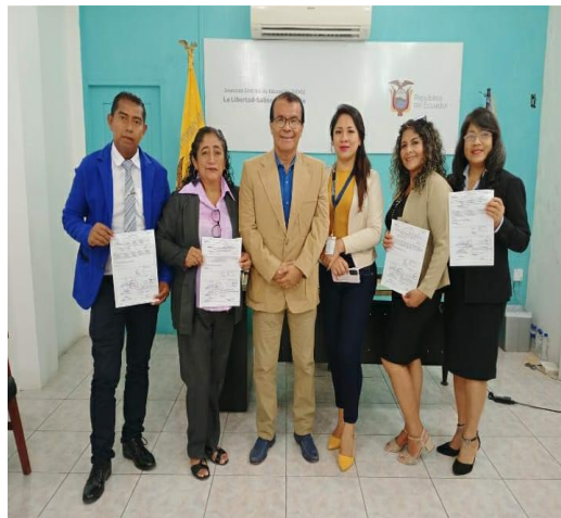
Fotografía N° 05: Elaborado por la Dirección Distrital 24D02, Fuente (UDTH-24D02)