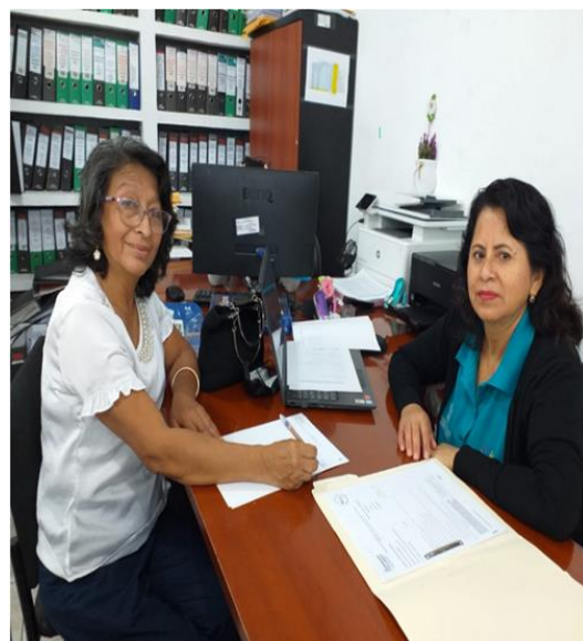
Fotografía N° 01 - 02: Elaborado por la Dirección Distrital 24D02, Fuente (UDTH-24D02)