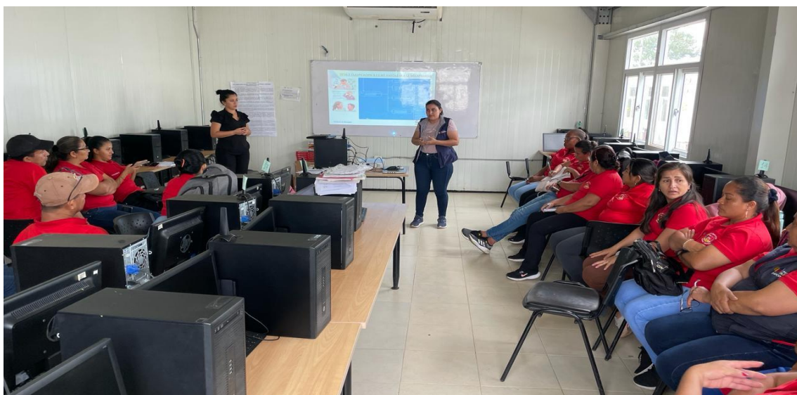
Tabla 16 Docentes Pedagogos de Apoyo a la Inclusión