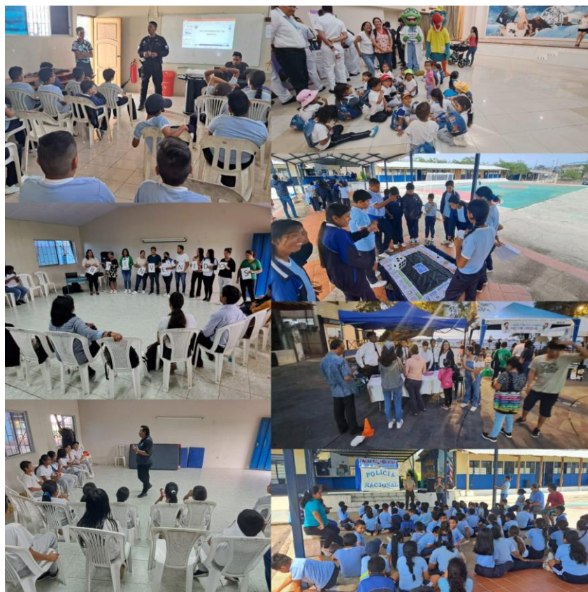
Ilustración 5. Actividades Lúdicas

Se ha fortalecido la creatividad, el uso de metodologías artísticas, lúdicas sin generar gastos en los padres de familia, así como también la participación de todos los estudiantes sin límite de edad.