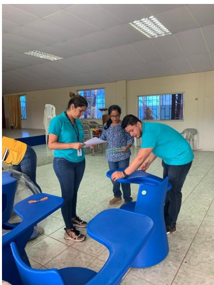
Ilustración 11. Entrega de Pupitres Escolares