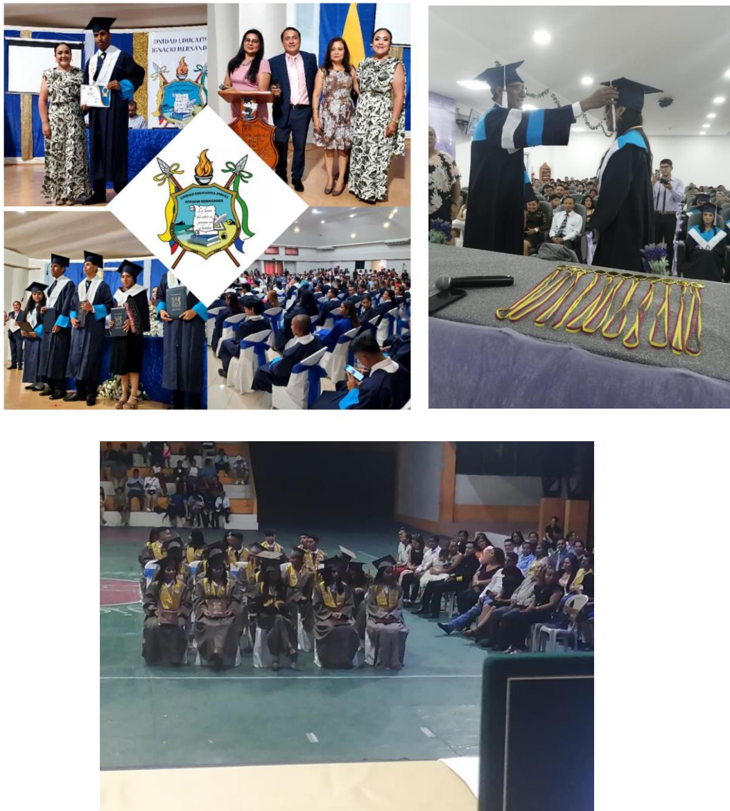
Tabla 6. Seguimiento, revisión de expedientes académicos, validación de notas a la plataforma CAS, emisión de actas de grado y títulos de bachiller, año lectivo 2023-2024