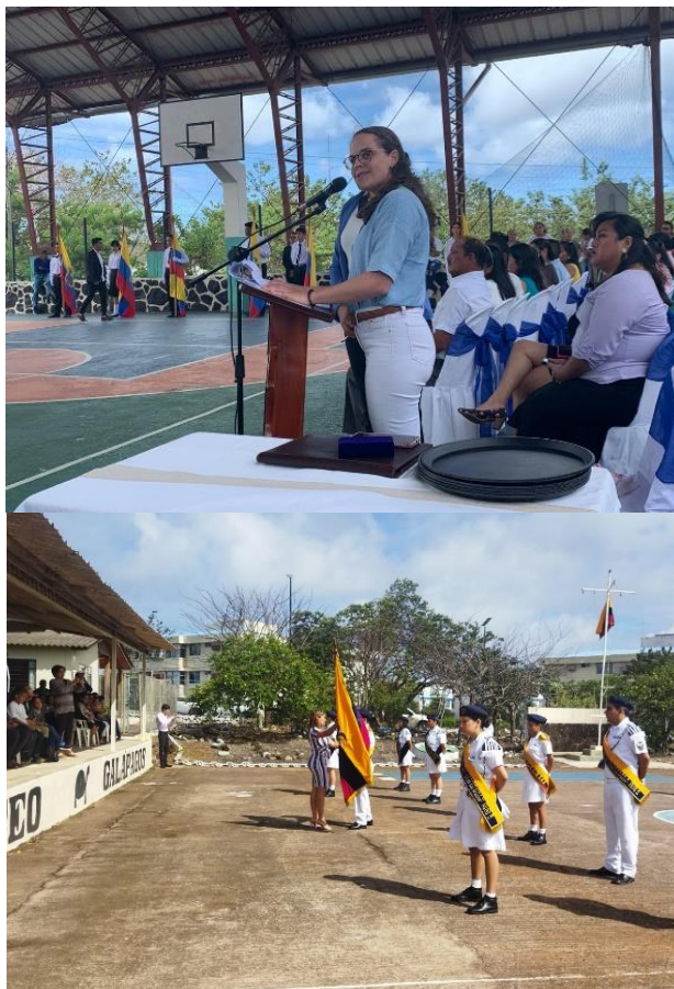
Ilustración 4. Juramento a la Bandera Nacional