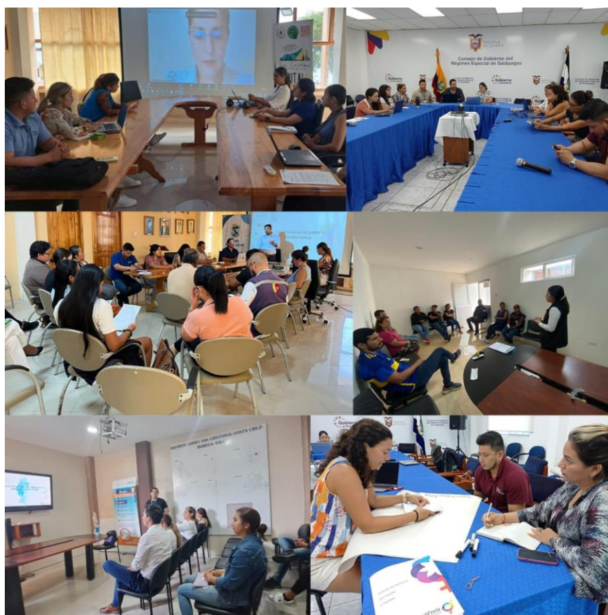
Ilustración 7. Mesas Técnicas