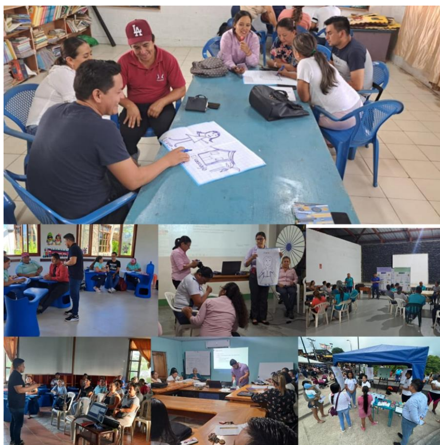
Ilustración 6. Buen Vivir 2023