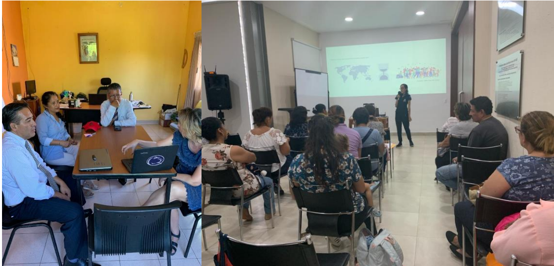
Ilustración 10. Capacitación Docente