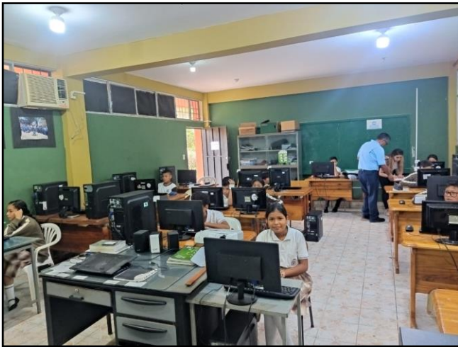
Ilustración 12. Proceso Ser Estudiante

Apoyo técnico en proceso SER ESTUDIANTE dirigido a estudiantes de 4to, 7mo, 10mo, y 3ero GBU, se contó con 3 SEDES seleccionados para este proceso de evaluación: UE San Cristóbal – cantón San Cristóbal, UE San Francisco de Asís – cantón Santa Cruz, UE Jacinto Gordillo – cantón Isabela.