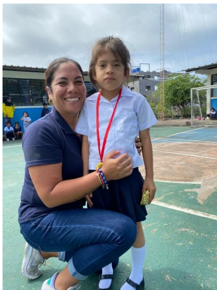
Ilustración 8. Actividades UDAI