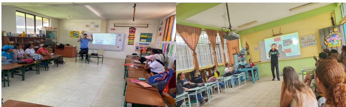
Ilustración 2. Actividades de Redes de Aprendizaje: