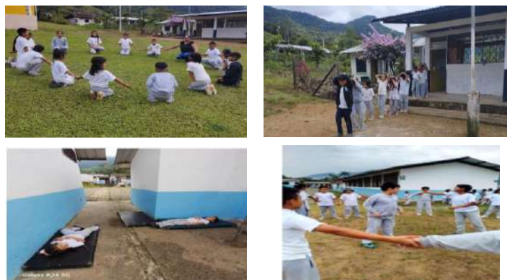
Tabla 11. Simulacros y Simulaciones

Elaboración: Unidad Distrital de Administración Escolar.