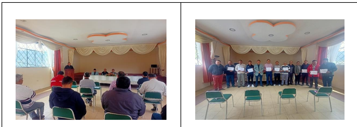
Ilustración 4 CAPACITACIÓN DE DOCENTES DE LAS CINCO INSTITUCIONES EDUCATIVAS CON LA FIP PROFESIONAL DE ELECTROMECAÁNICA AUTOMOTRIZ E INSTALACIONES, EQUIPOS Y MÁQUINAS ELÉCTRICAS.