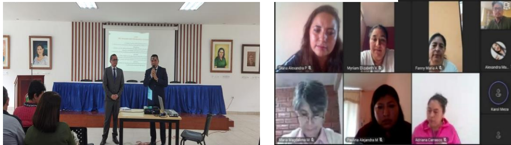
Ilustración 6 Capacitación dirigida a las autoridades educativas.