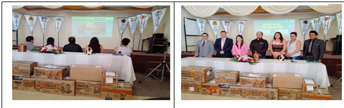
Ilustración 3 DONACIÓN DE HERRAMIENTAS POR CRISFE A LA UNIDAD EDUCATIVA “BAÑOS”

Elaboración: Marcia López, Analista REGULACIÓN (E)