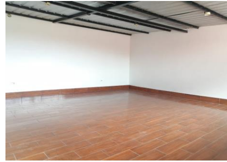
Imagen 32: I.E. Rosa Maria Lopez Vaca