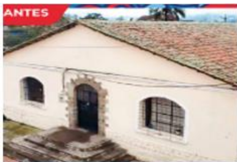
Imagen 16: Antes

INSTITUCIÓN BENEFICIADA: ENRIQUE PONCE GANGOTENA ADMINISTRADOR DEL CONVENIO: DIRECTORA DISTRITAL DE EDUCACIÓN 17D09 TUMBACO PLAZO HASTA LA ENTREGA RECEPCION DE LA OBRA INICIO PRIMERA SEMANA DE MARZO MONTO TOTAL DESDE LA VIGENCIA DEL CONVENIO: $ 124999.33