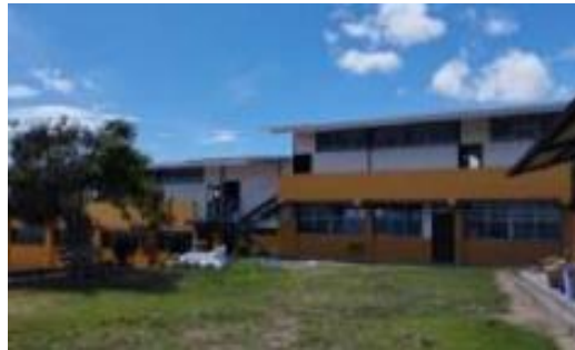
Imagen 9: Unidad Educativa Tres de Diciembre