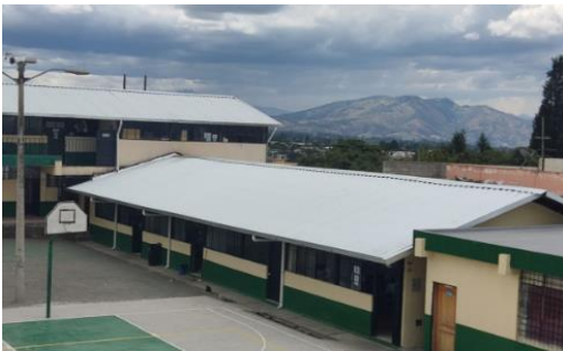
Imagen 14: Cambio de cubiertas