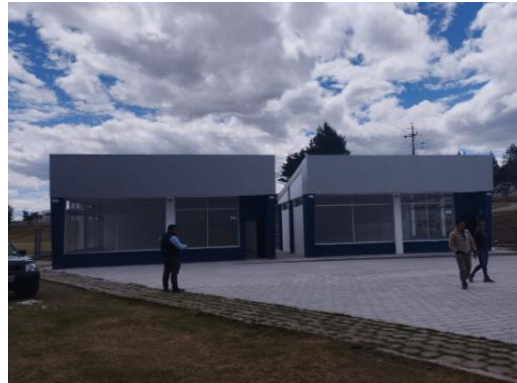
Imagen 7: Unidad Educativa Tumbaco