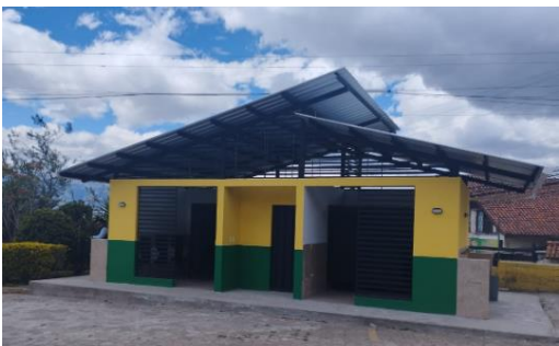
Imagen 8: Institución Educativa Cumbayá