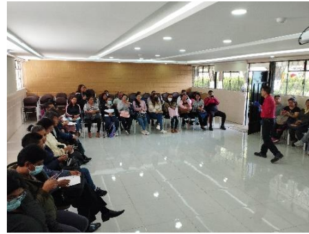
Imagen 36: Capacitación en prevención y evacuación eventos peligrosos

Con la colaboración de la Administración Zonal Tumbaco, la secretaria General de Seguridad y Gobernabilidad Cuerpo de Bomberos de Quito, se realizaron las reuniones de trabajo, y recorridos a fin de determinar las Rutas de Evacuación y puntos de Encuentro de las Unidades Educativas que se encuentran en la franja de zona de riesgo ante una posible erupción del volcán Cotopaxi.