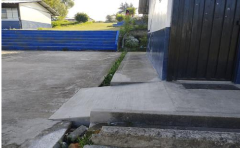
Imagen 27: Obras Wash / obras de resiliencia (mantenimiento de baterías sanitarias y recolección de aguas lluvias para reutilización)