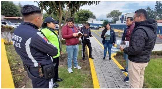
Imagen 37: Recorrido Puntos Encuentro Erupción Volcánica

Con la colaboración de la Administración Zonal Tumbaco, la secretaria General de Seguridad y Gobernabilidad Cuerpo de Bomberos de Quito, se realizaron las reuniones de trabajo, y recorridos a fin de determinar las Rutas de Evacuación y puntos de Encuentro de las Unidades Educativas que se encuentran en la franja de zona de riesgo ante una posible erupción del volcán Cotopaxi.