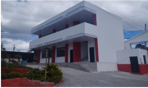
Imagen 2: Institución Educativa Eduardo Salazar Gómez