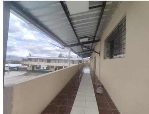
Imagen 13: Protección de accesos con cubierta