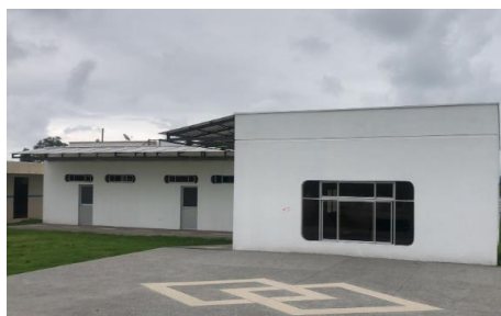
Imagen 18: Antes I.E. 24 de Julio