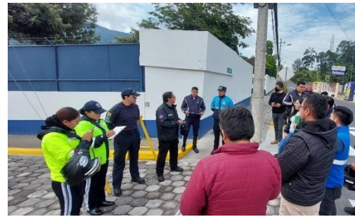
Imagen 38: Recorrido Rutas de Evacuación.

Se realizó diferentes capacitaciones para docentes de las instituciones Educativas sobre riesgos con el apoyo del Cuerpo de Bomberos, Ministerio de Salud y Cruz Roja.