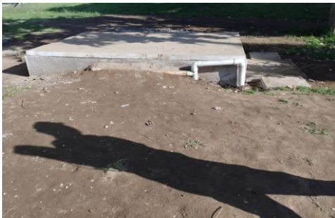
Imagen 29: Tanque de recolección y tratamiento de aguas lluvias