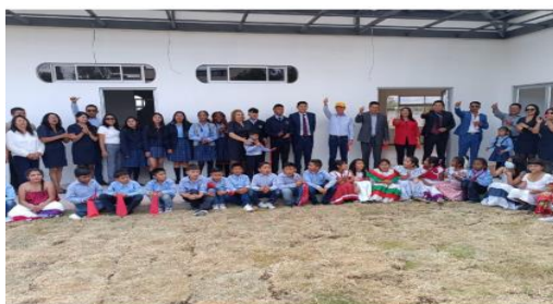
Imagen 19: Ejecución Obra