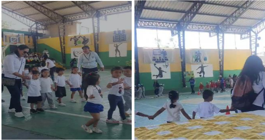
Imagen 45: inauguración del campeonato interno de deporte estudiantil.

todos los sostenimientos. Evento que promueve el bienestar y la sana convivencia de los estudiantes de esta jurisdicción.