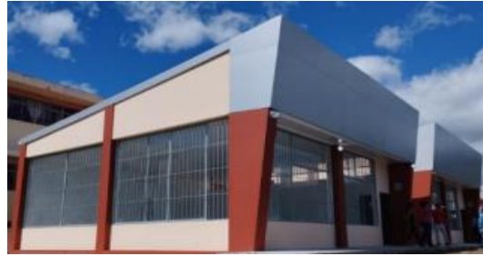
Imagen 2: Unidad Educativa Carlos María de la Torre