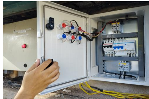
Imagen 30: implementación de celdas fotovoltaicas y tableros para optimización de energía eléctrica