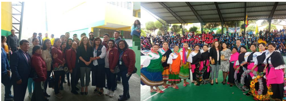
Imagen 44: Final de Básquet Docentes con presencia de Ministra y Subsecretario.