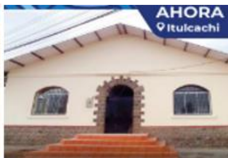
Imagen 17: Ejecución Obra