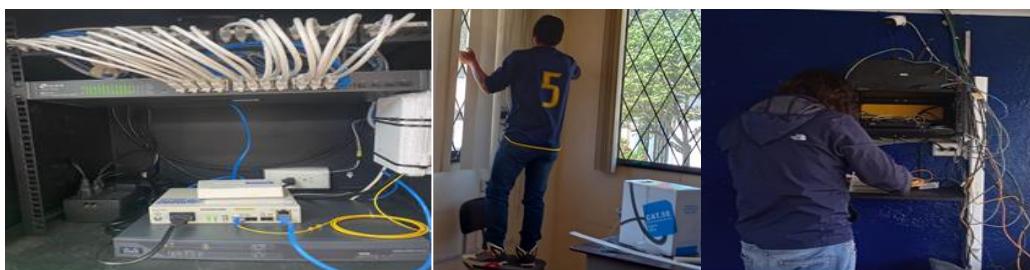
Imagen 33: Sistemas informáticos