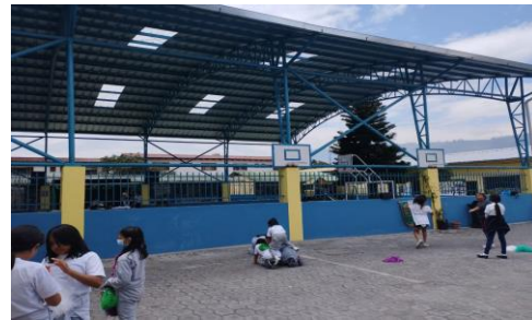
Imagen 21: I.E. Carmen Amelia Hidalgo