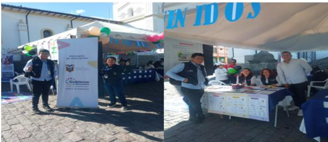
Imagen 46: Campaña Ecuador crece sin desnutrición infantil

Con el objetivo de realizar un trabajo articulado entre las instituciones gubernamentales la secretaría técnica de Ecuador crece sin desnutrición infantil genera espacios llamados caravanas infancia con futuro . La Dirección Distrital de Educación 17D09 Tumbaco colabora en las caravanas infancia con futuro en las parroquias de Pifo, Yaruqui y el Quinche en las mismas que participa el Departamento de Consejería Estudiantil (DECE) Distrital generando espacios con la metodología Recorrido Participativo el mismo que tiene como objetivo brindar la información necesaria en cuanto a la prevención de todo tipo de violencia en el ambiente escolar, así también se genera información para que la comunidad tenga conocimiento de los Protocolos y rutas de actuación frente a situaciones de violencia detectadas o cometidas en el sistema educativo.