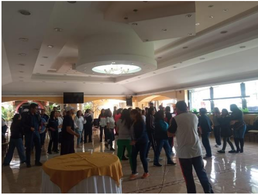
Imagen 41: Socialización Chatarrización y conformación de ternas