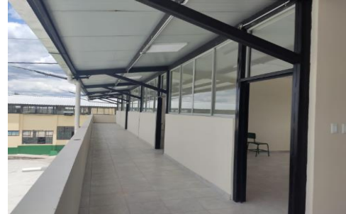
Imagen 11: Ampliación de aulas