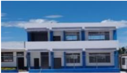
Imagen 4: Unidad Educativa Arturo Freire