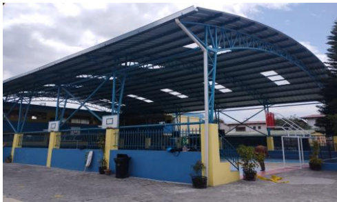
Imagen 20: I.E. Carmen Amelia Hidalgo

SUSCRITO CON: GOBIERNO AUTÓNOMO DESCENTRALIZADO DE CUMBAYÁ ADMINISTRADOR DEL CONVENIO: DIRECTORA DISTRITAL DE EDUCACIÓN 17D09 INSTITUCIONES BENEFICIADAS: CARMEN AMELIA HIDALGO TRABAJOS REALIZADOS: TRABAJOS Y MONTO EJECUTADO 2023: CUBIERTA DEL PATIO CENTRAL $ 60.000,00