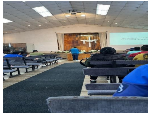
Imagen 40: Elaboración PGR