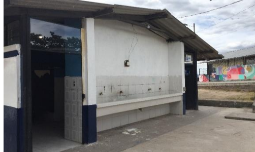
Imagen 28: Mantenimiento de batería sanitaria