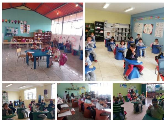
Imagen 34: Entrega y consumo de Alimentación Escolar

Se realizó la entrega de alimentación escolar en cada una de las instituciones educativas conforme a la planificación y directrices que remite Planta Central.