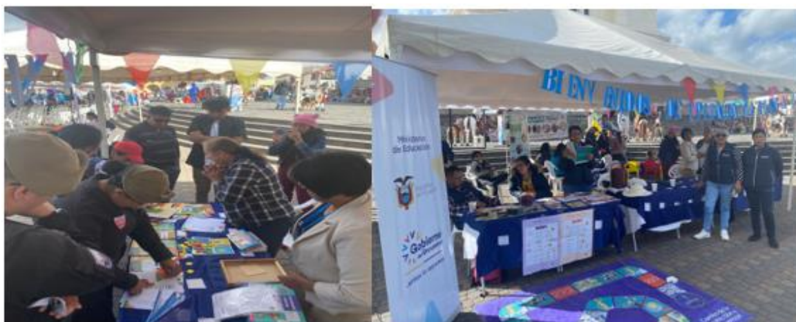
Imagen 47: Campaña Ecuador crece sin desnutrición infantil