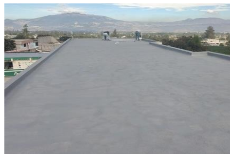
Imagen 15: Impermeabilización de losas

Así también contamos con los siguientes convenios suscritos por la Subsecretaria de Educación del Distrito Metropolitano de Quito, en beneficio del Distrito 17D09: