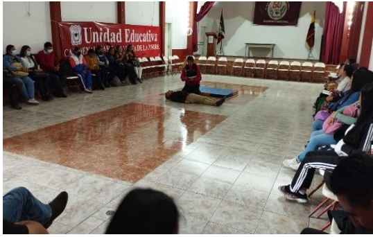
Imagen 35: Capacitación en primeros auxilios