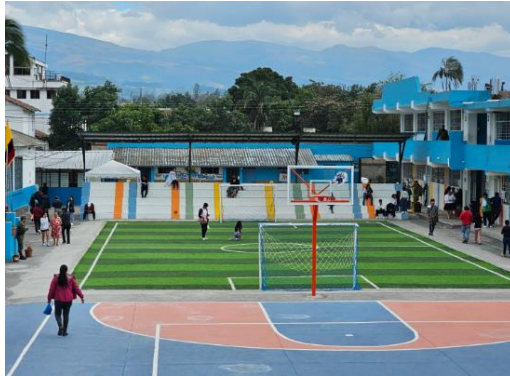
Imagen 25:: I.E. Joaquín Sánchez de Orellana