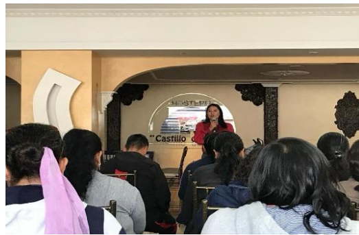
Imagen 43: Socialización Chatarrización y conformación de ternas