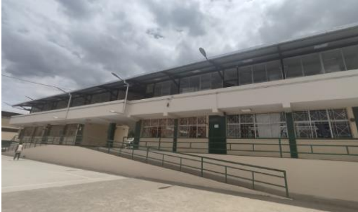
Imagen 10: Acondicionamiento de áreas educativas