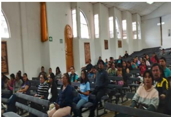
Imagen 39: Colmena

Capacitación sobre el sistema COLMENA y elaboración PGR instituciones fiscales Particulares Municipales y Fiscomisionales.