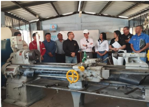
ión de Torno