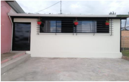
Imagen 31: I.E. Rosa Maria Lopez Vaca