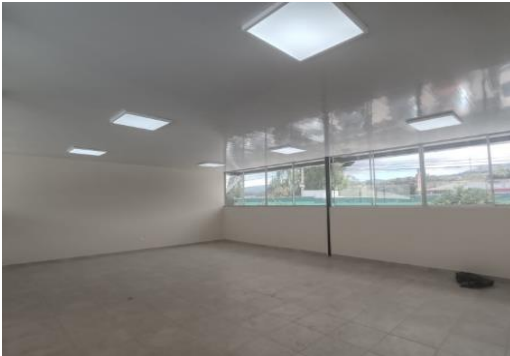
Imagen 12: Mantenimiento eléctrico