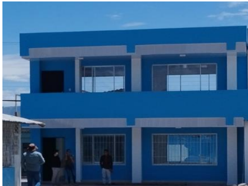
Imagen 6: Institución Educativa Joaquín Sánchez de Orellana