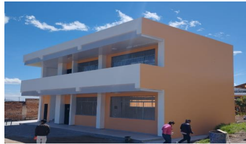
Imagen 5: Institución Educativa José Rafael Bustamante