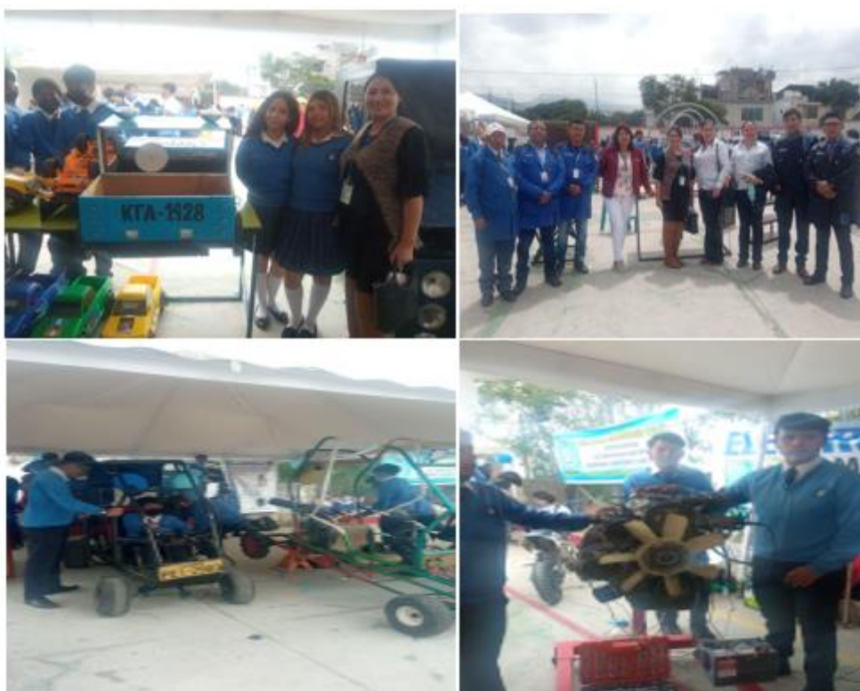
Imagen 48: Inauguración el campeonato interno de deporte estudiantil.