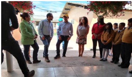
Imagen 24: Institución Educativa 27 de febrero