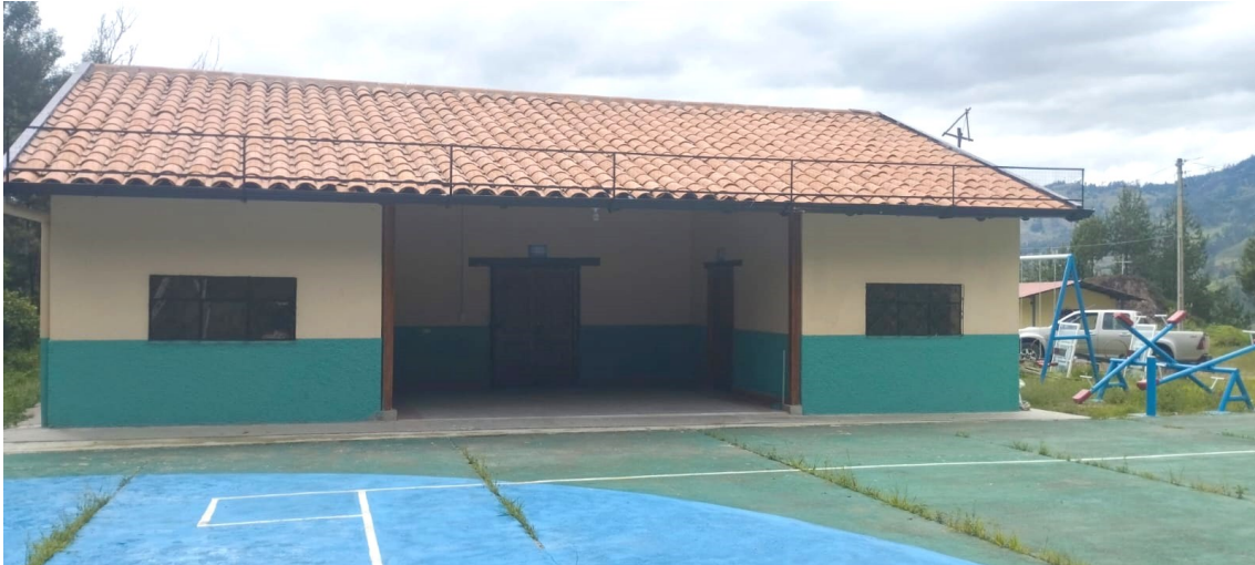
Ilustración 6 Escuela culminada para la reapertura de la Egb. Manuel Benigno Cabrera

Fuente: Unidad Distrital de Administración Escolar. Año 2023 Elaborado: Dirección Distrital 11D08 Saraguro Educación