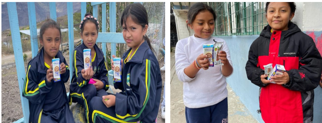
Ilustración 8. Directora Distrital entregando alimentación escolar a los niños: