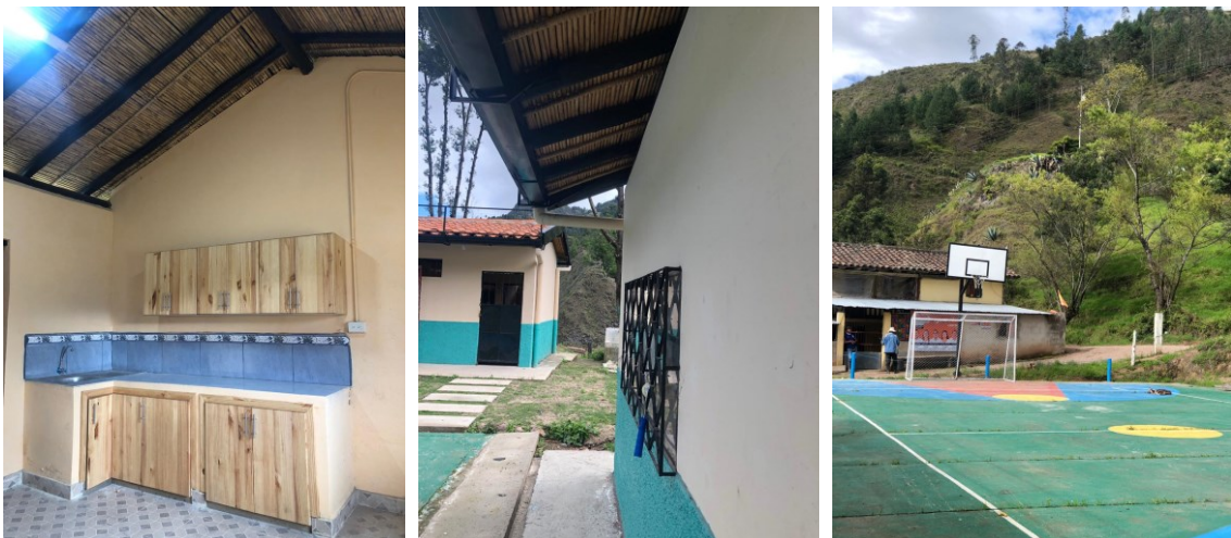
Ilustración 7 Escuela culminada para la reapertura de la Egb. Manuel Benigno Cabrera