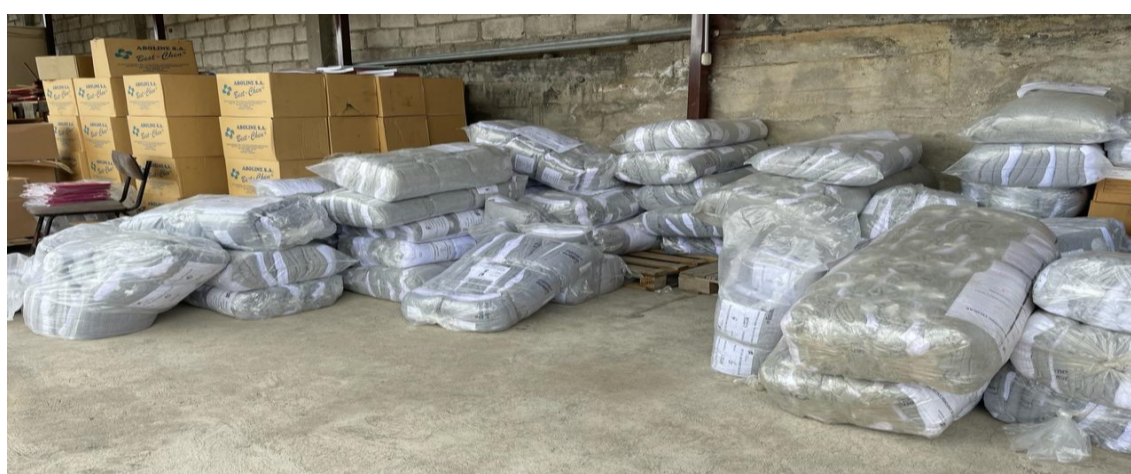
Ilustración 14 Recepción de Uniformes.