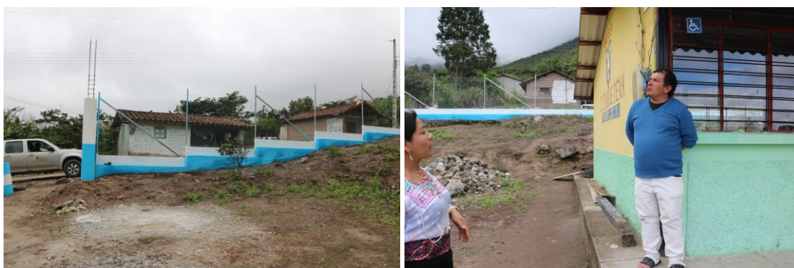
Ilustración 13 EEB. Ciudad de Tena - atendida mediante convenio

Elaborado: Dirección Distrital 11D08 Saraguro Educación