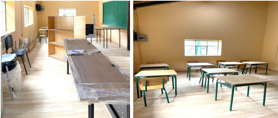
Ilustración 16 Entrega de Mobiliario. Año 2023