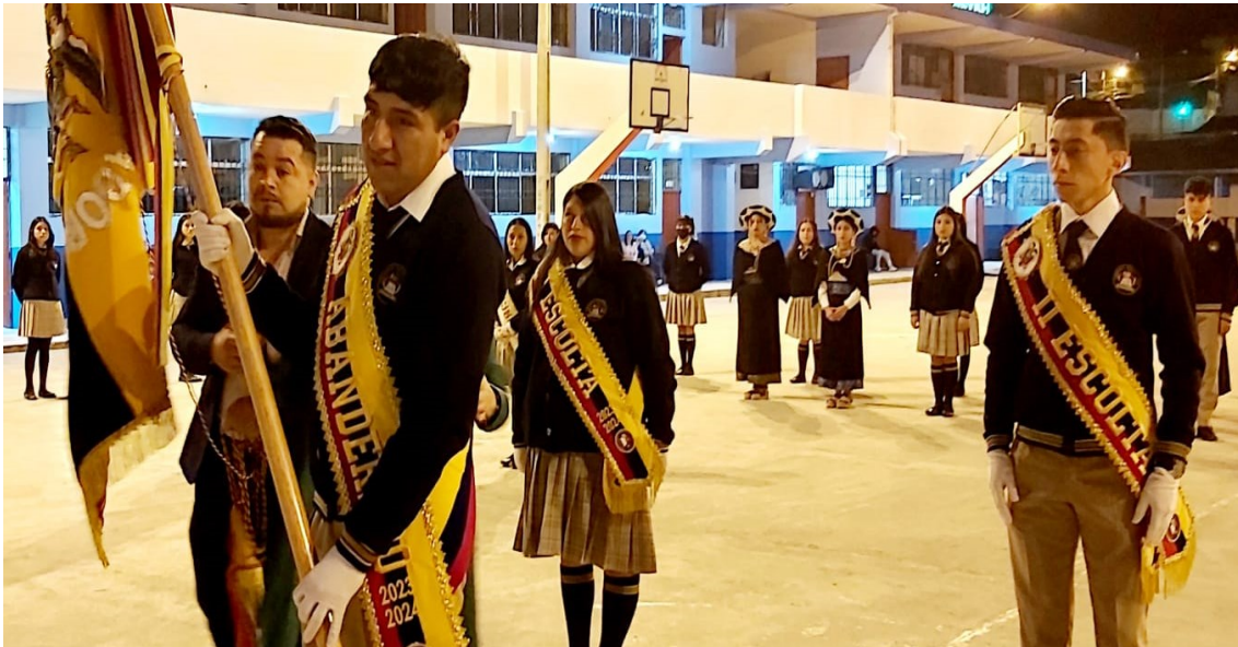
Ilustración 4 Bachilleres con NEE