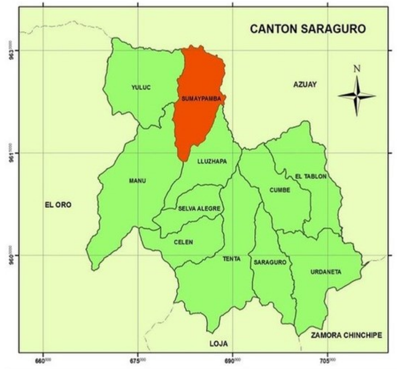
Ilustración 1: Mapa nivel desconcentrado 11D08