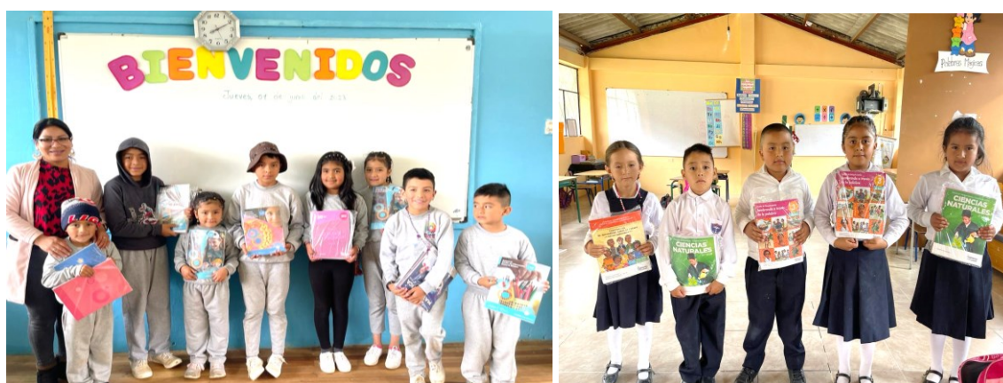
Ilustración 15 Directora Distrital entregando textos escolares a los niños: