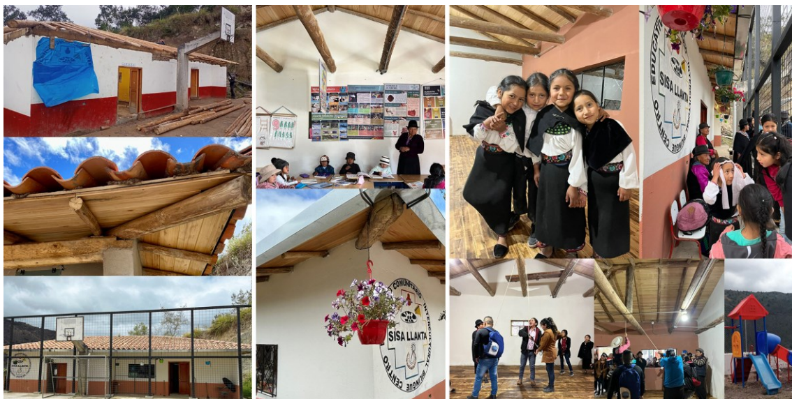
Ilustración 9: Mantenimiento- CECIB de Educación Básica Sisa Llakta

Elaborado: Dirección Distrital 11D08 Saraguro Educación.