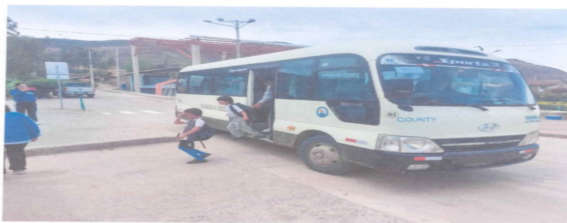
Ilustración 17 Estudiantes beneficiados de Transporte Escolar