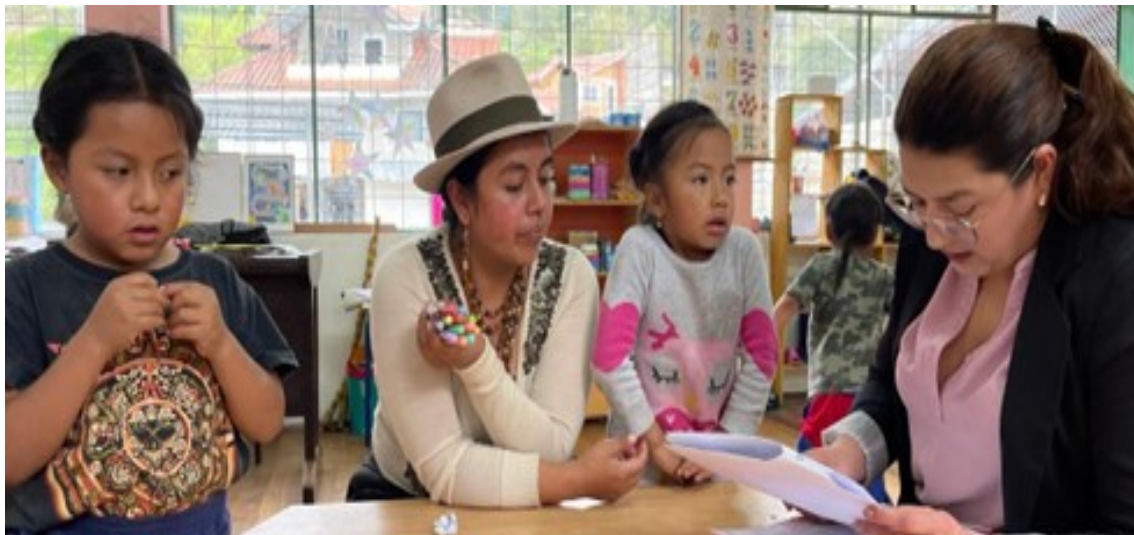
Ilustración 3 Docente de UDAI , atendiendo a Estudiantes con NEE.

Elaborado: Dirección Distrital 11D08 Saraguro Educación