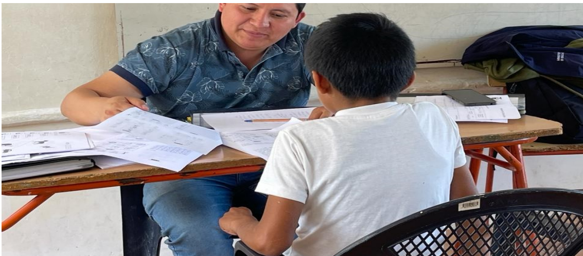
Ilustración 5. Atención de estudiantes con necesidades especiales

Para la atención de estudiantes con necesidades especiales asociadas a una discapacidad, en instituciones de educación ordinaria se cuenta con un docente de Apoyo a la Inclusión que realiza la detección, sensibilización, intervención y seguimiento a 50 estudiantes con NEE asociadas o no a una discapacidad, de los regímenes de Sierra y Costa del Distrito 11D08.