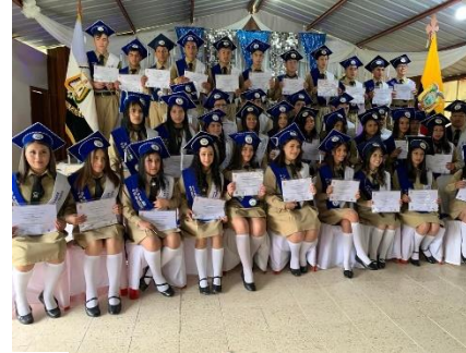
Ilustración 4. Bachilleres Oferta Ordinaria 2023