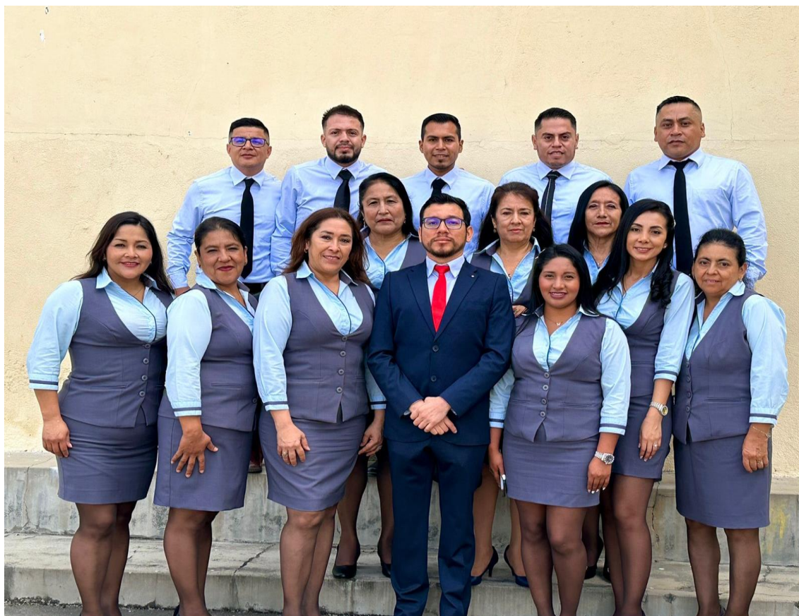
Ilustración 2. Talento Humano