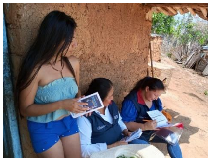
Ilustración 5. Programa todos al Aula 2023

El eje de búsqueda territorial en nuestra jurisdicción de Macará- Sozoranga se realizó con el levantamiento de información referente a: la identificación y focalización de potenciales estudiantes que se encuentran fuera del sistema educativo, mediante la conformación de Acciones complementarias de nuestro equipo de analistas ASRE, SAFPI, PROMOTOR DE APRENDER A TIEMPO, DECES INSTITUCIONALES, UDAI, DOCENTES FAPT en Instituciones Educativas y campaña de puerta a puerta en la zona específicamente rural de los 2 cantones.