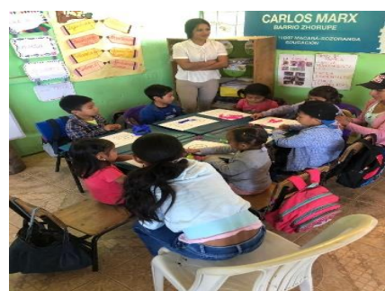
Ilustración 6. Programa SAFPI