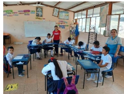
Ilustración 7. Proyecto Aprender a Tiempo

El Ministerio de Educación a través de la Subsecretaría de Educación Especializada e Inclusiva y de la Dirección Nacional de Educación Inicial y Básica, implementa el Plan Nacional Aprender a Tiempo como una medida de acción afirmativa orientada a la nivelación y recuperación de aprendizajes, desde el mes de Agosto del 2023, en nuestro Distrito 11D07 Macará Sozoranga Educación, cuenta con un Promotor Educativo.