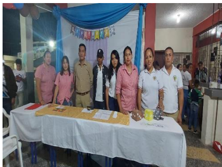
Ilustración 8. Alumnos oferta Extraordinaria

Alumnos de Oferta Extraordinaria EBJA y Bachillerato Intensivo