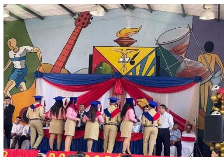
Ilustración 9. Bachilleres Oferta Extraordinaria

El año 2023 se titularon un total de 28 bachilleres de los cuales todos pertenecen al sistema fiscal oferta extraordinaria.