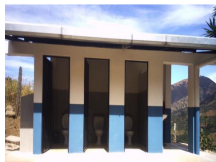
Ilustración 10. Instituciones Educativas con Mantenimiento

Durante el año 2023 se realizaron varios mantenimientos correctivos en 3 instituciones educativas una perteneciente al cantón Macara y dos pertenecientes al cantón Sozoranga, con los recursos asignados se realizaron 2 procesos bajo la modalidad de Menor cuantía mediante el Portal de Compras Públicas con el siguiente detalle: