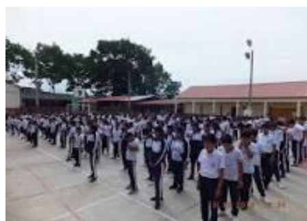
Ilustración 3. Alumnos Oferta Ordinaria