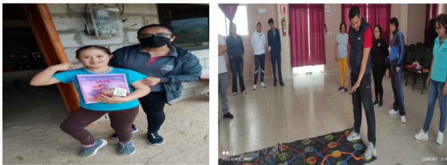
Ilustración 3. Unidad de Apoyo a la Inclusión- UDAI