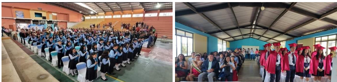
Ilustración 2. Incorporación de bachilleres año 2023

El año 2023 se titularon un total de 710 bachilleres de los cuales: 565 estudiantes corresponden al sistema fiscal oferta ordinaria, 47 oferta extraordinaria y 98 son de sostenimiento fiscomisional.