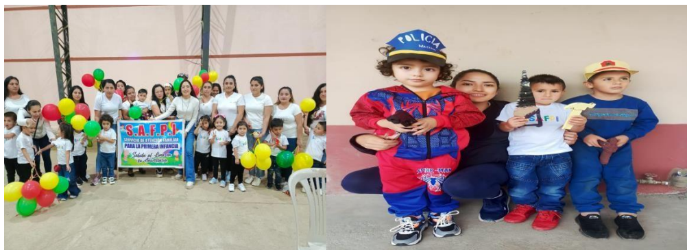
Ilustración 5. Programa de servicio de atención familiar para la primera infancia 2023-2024

En este contexto, con la finalidad de brindar el servicio en parroquias priorizadas de nuestra jurisdicción donde actualmente no existe el servicio educativo de Educación Inicial, se asignaron 6 docentes a la Dirección Distrital 11D04 Celica Pindal Puyango-Educación a laborar como responsables del proceso SAFPI. Se realizó la focalización de los niños y niñas para luego dar acompañamiento a las familias detectadas con niños de las edades 3 y 4 años en las parroquias El Limo, Ciano-El Arenal pertenecientes al cantón de Puyango, en el catón Celica en la parroquia de Cruzpamba y en el cantón Pindal en la parroquia Milagros, con un número máximo de 25 estudiantes por docente en cada parroquia, acorde a la los lineamientos y con una