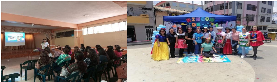
Ilustración 6. Educación Inicial 2023-2024

La Dirección Distrital 11D04 Celica Pindal Puyango - Educación, a través de gestión en el campo de oferta Inicial y Preparatoria reactivó las Redes de Aprendizaje en los niveles de Inicial 1 e Inicial 2 y Nivel de Preparatoria, logrando constituir en la jurisdicción de los 13 Circuitos Educativos que conforman los tres cantones Celica, Pindal y Puyango, 9 REDES DE APRENDIZAJE .