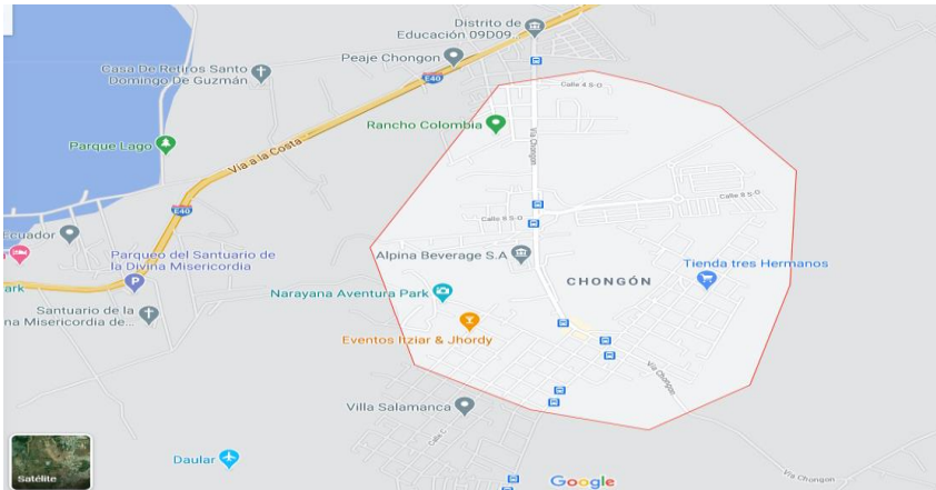
Ilustración 1 UBICACIÓN DISTRITO 09D09 CHONGÓN

Cobertura geográfica del distrito: x-2.21736 y-80.081148