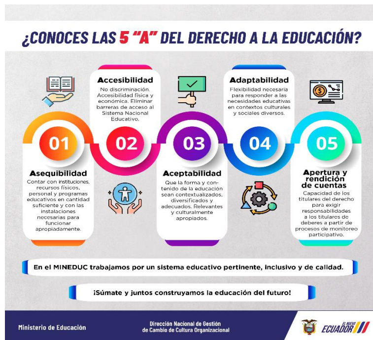
Figura N° 3 Las 5 “A” de educación

La gestión del Ministerio de Educación a través de la Dirección Distrital 04D02 Montúfar – Bolívar – Educación durante los primeros 100 días orienta su gestión tomando como referencia las 5 “A” del derecho a la educación, mismas que se presentan a continuación: