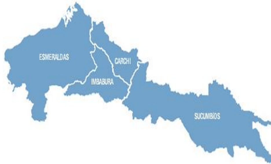
Figura N° 1 Mapa de la zona 1