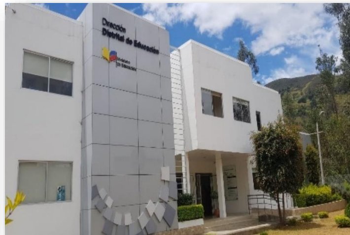
Oficinas Distrito 01D08 Educación

La Dirección Distrital 01D08 Sígsig – Educación cuenta con infraestructura propia, un inmueble ubicado en las calles Luis Rodríguez y Av. Kennedy, construido en base a los estándares emitidos por planificación del Ministerio de Educación, para el óptimo funcionamiento de las oficinas administrativas y sobre todo para una atención adecuada a la ciudadanía.