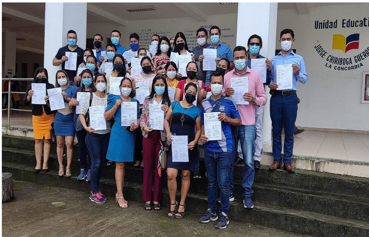
ILUSTRACIÓN 1 ENTREGA DE NOMBRAMIENTOS A GANADORES DE CONCURSO