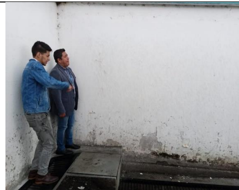
Fotografía 10: Canales y cajas de revisión en U.E. 15 de Diciembre