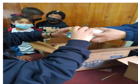
Fotografía 20: Entrega de raciones de Alimentación Escolar a estudiantes.