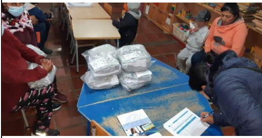
Fotografía 17: Entrega de Uniformes Escolares.