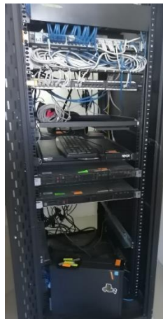
Fotografía 27: Mantenimiento Tecnológico