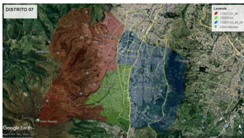
Ilustración 1: Mapa Geográfico