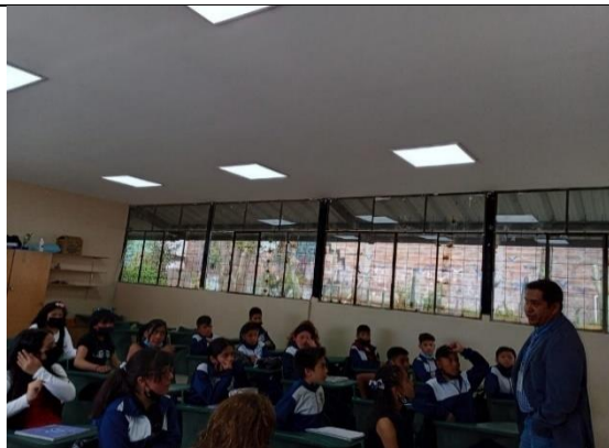
Fotografía 13: Cielo raso e iluminarias en aulas de I.E. Galo Vela Álvarez