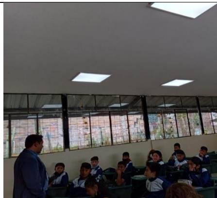
Fotografía 14: Cielo raso e iluminarias en aulas de I.E. Galo Vela Álvarez