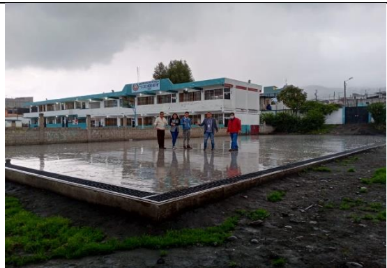
Fotografía 9: Cancha construida en U.E. 15 de Diciembre