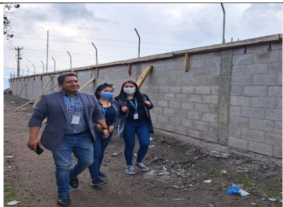
Fotografía 11: Muro superior en E.E.B. Carlos Guerra Boda