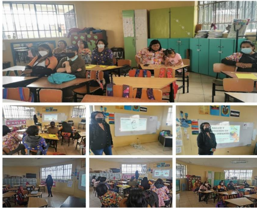
Ilustración 2: Redes de Aprendizaje-2022