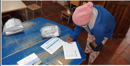
Fotografía 18: Entrega de Uniformes Escolares.