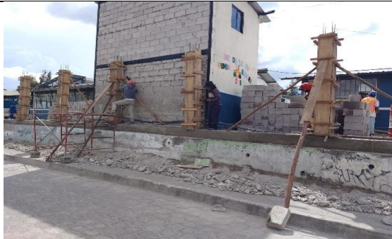
Fotografía 7: Fundición de columnas en E.E.B. Valencia Herrera