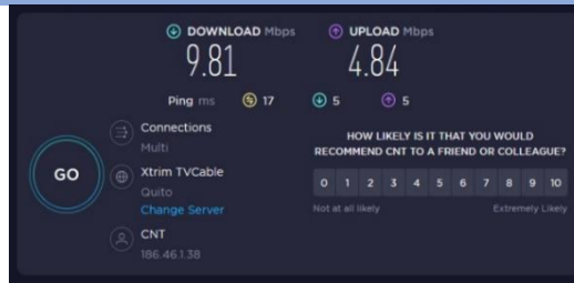
Fotografía 24: Revisión del Programa Informático