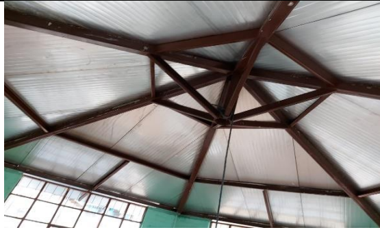
Fotografía 5: Cambio de techo de E.E.B. Enma Vaca Rojas