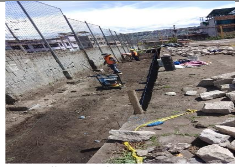
Fotografía 8: Encofrado de muro en E.E.B. Valencia Herrera