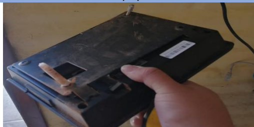
Fotografía 23: Mantenimiento Modem