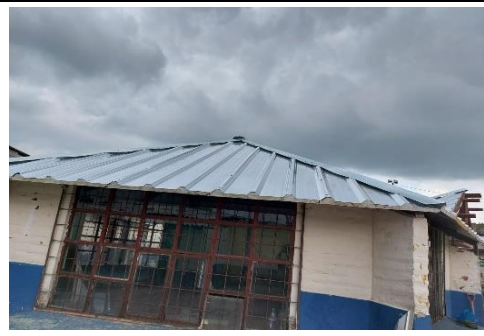
Fotografía 6: Cambio de techo de E.E.B. Enma Vaca Rojas