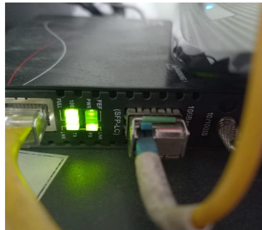
Fotografía 28: Mantenimiento Tecnológico