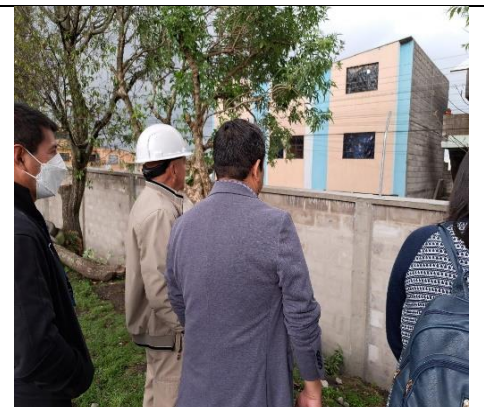
Fotografía 12: Muro inferior en E.E.B. Carlos Guerra Boda