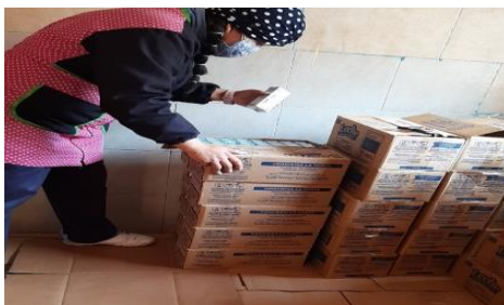
Fotografía 19: Registro previo a entrega de raciones de Alimentación Escolar.