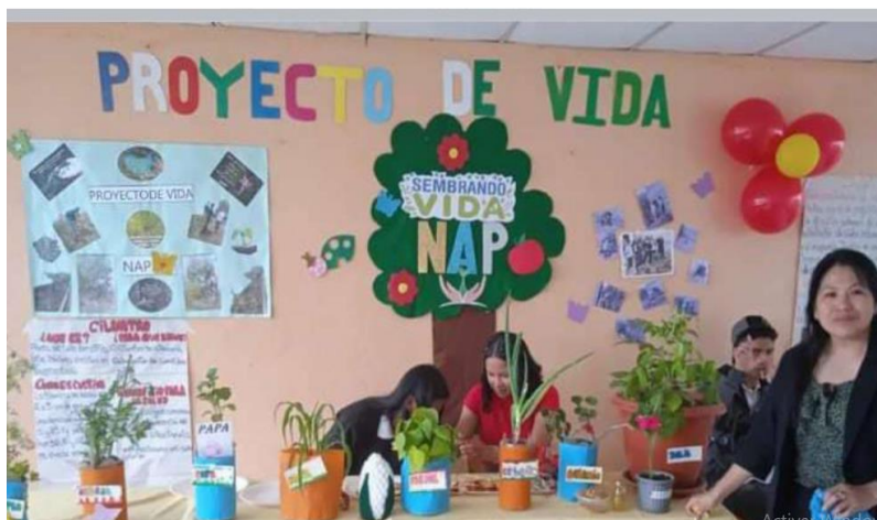
Ilustración 2: Trabajo con estudiantes “PROYECTO NAP”.