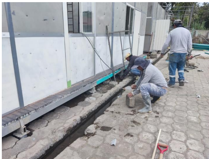
Ilustración 13: Mantenimiento de las Instituciones Educativas.