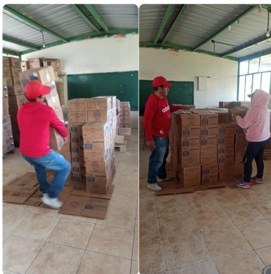
Ilustración 8: Entrega de Alimentación Escolar.

La 21 orden de compra 04 orden de entrega, se inicia la entrega del 7 de noviembre al 2 de diciembre del 2022 para 26 días de consumo. Y la 21 orden de compra 03 orden de entrega se inicia del 20 de diciembre al 12 enero de 2023.