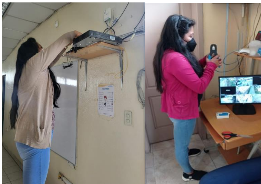
Ilustración 15: Apoyo en la continuidad de proyectos tecnológicos