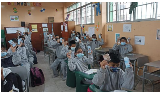
Ilustración 9. Distribución de Alimentación Escolar.