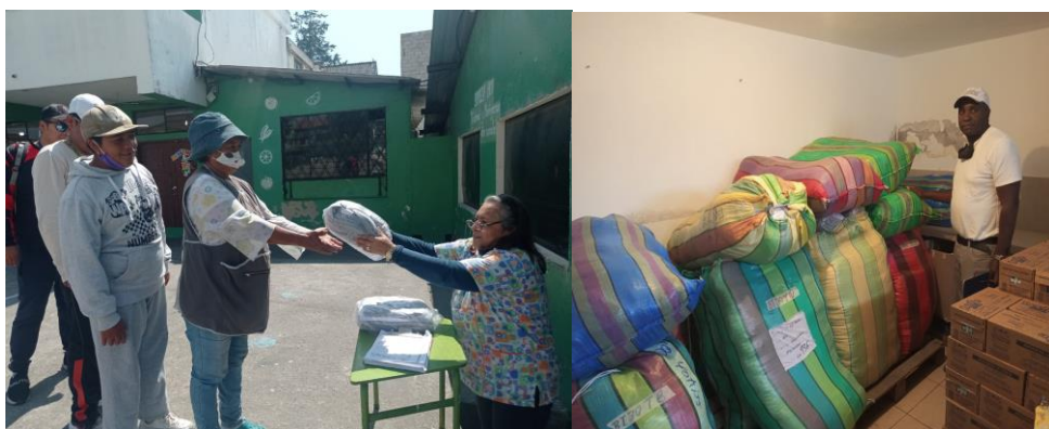
Ilustración 12. Distribución de Uniformes Escolares. FUENTE: DIVISIÓN DISTRITAL DE ADMINISTRACIÓN ESCOLAR.

FUENTE: DIVISIÓN DISTRITAL DE ADMINISTRACIÓN ESCOLAR.