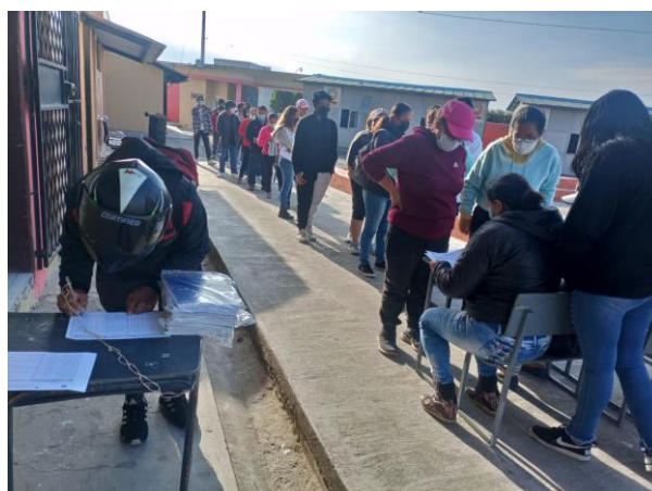
Ilustración 10. Entrega de textos a beneficiarios.