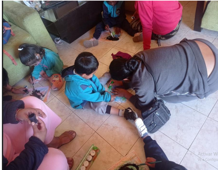
Ilustración 3: Trabajo con estudiantes "PROYECTO SAFPI".