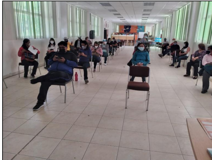
Ilustración 20: Comité de Riesgos Institucionales