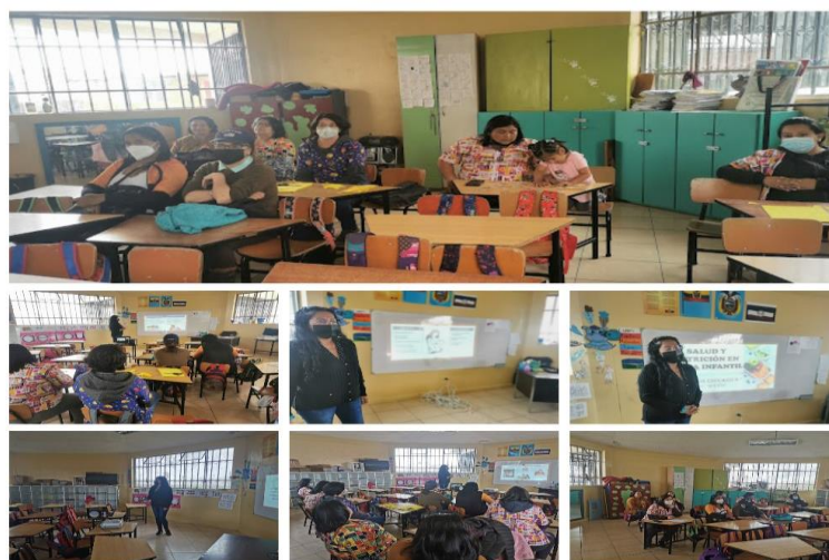
Ilustración 14: Redes de Aprendizaje