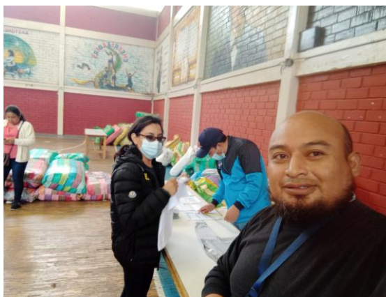
Ilustración 11. Control previo de Uniformes Escolares

En el mes octubre se realiza la recepción de uniformes escolares en el cual las direcciones distritales conjuntamente con el equipo de administración escolar realizan la verificación y control previo de las especificaciones técnicas de los uniformes escolares.