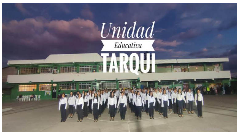
Ilustración 5: Servicios Extraordinarios personas con escolaridad inconclusa.