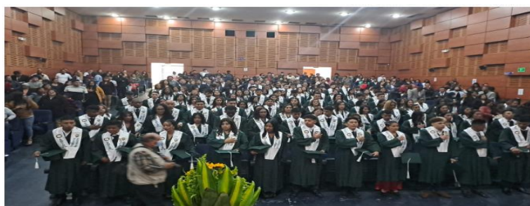
Ilustración 6: Servicios Extraordinarios personas con escolaridad inconclusa.