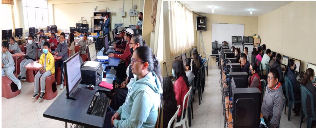
Ilustración 17: Apoyo procesos del MINEDUC