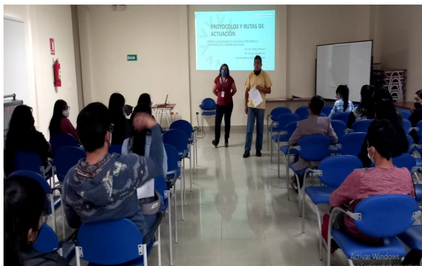
Ilustración 18: Capacitación de Violencia de genero

En el marco de los 16 Días de activismo contra la violencia de género, desde el 25 de noviembre hasta el 10 de diciembre 2022 (Día de los Derechos Humanos) se realizarán actividades en las Instituciones educativas del Distrito 17002 Calderón promoviendo la participación de niñas, niños y adolescentes, a través de espacios de diálogo, debate y reflexión garantizando entornos libres de violencia.