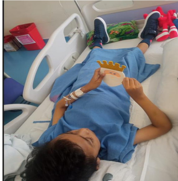
Ilustración 7: Atención educativa hospitalaria FUENTE: DIVISIÓN DISTRICTAL DE APOYO, SEGUIMIENTO Y REGULACIÓN

FUENTE: Unidad Distrital de Apoyo a la Inclusión (Matrices de atenciones mensuales 2022)