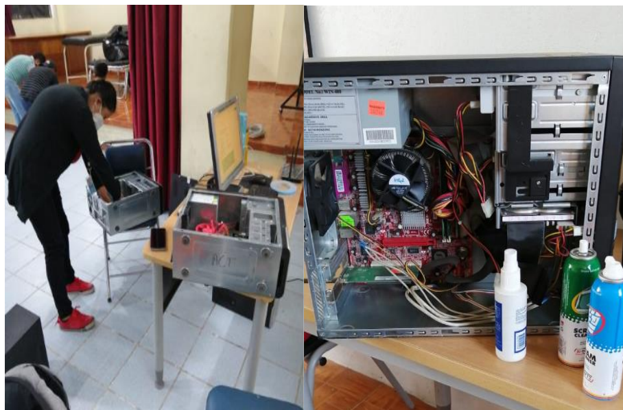
Ilustración 16: Soporte Técnico