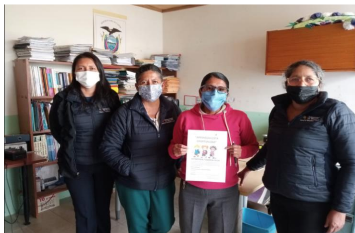
Ilustración 4: Trabajo en el Instituciones Educativas Proyecto “ TODOS AL AULA ”.