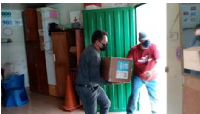
Ilustración N.- 2: Entrega de textos a Instituciones Educativas.