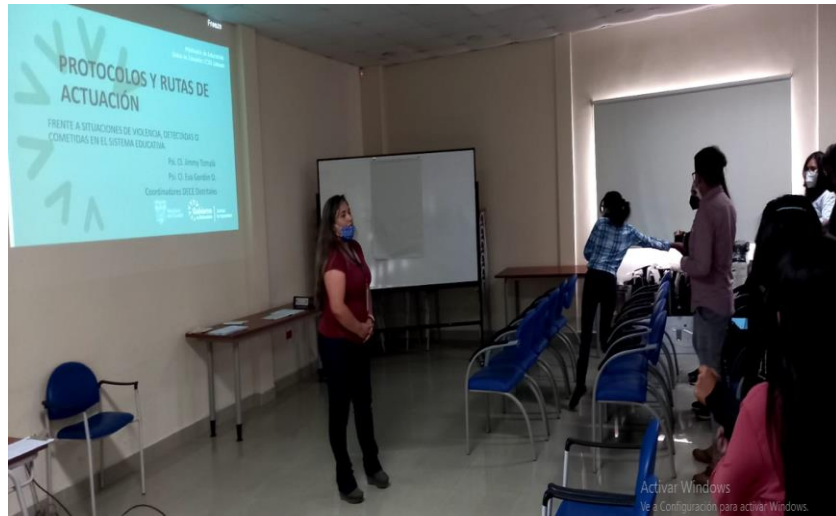
Ilustración 19: Taller Rutas y Protocolos