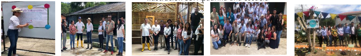
Ilustración 35: Apadrina una escuela