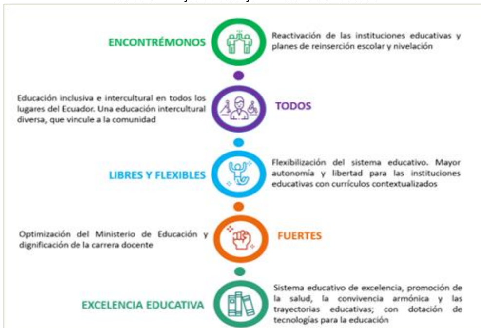
Ilustración 2: Ejes de trabajo Ministerio de Educación

En el ejercicio fiscal 2022, la planificación del Ministerio de Educación se operativizó bajo los cinco ejes de trabajo y 20 líneas de acción, mismas que se resumen a continuación: