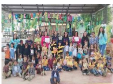
Tabla 3: Redes de Aprendizaje