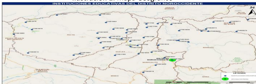
Ilustración 1: Mapa Geográfico

Fuente: Dirección de Planificación del Ministerio de Educación