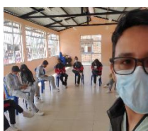
Tabla 7: Talleres desarrollados en prevención de violencia