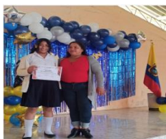
Tabla 2: Nivelación y Aceleración Pedagógica (NAP)