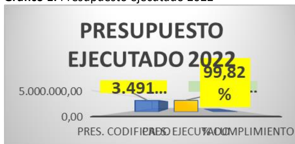
Gráfico 1: Presupuesto ejecutado 2022