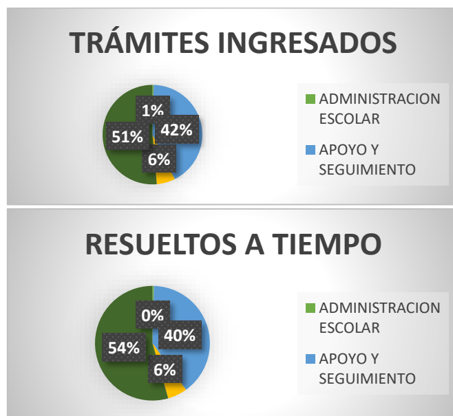
Ilustración 4. Ingreso y resolución de trámites