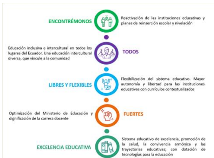
Ilustración 3. Ejes de trabajo Ministerio de Educación

En el 2022, la planificación del Ministerio de Educación se operativizó bajo los cinco ejes de trabajo y 20 líneas de acción, mismas que se resumen a continuación: