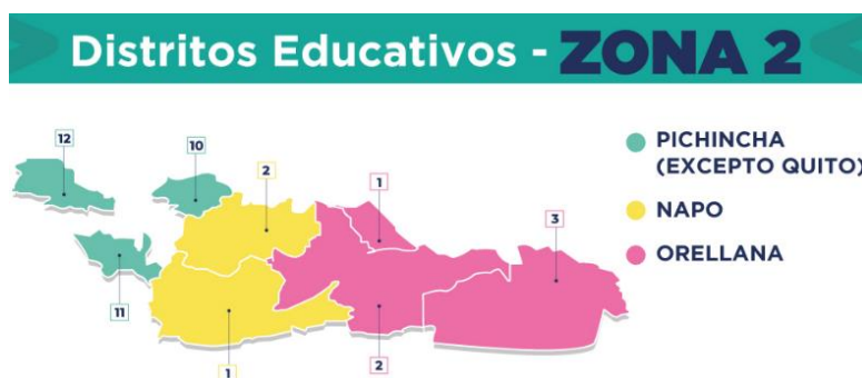
Ilustración 1. Zona 2 y sus Distritos

El Distrito 15D02 El Chaco-Quijos-Educación incluye a los cantones El Chaco y Quijos, pertenece a la Zona 2, está ubicado geográficamente en la provincia de Napo, cantón El Chaco, parroquia El Chaco.