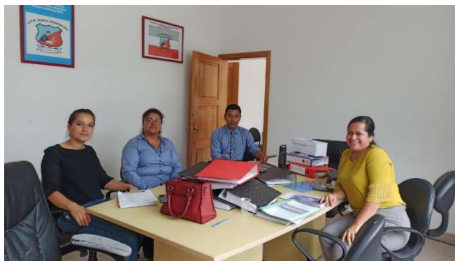
Imagen 20: Currículos contextualizados

El Currículo priorizado con énfasis en competencias es un insumo para que el docente lo transforme en experiencias de aprendizaje motivantes. Mejora la comprensión lectora y el uso de herramientas matemáticas. El énfasis curricular propuesto en este documento nace para satisfacer las necesidades de la realidad educativa actual donde es fundamental priorizar aquellas destrezas que permiten el desarrollo de competencias; a través del Departamento de Apoyo Seguimiento y Regulación se realiza asesorías a la gran mayoría de Instituciones Educativas.