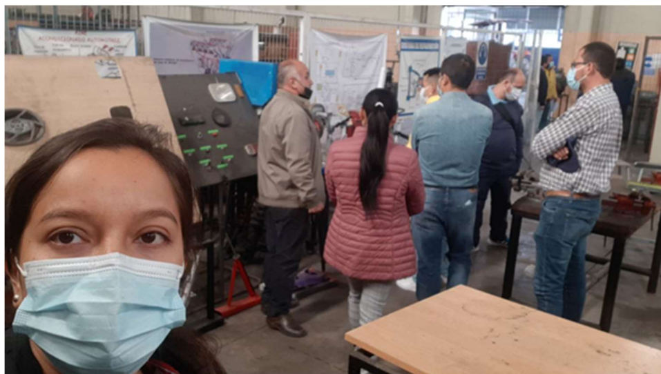
Imagen 33: Docentes técnicos del Colegio de Bachillerato Gualaquiza