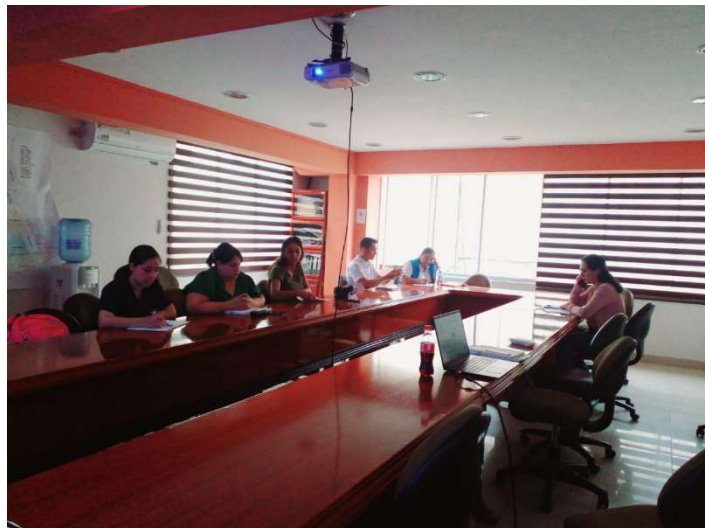
Imagen 26: Mesa intersectorial de prevención de la desnutrición crónica infantil

Se participó de las reuniones mensuales de la mesa intersectorial de prevención de la desnutrición crónica infantil.