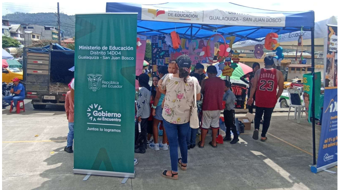
Imagen 2: Puntos de reencuentro

En coordinación con la Gobernación de Morona Santiago tuvimos la participación del departamento de DECE, UDAI y del grupo de compañeros que conforman el proyecto SAFPI quienes han sido parte de las ferias ciudadanas en los cantones de San Juan Bosco y Gualaquiza, cuyo objetivo ha sido dar a conocer los servicios y proyectos que se llevan ejecutando en territorio.