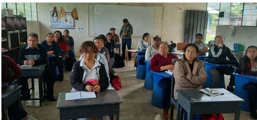
Imagen 9: Docentes de Instituciones Educativas Unidocentes y Bidocentes.