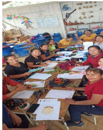
Imagen 23: Redes de Aprendizaje Bilingües

Al iniciar el año lectivo 2022- 2023, juntamente con la Coordinación Zonal se realizó una capacitación a los Docentes de Educación Inicial y subnivel de Preparatoria. Elaboración de planificaciones y Fichas de Experiencias de Aprendizaje encaminados a desarrollar las destrezas contenidas en los currículos de educación inicial y preparatoria, de acuerdo con las necesidades