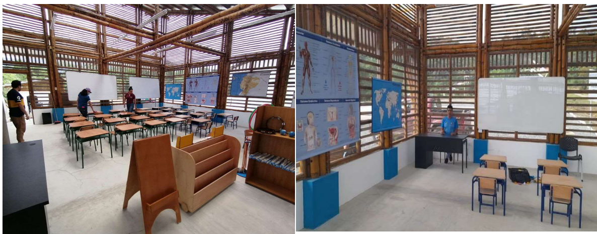
Imagen 10: equipamiento y mobiliario para las instituciones educativas bilingües