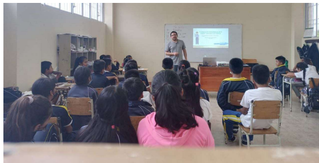
Imagen 11: Unidad de Apoyo a la Inclusión

En cuanto a asegurar el derecho a la educación de los estudiantes con discapacidad cuya condición sea moderada, severa o profunda, el Distrito de educación cuenta con la Unidad de Educación Especial Oswaldo Guayasamín, en la que se encuentran atendiendo a 46 estudiantes con diversos tipos de discapacidad (intelectual, sensorial, psicosocial, multidiscapacidad) desde los niveles de inicial hasta décimo de EGB.