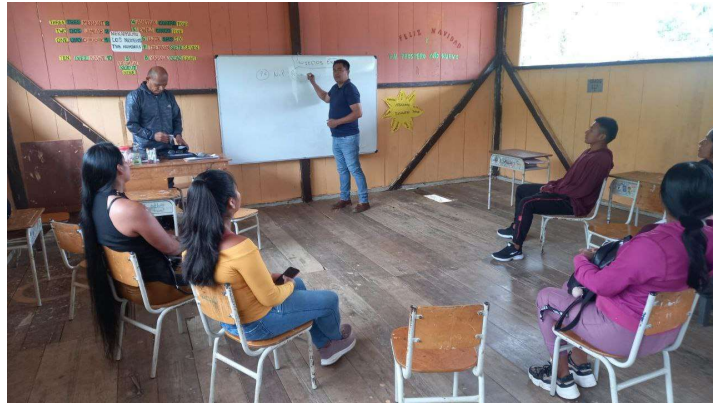
Imagen 18: Elaboración de las guías pedagógicas en base al MOSEIB y planificación de proyectos escolares