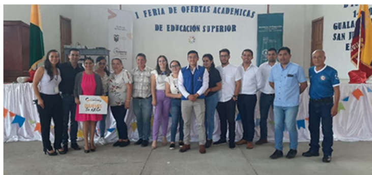
Imagen 31: Primera feria de ofertas académicas