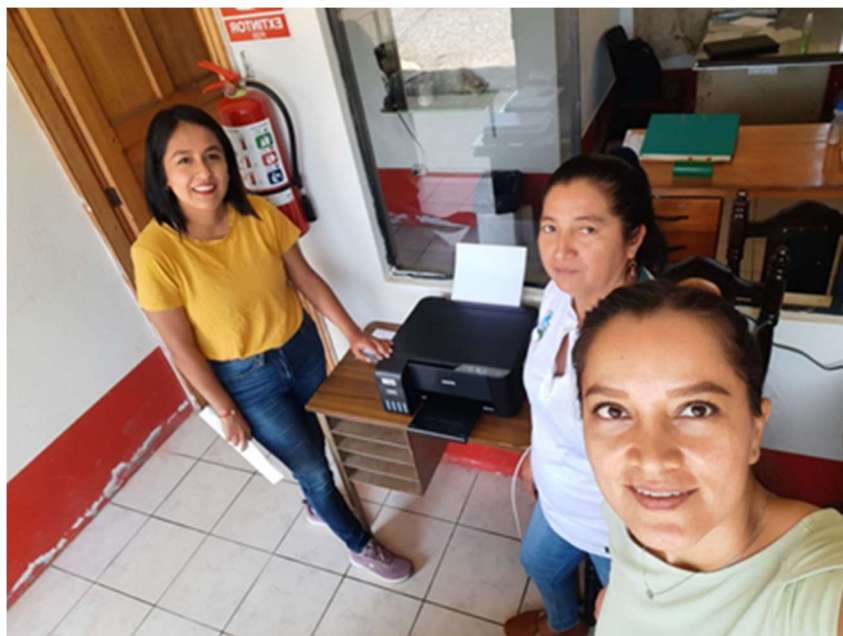
Imagen 29: Dotación de equipo de impresión

Para fortalecer el bachillerato técnico con el apoyo de la empresa privada ASFALCONS se dotó de equipo de impresión a la Unidad Educativa Nueva Tarqui; se benefician 21 docentes y 266 estudiantes.