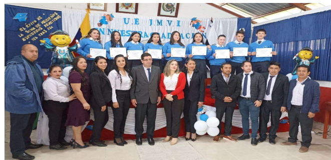
Imagen 3: Incorporación de Bachilleres