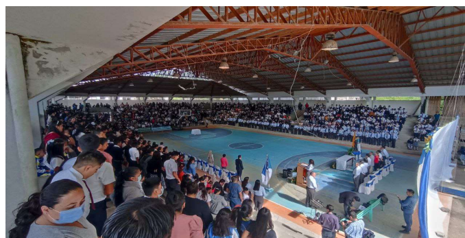
Imagen 4: Inauguración Inicio Año Lectivo