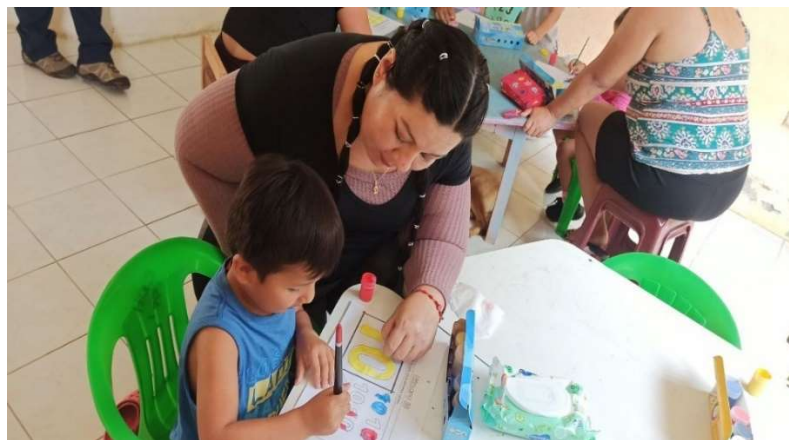
Imagen 6: Atención Familiar en la Primera Infancia (SAFPI)

Se continúa fortaleciendo la educación Inicial Servicio de Atención Familiar en la Primera Infancia (SAFPI) , esta oferta atiende a niños y niñas de 3 a 5 años de edad, quienes no cuentan con recursos económicos ni transporte para asistir a una educación regular, debido a la distancia excesiva que se encuentran sus residencias, en el año 2022 se atendió a 225 niños y niñas de los cantones San Juan Bosco y Gualaquiza. Desde el mes de septiembre de 2022 se reactiva nuevamente con el programa y con la contratación de seis docentes más conforme lineamientos del MINEDUC, dando un total de 9 docentes distribuidos en determinados sectores correspondientes a los cantones de Gualaquiza y San Juan Bosco.