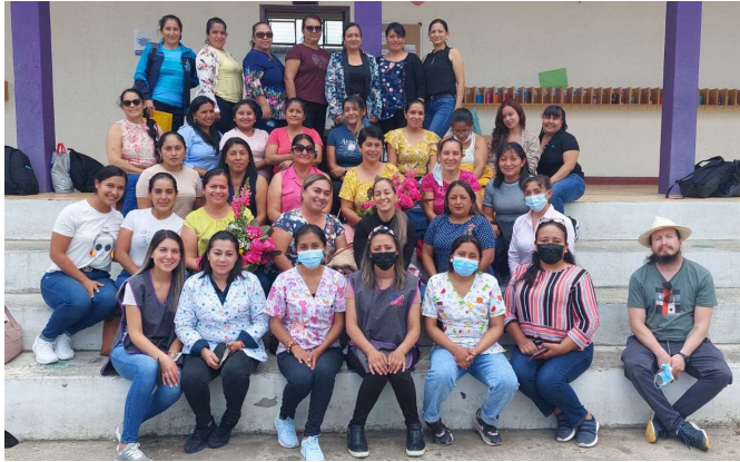
Imagen 22: Redes de Aprendizaje Hispánicas

durante el año lectivo 2022 – 2023 se estructuraron 3 Redes de Aprendizaje: “Mentes Ingeniosas”, “Educando con Amor” y “Nantu”, con la participación de 72 docentes de diferentes Instituciones Educativas.