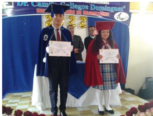
Imagen 21: Unidad Educativa Sultana del Oriente y Unidad Educativa Dr. Camilo Gallegos Domínguez

Mediante la Unidad Educativa Sultana del Oriente y Unidad Educativa Dr. Camilo Gallegos Domínguez contribuimos en la formación integral y preparación de los estudiantes de los servicios educativos extraordinarios, quienes, por diversas razones, no pueden asistir a una institución ordinaria y deben recibir educación adaptada a su edad y necesidades, de manera que puedan desarrollar al máximo su potencial y participar plenamente en la sociedad.