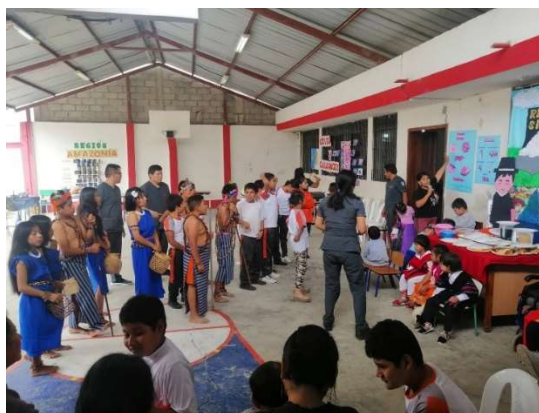
Imagen 12: Estudiantes de la IE. Especial Oswaldo Guayasamín

En cuanto a asegurar el derecho a la educación de los estudiantes con discapacidad cuya condición sea moderada, severa o profunda, el Distrito de educación cuenta con la Unidad de Educación Especial Oswaldo Guayasamín, en la que se encuentran atendiendo a 46 estudiantes con diversos tipos de discapacidad (intelectual, sensorial, psicosocial, multidiscapacidad) desde los niveles de inicial hasta décimo de EGB.