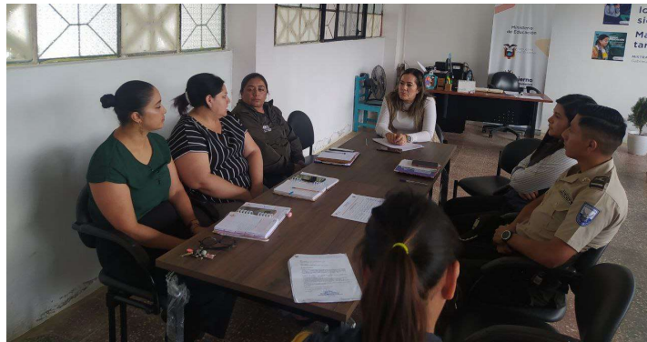
Imagen 25: Submesa de alcohol, tabaco y droga

En coordinación con la Gobernación de Morona Santiago, se instaló la Submesa de alcohol, tabaco y droga que tiene por finalidad articular acciones de control de expendio de sustancias sujetas y no a legislación en el cantón Gualaquiza, concientizando a los estudiantes.