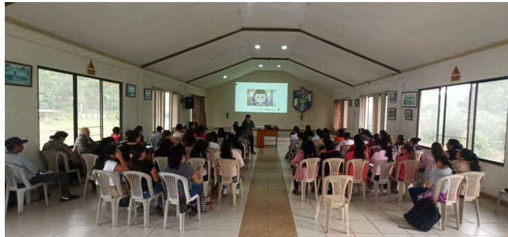
Imagen 24: Capacitación a los Docentes de Educación Inicial y subnivel de Preparatoria

e intereses de los niños y niñas, las cuales están comprendidas en actividades y sugerencias para que los padres, madres de familia o adultos que acompañen en el proceso formativo de sus representados.