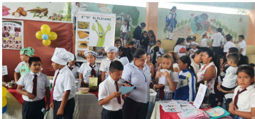
Imagen 19: Instituciones Educativas Fiscomisionales y particulares

Las Niñas, Niños y adolescentes, de las Instituciones Educativas Fiscomisionales y particulares, conforme los lineamientos emitidos por el MINEDUC, utiliza los textos escolares y herramientas digitales para transmitir el conocimiento al estudiantado, logrando enfrentar un nuevo reto estudiantil, con habilidades lúdicas y tecnológicas.