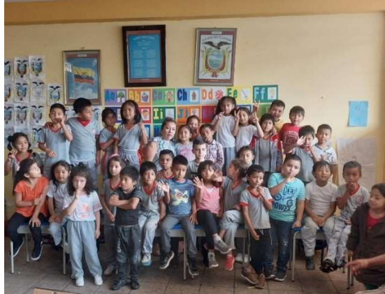
Imagen 5: Programa de Promotores Pedagógicos

Con los cuatro docentes del Programa de Promotores Pedagógicos se atiende a un total de 116 estudiantes, ubicados en las diferentes instituciones educativas.