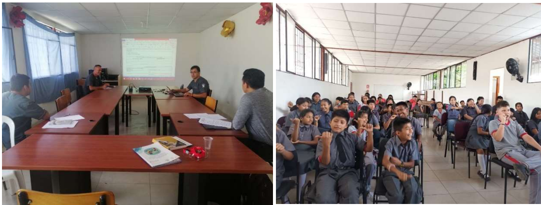
Imagen 13: Educación Inclusiva

Dentro de este ámbito se ha trabajado a través de talleres de sensibilización de las discapacidades, inclusión educativa, estrategias metodológicas para estudiantes con NEE, adaptaciones curriculares dirigido a docentes de las diferentes instituciones a saber: