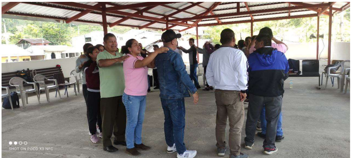
Imagen 27: Actividades DECE