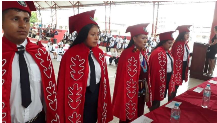
Imagen 7: Graduación EBA

De la misma forma la educación para jóvenes y adultos mediante el proyecto de Fortalecimiento y Acceso a la Educación y Titulación a lo Largo de la Vida , conocido anteriormente como (EBA), el mismo que tiene como objetivo principal erradicar el analfabetismo. Dentro del periodo lectivo 2021-2022 culminaron 11 estudiantes la Básica Superior y 18 estudiantes el Bachillerato; en el periodo 2022-2023 iniciaron 25 estudiantes en la Básica y 45 estudiantes en el Bachillerato, atendidos por 4 docentes.