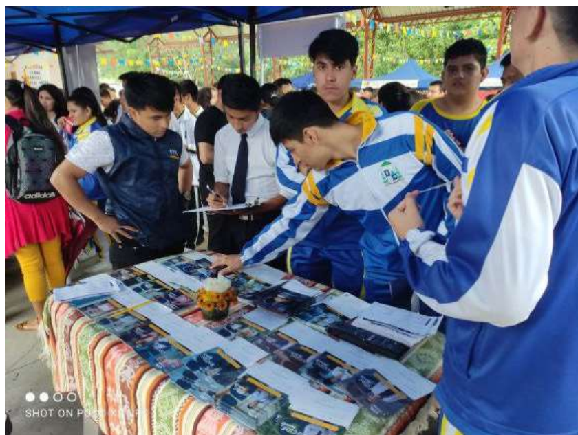
Imagen 32: Alumnos en la primera feria de ofertas académicas