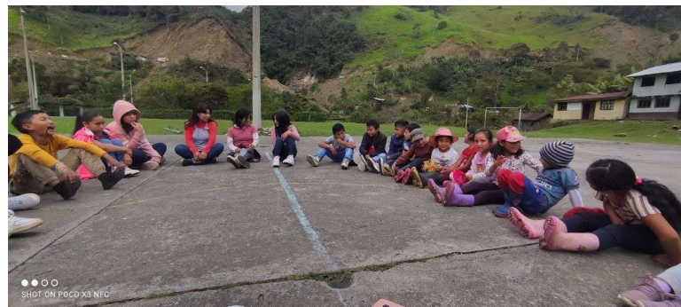
Imagen 8: DECE