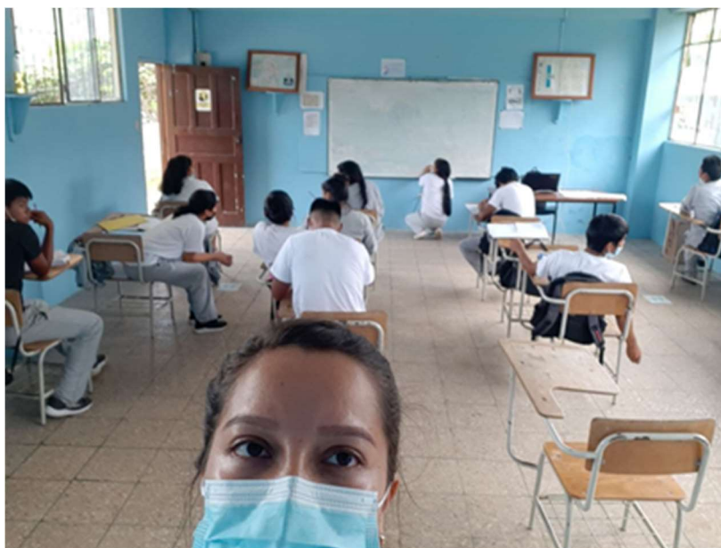
Imagen 28: Nivelación a Estudiantes

Para fortalecer el bachillerato técnico con el apoyo de la empresa privada ASFALCONS se dotó de equipo de impresión a la Unidad Educativa Nueva Tarqui; se benefician 21 docentes y 266 estudiantes.