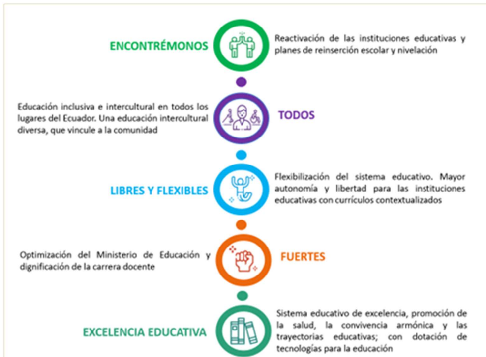
Imagen 1: Ejes de trabajo Ministerio de Educación

En el 2022, la planificación del Ministerio de Educación se operativizó bajo los cinco ejes de trabajo y 20 líneas de acción, mismas que se resumen a continuación: