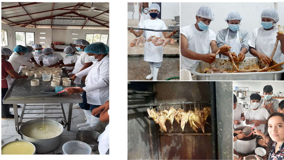
Imagen 30: Formación en Centros de Trabajo de la Unidad Educativa Nueva Tarqui