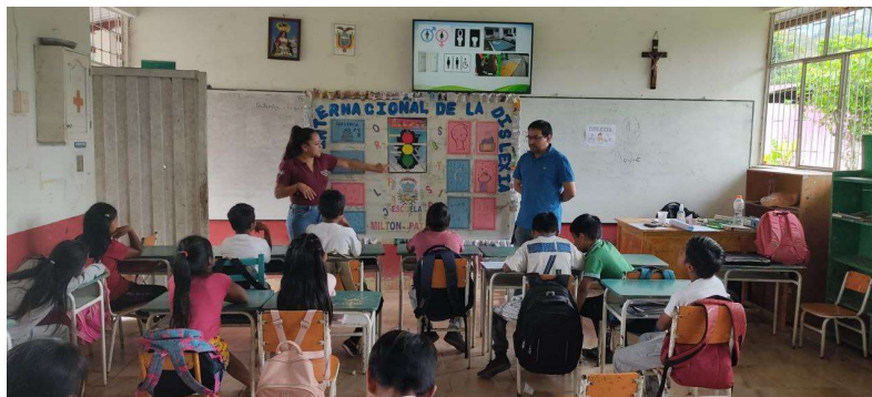
Imagen 14: adaptaciones curriculares y metodologías

En lo que respecta al Diseño Universal para el Aprendizaje (DUA) se ha trabajado a través de charlas a docentes y directivos, que tienen como objetivo el acceso universal a la educación, mediante un currículo flexible, abierto e inclusivo.