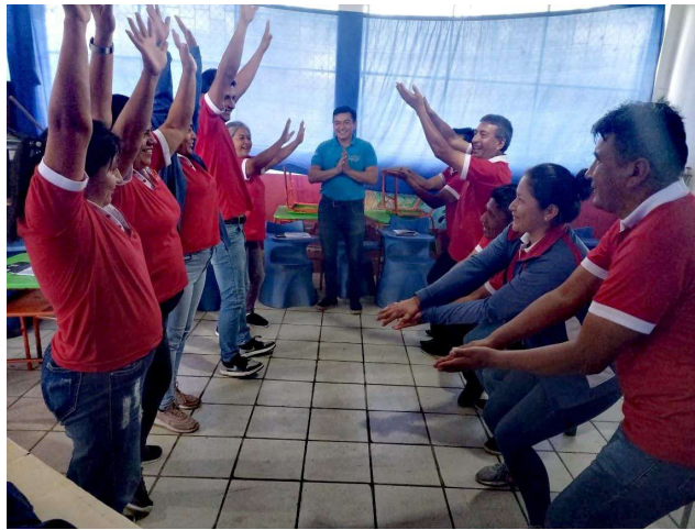
Imagen 15: charlas a docentes y directivos

Como conclusiones se puede afirmar que se ha venido trabajando en temáticas muy diversas y coordinando acciones con los diferentes representantes del cantón.