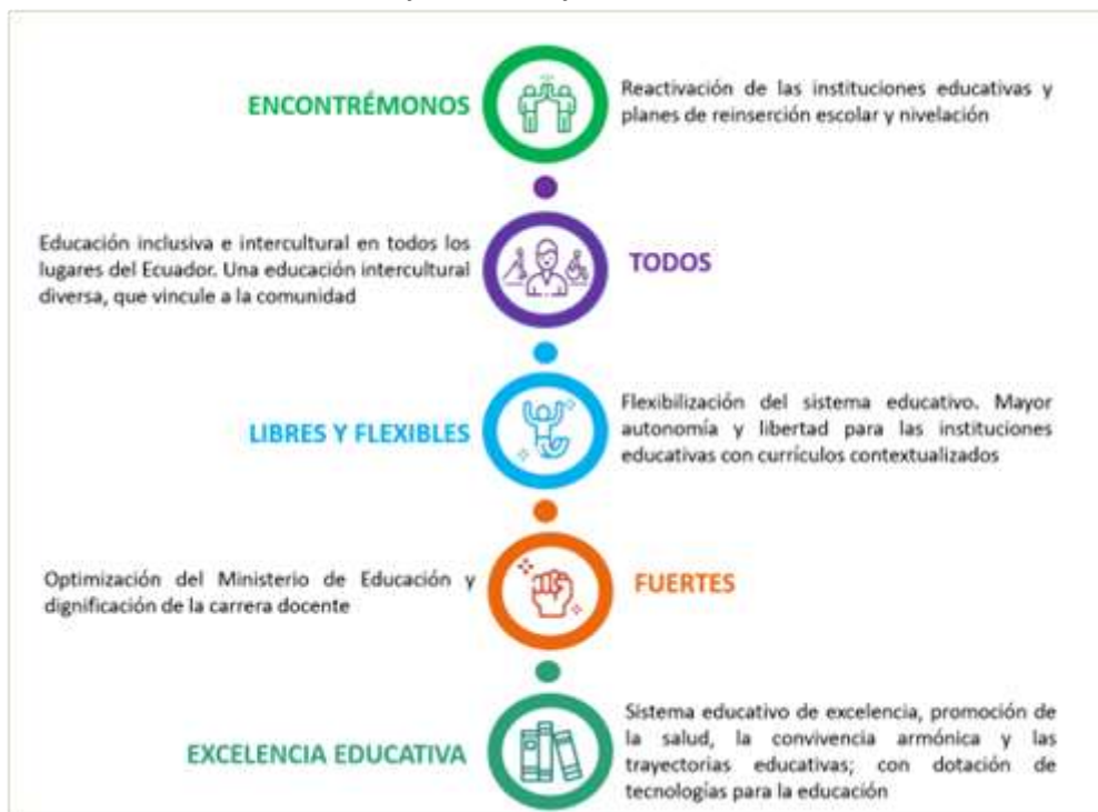
Ilustración 1: Ejes de trabajo Ministerio de Educación

En el 2022, la planificación del Ministerio de Educación se operativizó bajo los cinco ejes de trabajo y 20 líneas de acción, mismas que se resumen a continuación: