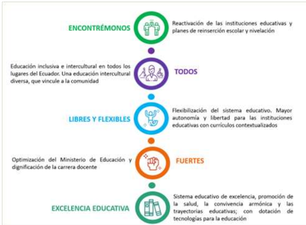
Ilustración 1: Ejes de trabajo Ministerio de Educación

En el 2022, la planificación del Ministerio de Educación se operativizó bajo los cinco ejes de trabajo y 20 líneas de acción, mismas que se resumen a continuación: