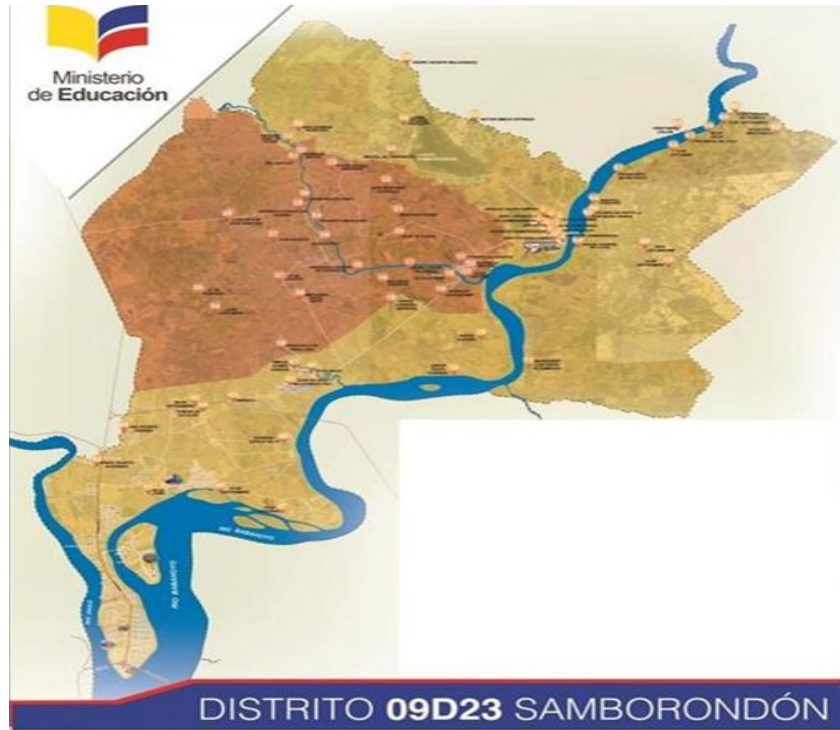
Ilustración 1: Mapa de instituciones educativas Distrito Educativo 09D23