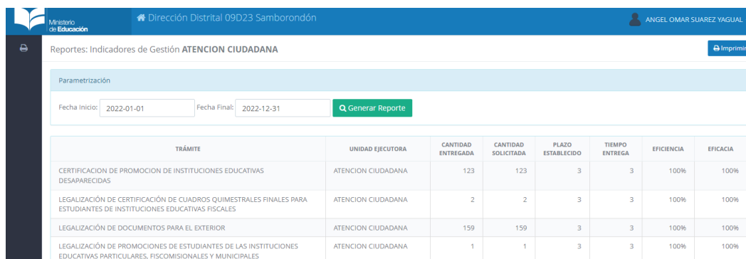
Ilustración 4: Plataforma Ministerio de Educación

Fuente: www.educacion.gob.ec Elaborado: Ministerio de Educación