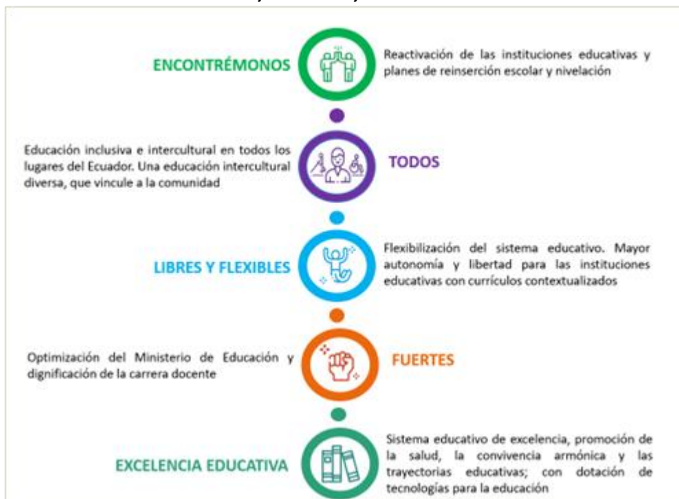
Ilustración 2: Ejes de trabajo Ministerio de Educación

En el 2022, la planificación del Ministerio de Educación se operativizó bajo los cinco ejes de trabajo y 20 líneas de acción, mismas que se resumen a continuación: