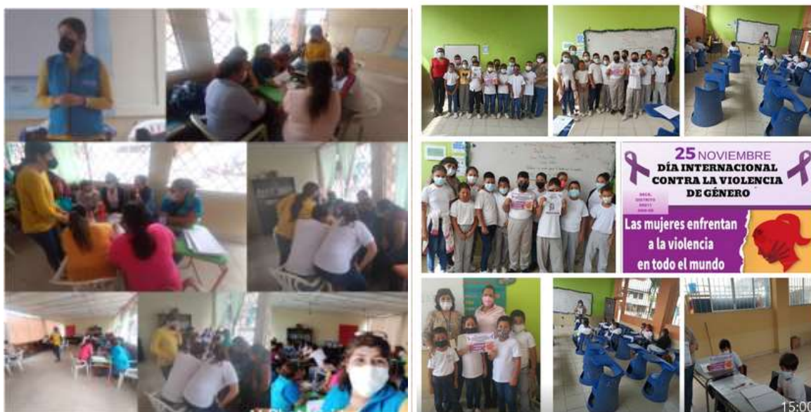
Ilustración 15: Equipo DECE

Fuente: (Departamento de Consejería Estudiantil)