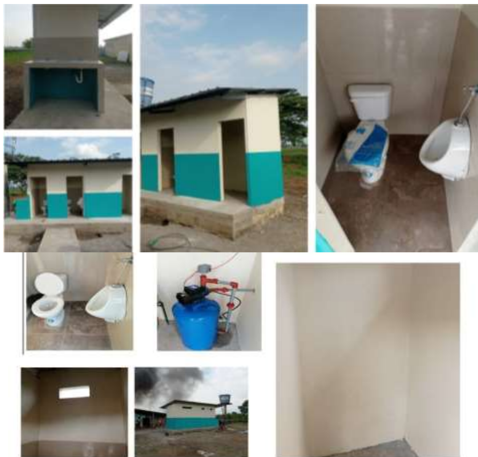
Ilustración 8: ESCUELA DE EDUCACION BASICA ARQUITECTA ADELA PEREZ