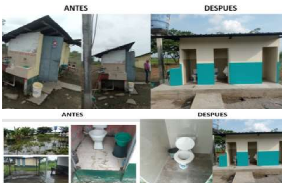
Ilustración 7: ESCUELA DE EDUCACION BASICA LENIN SANCHEZ ROMERO