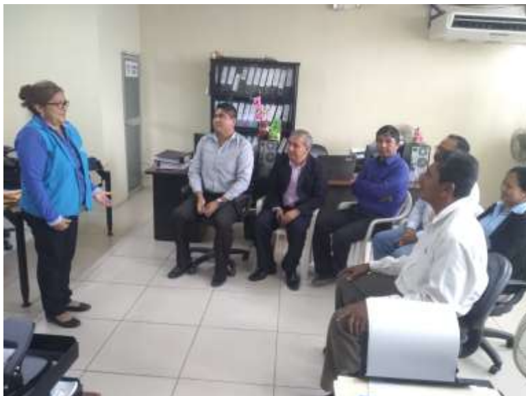
Ilustración 14: Reunión con Rectores de las Unidades Educativas del 09D11