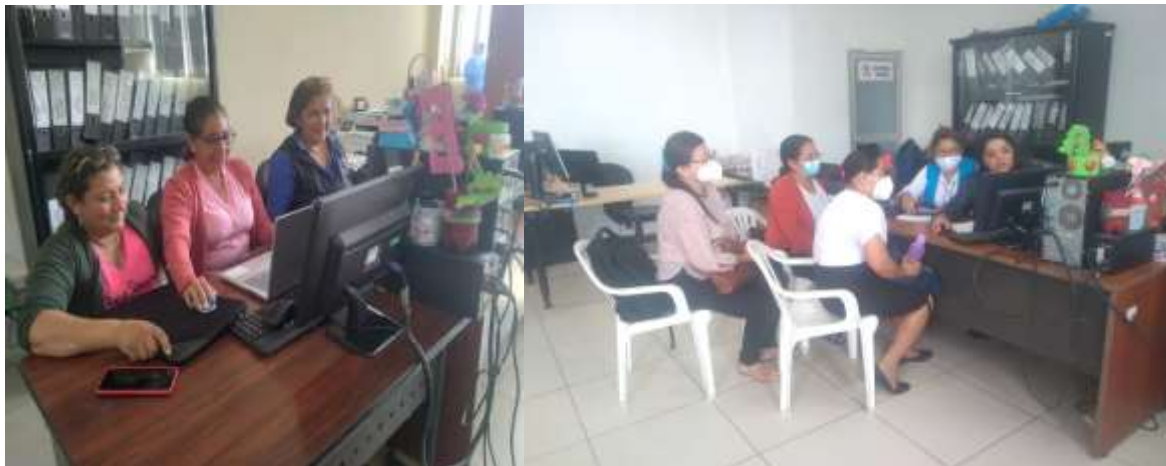
Ilustración 13: Reunión con directivos de las Instituciones Educativas del 09D11