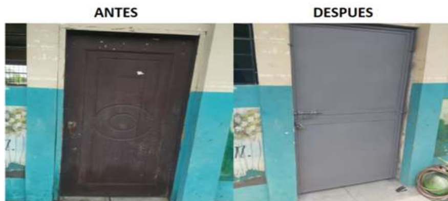
Ilustración 3: ESCUELA DE EDUCACION BASICA MANUEL FRANCISCO CRESPO BRIONES