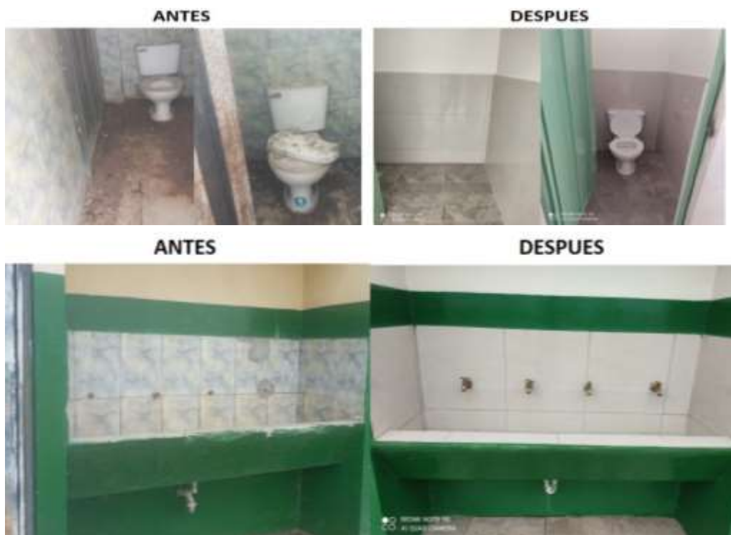
Ilustración 6: ESCUELA DE EDUCACION BASICA ADELAIDA DE PLANAS