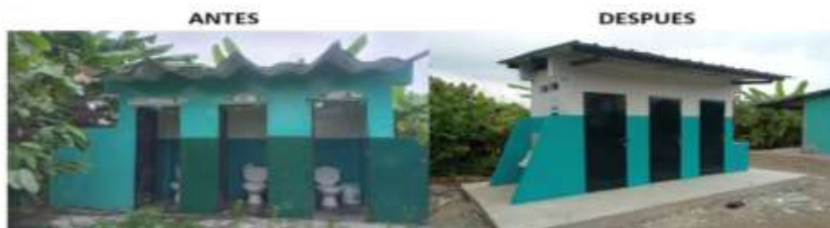
Ilustración 5: ESCUELA DE EDUCACION BASICA DIEZ DE AGOSTO