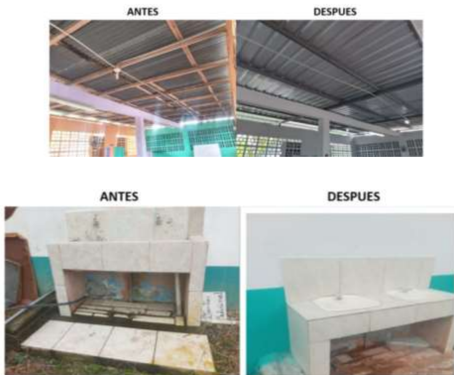
Ilustración 4: Antes y Después de la infraestructura