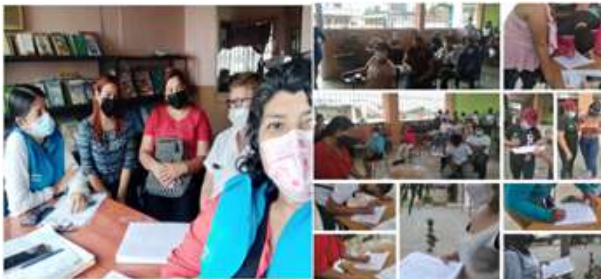
Ilustración 16: EDUCANDO EN FAMILIA CAPACITACIONES