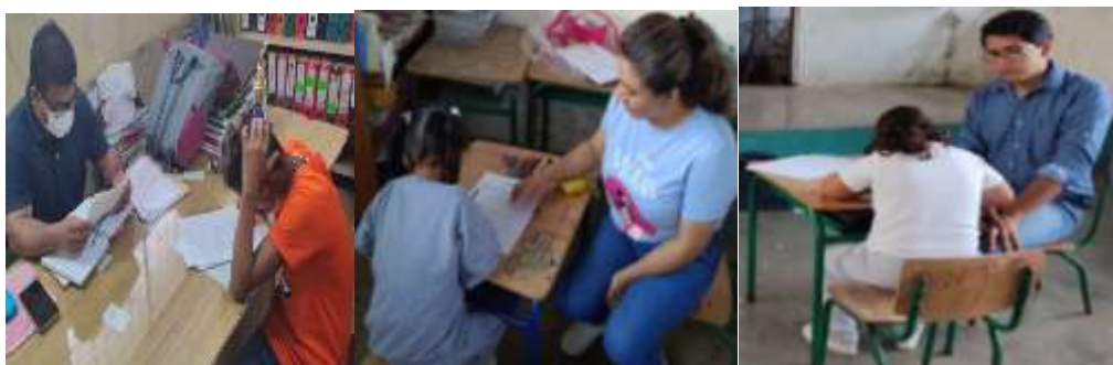
Ilustración 17: PROCESOS ATENDIDOS EN UDAI