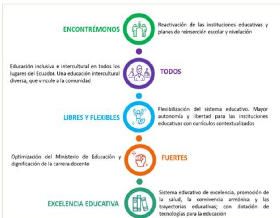
Ilustración 2 Ejes de trabajo del Ministerio de Educación