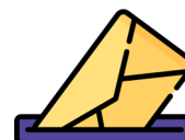
Buzón para profesionales de la educación

El Gobierno Escolar definirá el tiempo para que la comunidad educativa responda y envíe sus respuestas a la pregunta que se detona en el proceso de sensibilización. Este tiempo estará en función del total destinado para la fase.