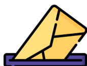
Buzón para estudiantes