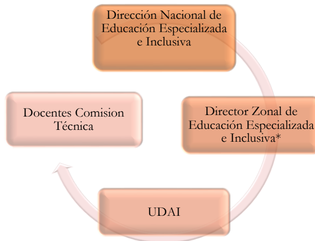
Ilustración 1. Flujograma de proceso de confidencialidad 5

Elaboración: Equipo Técnico Dirección Nacional de Educación Especializada e Inclusiva