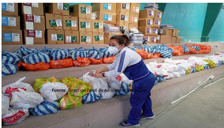
Ilustración Nro. 20. Entrega de Alimentación Escolar