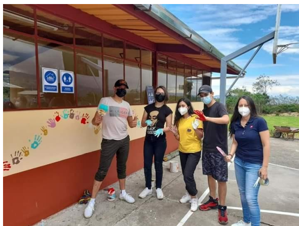
Ilustración Nro. 11. Reapertura de la Institución Educativa “Diego de Vaca”

En el año 2021, se realizó la reapertura de la Escuela de Educación Básica Fiscal “Diego de Vaca”, ubicada en la parroquia de Pintag, que brindará el servicio educativo, a aproximadamente 40 estudiantes.