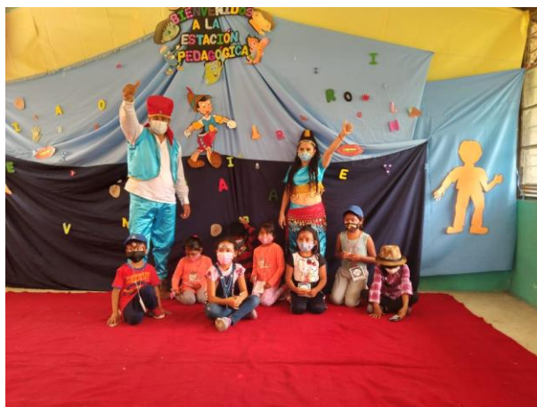
Ilustración Nro. 3. Puntos de Reencuentro