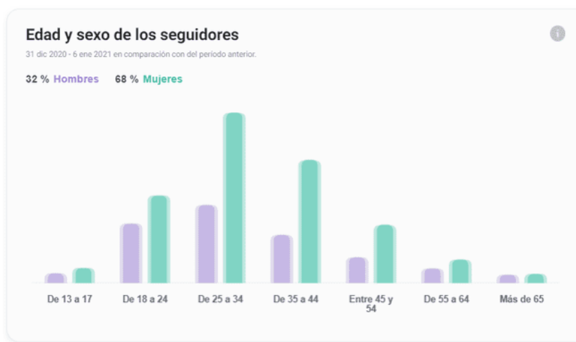
Ilustración Nro. 14. Seguidores por sexo y grupos etarios en redes sociales