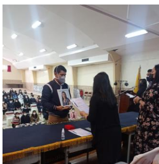
Ilustración Nro. 8. Incorporación de estudiantes de la Unidad Educativa Manuela Cañizares, Distrito Educativo 17D05 - Norte