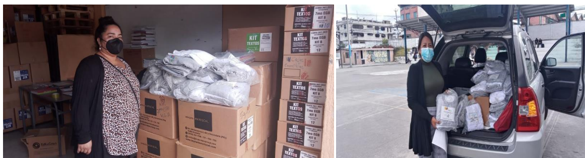
Ilustración Nro. 19. Uniformes Escolares