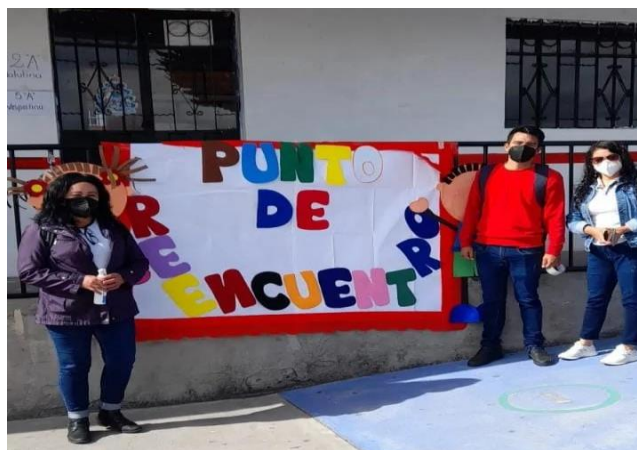
Ilustración Nro. 2. Puntos de Reencuentro