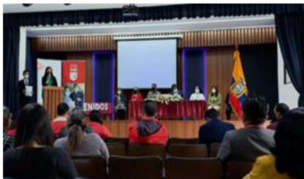
Ilustración Nro. 21. I Congreso de Educación Técnica