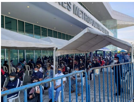
Ilustración Nro. 4. Vacunaciones a docentes SEDMQ 2021