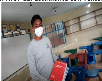
Ilustración Nro. 12. Estudiante con Textos Escolares