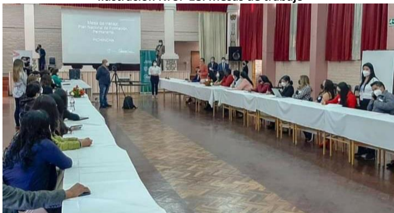
Ilustración Nro. 18. Mesas de trabajo