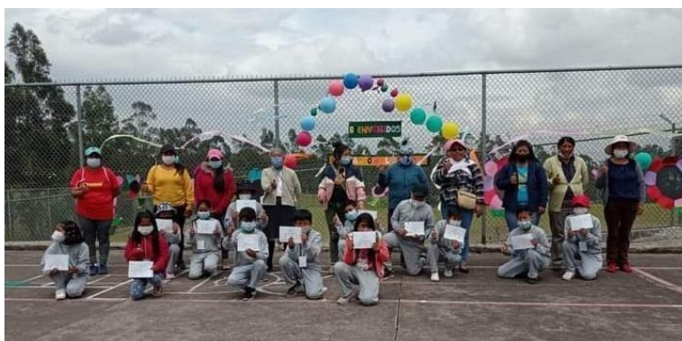
Ilustración Nro. 5. Retorno Progresivo a clases

Para el retorno progresivo a clases, se realizó, la aprobación de protocolos de bioseguridad, reactivación de servicios, bares y transporte escolar, a cargo de la Unidad Zonal de Gestión de Riesgos, instancia que fue la encargada de liderar el proceso, mediante las capacitaciones brindadas, el apoyo a la elaboración de PICES de las Instituciones Educativas y el seguimiento en territorio.