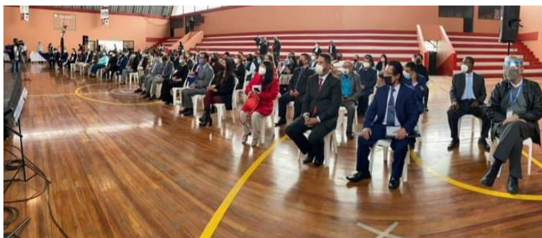
Ilustración Nro. 15. Evento ganadores QSM7de la SEDMQ 2021