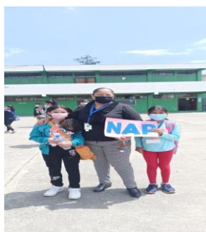
Ilustración Nro. 6. Madre de familia y estudiantes del Servicio Nivelación y Aceleración Pedagógica-NAP