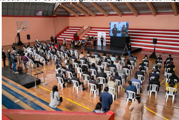
Ilustración Nro. 16. Evento ganadores QSM7de la SEDMQ 2021