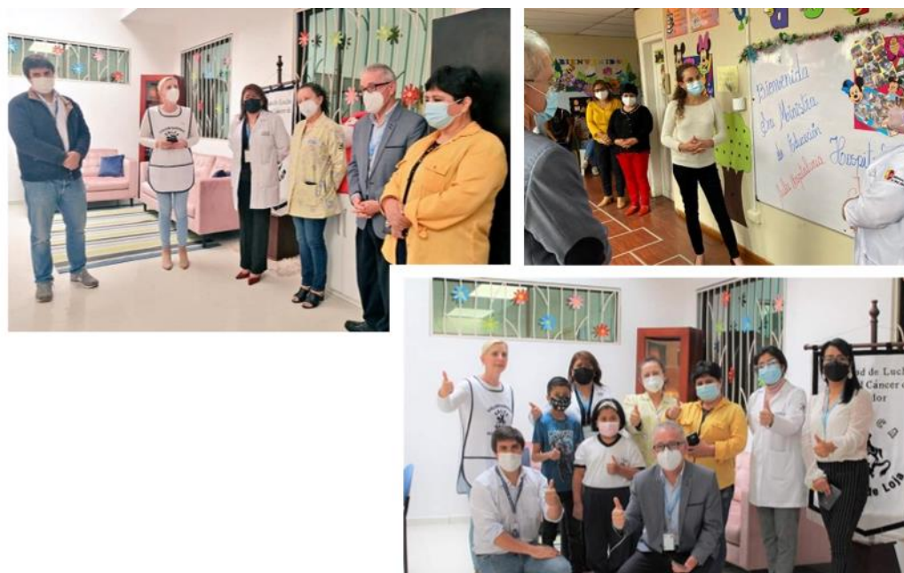
Estudiantes atendidos en Aulas Hospitalarias- Distrito 11D01 2020 - 2021

En el periodo 2021 se atendió a una población estudiantil asociada o no a una discapacidad en educación escolarizada ordinaria a 1.956 estudiantes, en 289 instituciones educativas, 2 CAI y 10 aulas hospitalarias; y, se atendió a 831 estudiantes en instituciones educativas especializadas, estos resultados dan cuenta de la inclusión que se ejecuta en la zona 7.