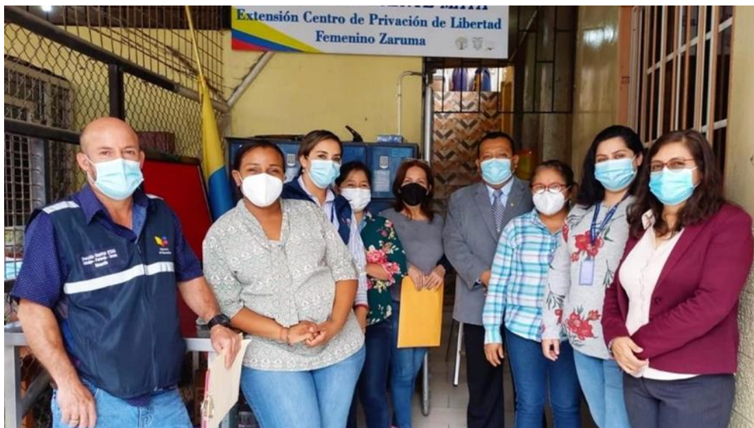
Programa para atención de Personal Privadas de Libertad en el Distrito 07D03 – PPL 2020 - 2021

En cumplimiento con los objetivos de la equidad y la garantía de derechos para todas y todos los ciudadanos, planteados en el Plan Nacional de Desarrollo 2017-2021, considera a la educación como instrumento que permite la inclusión; y, de conformidad con las disposiciones de la Constitución de la República del Ecuador, Ley Orgánica de Educación Intercultural, su Reglamento General y demás normativa expedida para el efecto, determina que es una prioridad la atención a las personas en situación de escolaridad inconclusa, contribuyendo a la reducción del analfabetismo y el incremento de la población joven y adulta con bachillerato.