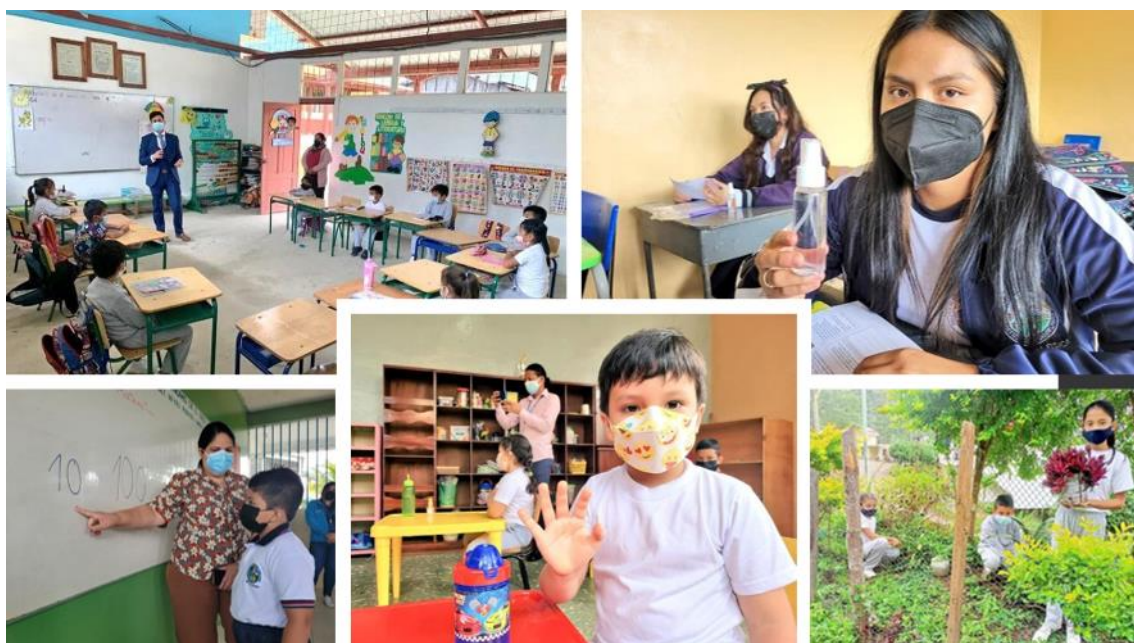
Participación de estudiantes en proceso de retorno progresivo y voluntario 2020 - 2021

El Plan Institucional de Continuidad y Retorno Progresivo a las instalaciones educativas (PICE), tiene como objetivo establecer los acuerdos y consensos con la comunidad educativa, implementando protocolos de bioseguridad establecidos por el COE Nacional para garantizar la continuidad, permanencia educativa de todos los estudiantes y el uso progresivo de la instalación educativa.