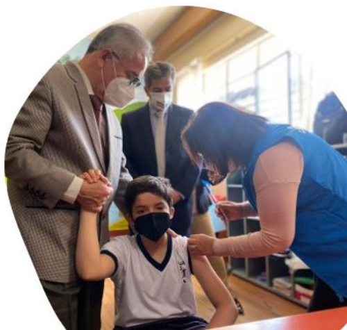
Proceso de vacunación a estudiantes en la Zona 7-Educación 2021

El proceso de vacunación para prevenir el Covid-19 se constituye en un programa de prioridad alta para el Estado Ecuatoriano, así como un elemento indispensable para garantizar el retorno presencial a actividades educativas en todo el país. Es importante destacar que la vacunación es universal y gratuito, constituyéndose en un derecho ciudadano.