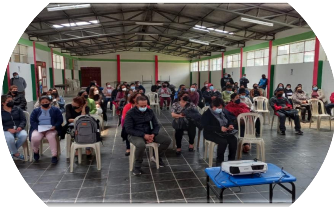
Participación docente en cursos MOOC - 2021

Seleccionaron a 2 docentes de la Zona 7 para que se capaciten en el curso MOOC para la educación integral de la sexualidad.