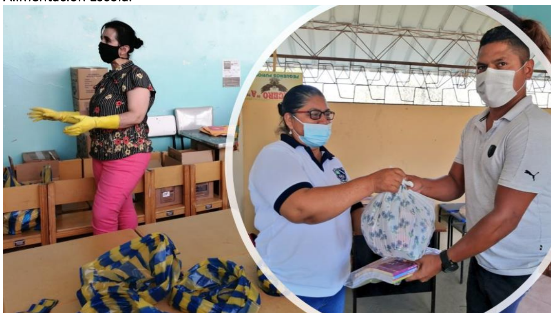
Participación docente en cursos MOOC - 2021

En el año 2021, se tuvo la entrega de alimentación en dos modalidades, la primera cuando no se retornaba todavía progresivamente a clases presenciales y luego ya directamente a los estudiantes que ya estaban en clases presenciales.