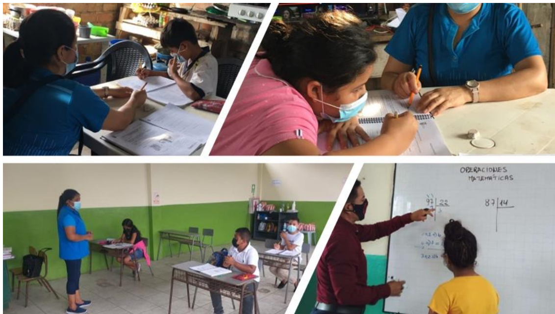
Programa de Nivelación y Aceleración Pedagógica en los Distritos 07D01 y 07D02 2020 - 2021

En el componente de Educación Básica, se ejecutó el Proyecto de Educación Inicial y Básica Integral con Calidad, en el que hasta diciembre del 2021 se contó con docentes financiados con recursos de inversión para atender a niños y adolescentes en situación de rezago educativo con el servicio educativo de Nivelación y Aceleración Pedagógica NAP.