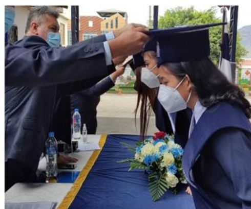
Incorporación de bachilleres año lectivo 2020 - 2021

En este año se realizaron titulaciones de manera virtual y presencial, la población estudiantil titulada en el 2021 es de un total de 25.324 en la Zona 7.