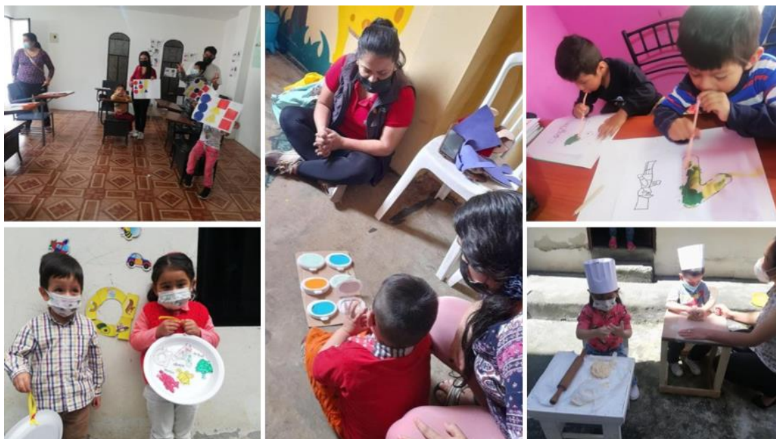
Programa de Servicio de Atención Familiar para la primera Infancia – SAFPI 2020 - 2021

El Servicio de Atención Familiar para la primera Infancia – SAFPI atiende niños/as de 3 y 4 años del Subnivel II de Educación Inicial, con el objetivo de promover el desarrollo integral y armónico de niñas/os de esta edad.