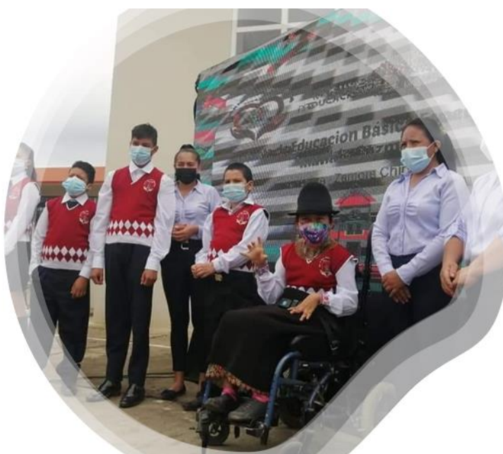
Inclusión de estudiantes con necesidades educativas especiales Distrito 19D01 2020 – 2021

En el periodo de matrículas ordinarias y continuas de Régimen Costa 2021-2022 se ha realizado la asignación de 155 estudiantes con necesidades educativas específicas para la inclusión en Instituciones Ordinarias y Especializadas extraordinarias.