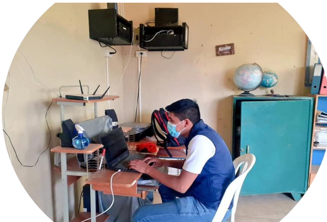
Asistencia Técnica para mantenimiento de redes de internet - 2021

Durante el 2021, la Coordinación Zonal de Educación y a través de las Direcciones Distritales y la Dirección Nacional de Tecnologías de la Información y Comunicaciones, se administró 925 enlaces de conectividad provistos en las instituciones educativas fiscales de la zona 7.