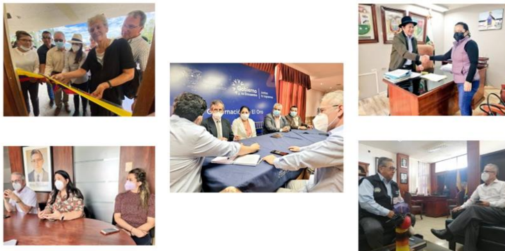
Participación en diferentes conversatorios para la celebración de convenios Interinstitucionales - 2021

Dentro de nuestras competencias de coordinar acuerdos y celebrar compromisos con otros organismos del Estado para controlar posibles situaciones de riesgo y garantizar el bienestar de la comunidad estudiantil al tenor del literal p , numeral 3 artículo 31 del Estatuto Orgánico Funcional que rige nuestro actuar en todos los aspectos, esta Coordinación conjuntamente con las Direcciones Distritales ha celebrado treinta y nueve (43) convenios de cooperación interinstitucional tanto con entidades públicas como privadas, siendo los principales actores los Gobiernos Autónomos Descentralizados. La colaboración brindada se reflejará en la intervención de cuarenta (40) instituciones educativas, de las cuales treinta y cinco (35) serán intervenidas en cuanto al mejoramiento de su infraestructura, una (1) con el servicio de transporte para su estudiantado, dos (2) con la entrega de útiles escolares y una (1) con la prestación de apoyo pedagógico a los discentes. Generando una inversión de $ 1'625.849,59 (un millón seiscientos veinticinco mil ochocientos cuarenta y nueve con cincuenta y nueve centavos de dólar de los Estados Unidos de Norteamérica). Cabe destacar que el cumplimiento del objeto contractual de estos convenios se traducirá en el beneficio de alrededor siete mil (7000) discentes, sin considerar el cuerpo docente y toda la comunidad educativa involucrada.