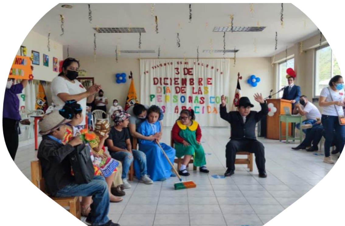
Estudiantes atendidos en Oferta Educativa Especializada 2020 - 2021

En el régimen Costa 2021-2022 se encuentra considerados 166 estudiantes para rendir Prueba Alternativa y 119 para Proyecto de Grado, se encuentra en validación de la DNEEI de acuerdo con las cartas de aceptación firmadas por parte de los representantes.