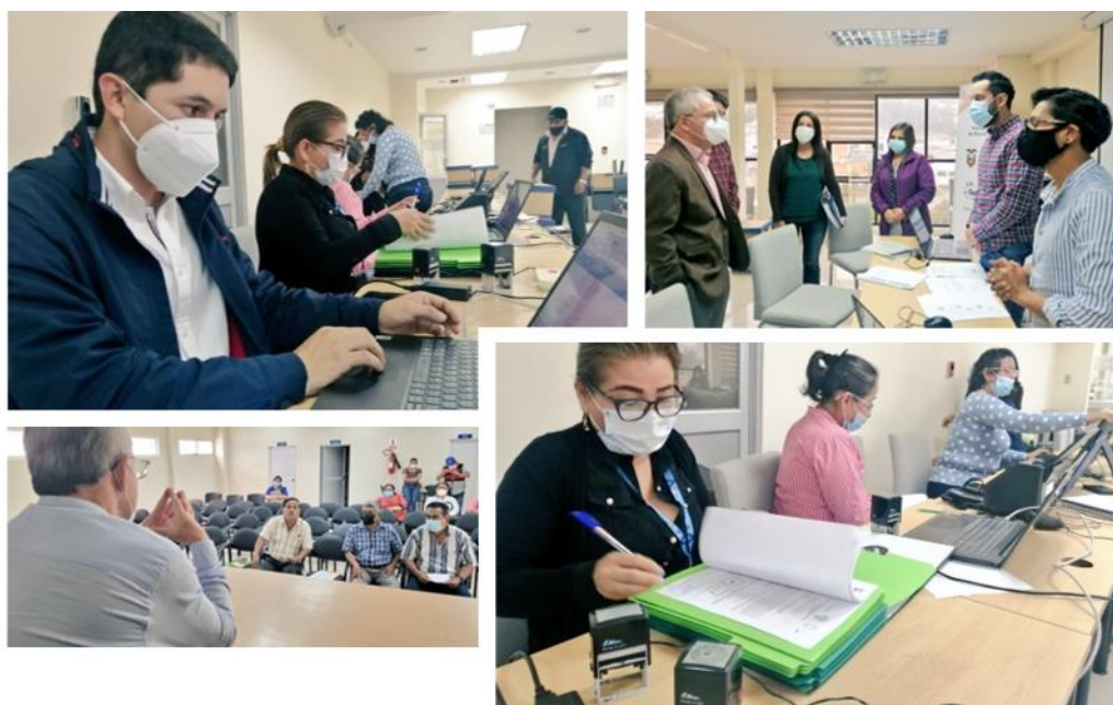
Validación de expedientes de procesos de jubilación en la Zona 7-Educación 2021