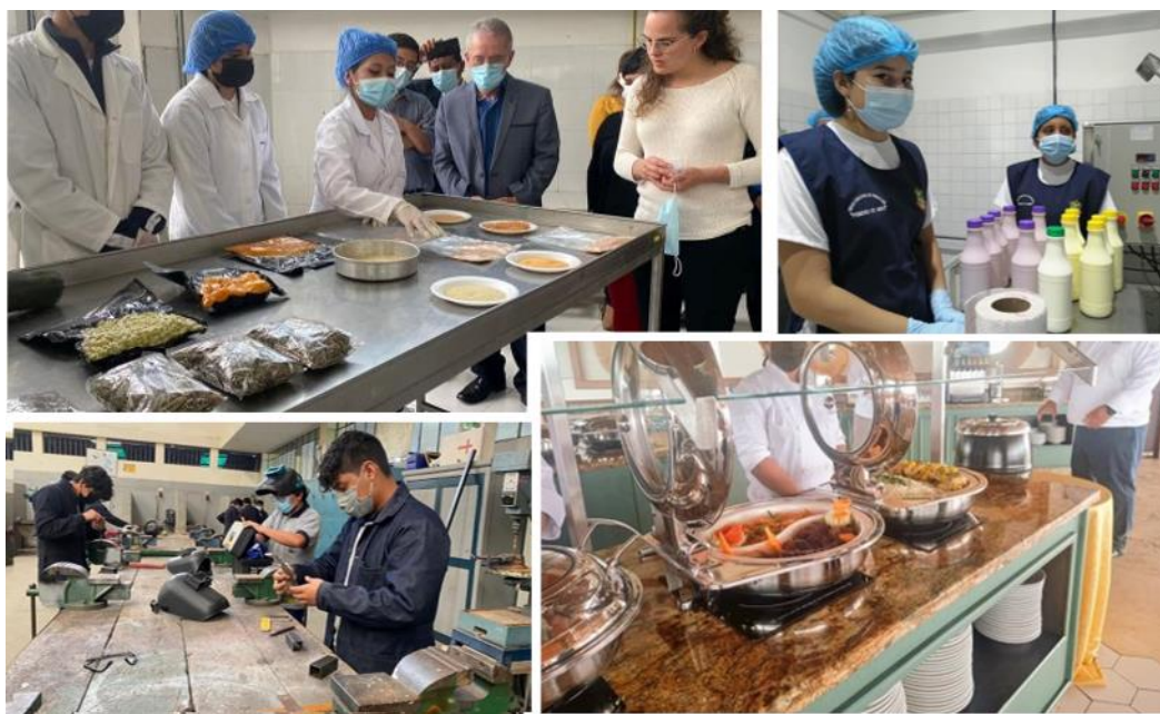
Estudiantes de Bachilleratos Técnicos – 2021

respectivamente, y finalmente el área técnica Deportiva y Artística representan solamente el 1,06%.