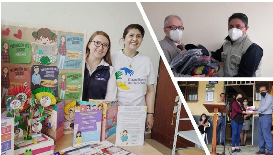
Entrega de recursos educativos a la comunidad educativas - 2021

El Ministerio de Educación, con el fin de garantizar una educación de calidad y eliminar las barreras de acceso a la educación, dota de textos y uniformes a niñas, niños y jóvenes de instituciones educativas públicas y fiscomisionales a nivel nacional.