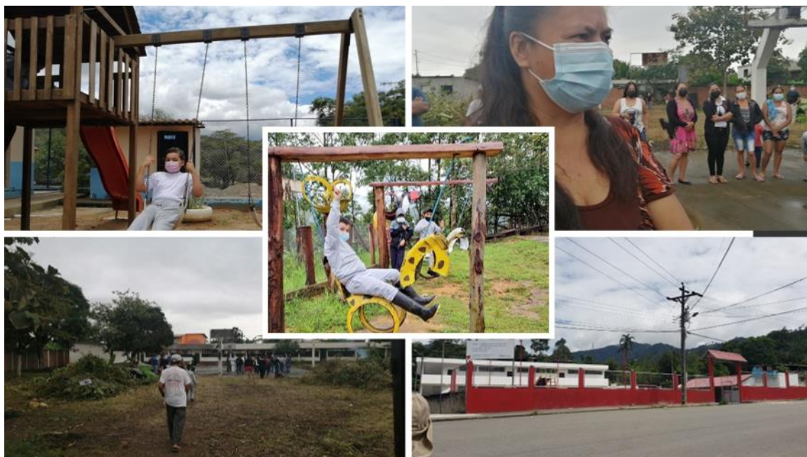
Proceso de Reapertura de Instituciones Educativas Rurales 2021

En el año 2021, desde Zona se realizó la coordinación y el seguimiento de las siguientes instituciones educativas rurales fueron intervenidas en su infraestructura para ser reabiertas.