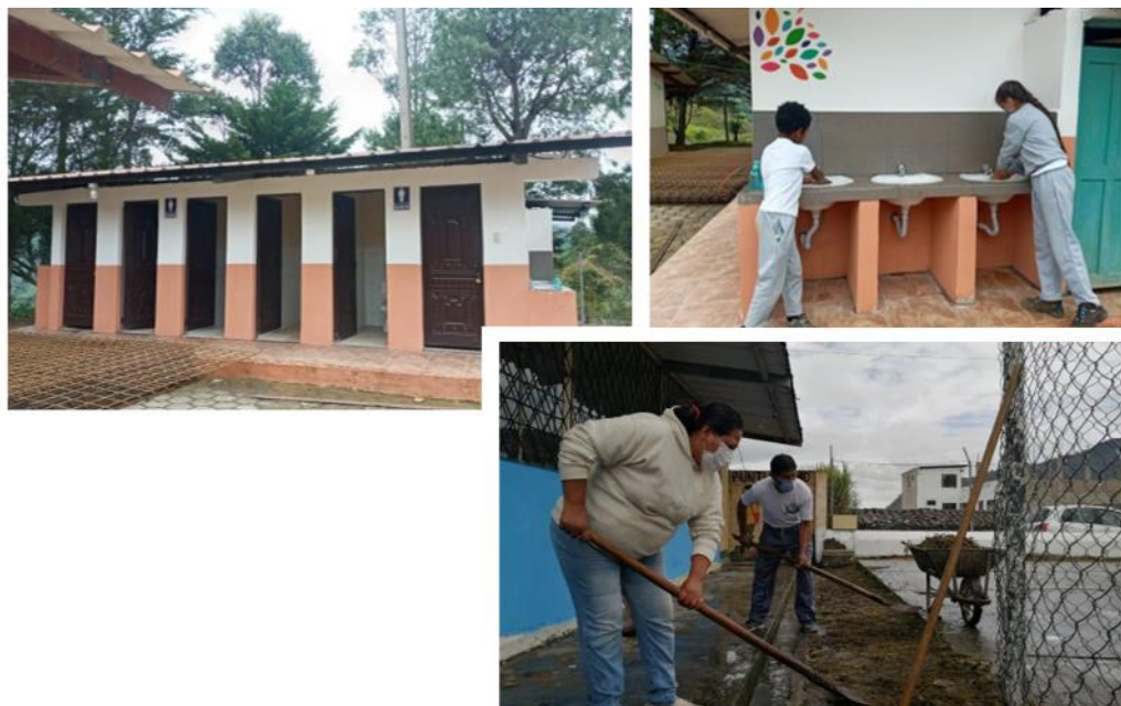
Atención con obras de mantenimiento a las Instituciones Educativas de la Zona 7-Educación 2021

En el año 2021, pese a continuar en pandemia, se empezó el retorno progresivo y voluntario a clases presenciales, se tuvo que intervenir en las Instituciones educativas de la zona, especialmente en lo referente a las baterías sanitarias, en vista de que son espacios fundamentales para la aplicación de protocolos de autocuidado y medios de prevención del COVID19, tanto para el retorno progresivo a las aulas como para la entrega de alimentación escolar, recepción de portafolios, etc.