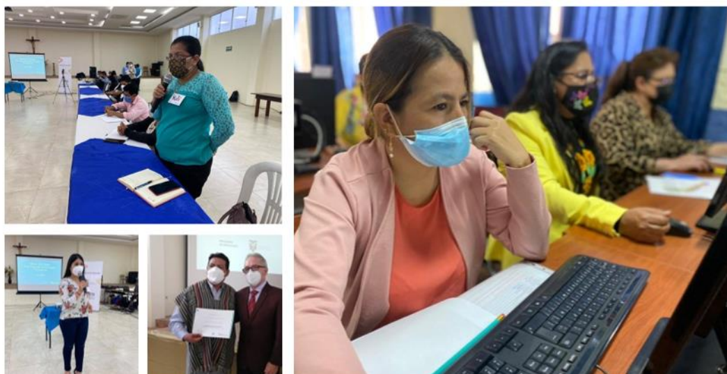
Participación de capacitación al personal docente de la Zona 7-Educación 2021