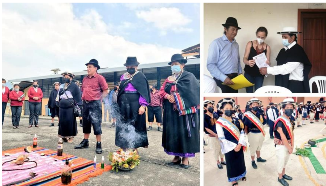
Educación Intercultural Bilingüe en la Zona 7-Educación 2021

En educación intercultural bilingüe, los 127 CECIB que pertenecen a Zona 7, todos son fiscales, en estos establecimientos se practica el trabajo comunitario, El MOSEIB contempla que el currículo intercultural debe ser contextualizado en sus 14 nacionalidades y 18 pueblos, con la finalidad de alcanzar una educación con identidad.