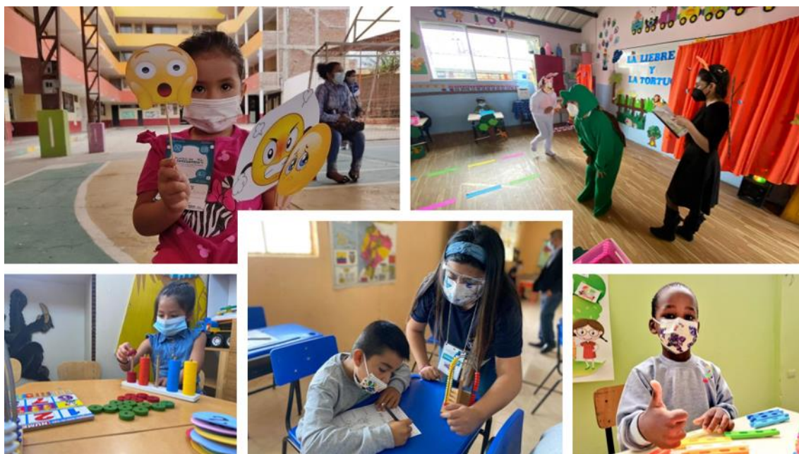
Participación de estudiantes en los diferentes puntos de Reencuentro 2020 - 2021

En las Provincias de El Oro, Loja y Zamora Chinchipe la Coordinación Zonal de Educación Zona 7, durante el periodo comprendido entre el 10 de agosto y el 24 de septiembre de 2021, se activaron un total de 252 puntos de reencuentro de la comunidad educativa, y tomamos contacto con 56.541 estudiantes. El detalle del número de puntos activados por semana y por distrito se presenta en la en la Tabla 1.