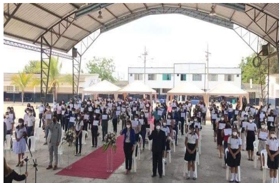
Ilustración N° 2: Elaborado por la Dirección Distrital 24D02.