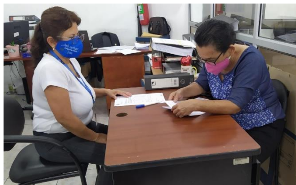
Ilustración N° 1: Elaborado por la Dirección Distrital 24D02. Fuente (TTHH-24D02)