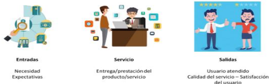
ILUSTRACIÓN 2 GESTIÓN DE CALIDAD EDUCATIVA

Durante este periodo fiscal se han realizado mejoras en el sistema de Gestión de Calidad; a continuación se detalla reporte de procesos de cada uno de los departamentos: