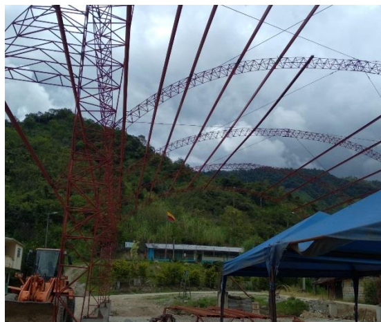
FOTO 3 CONTRUCCION DE LA CUBIERTA EN LA UE JOSE MEJIA LEQUERICA