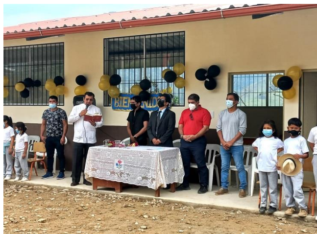
FOTO 4. CULMINACION DE IBRA EN CONVENIO CON EL GAD PARROQUIA EL PORVENIR