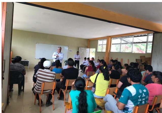
FOTO 1 ASESORAMIENTO DE DOCENTES EN ADAPTACIONES CURRICULARES