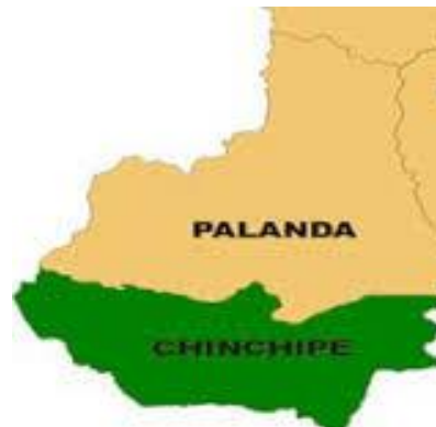
Tabla 01.- Descripción de los Circuitos Educativos – Distrito 19D03