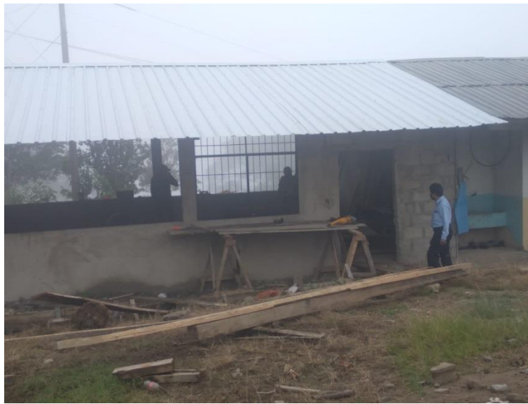
FOTO 2. ADECUACIONES INFRAESTRUCTURA EEB JOSE MARTIN GARCIA

Fuente. Departamento distrital de Administración Escolar