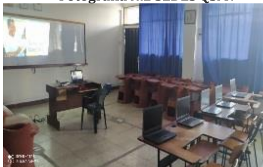
Fotografía N.2 SEDES QSM7