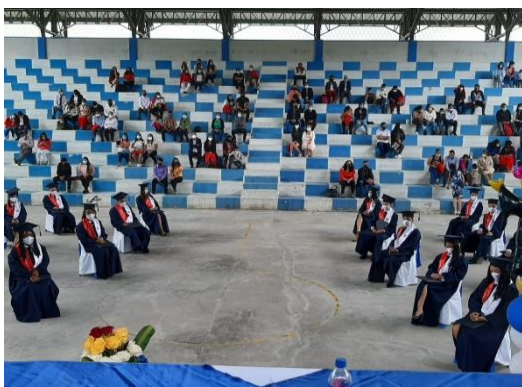
ILUSTRACIÓN No. 2: Proceso de Titulación.