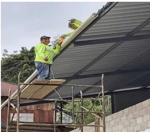
ILUSTRACIÓN No. 9 Mantenimiento Escuela Manuel Matheus