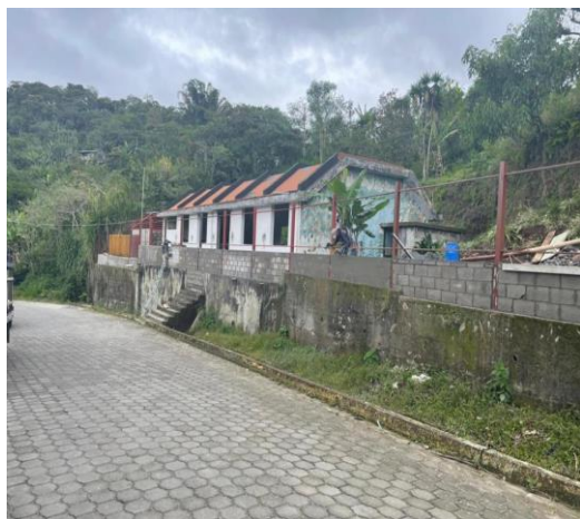
ILUSTRACIÓN No. 7 Mantenimiento U. E. 24 de Julio