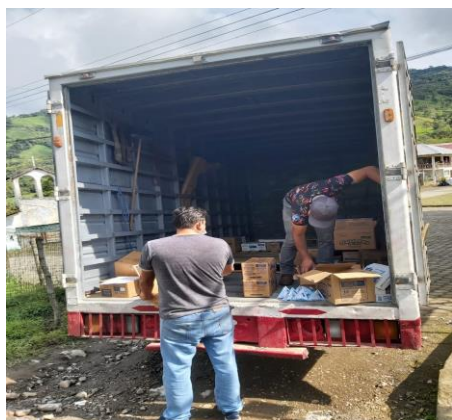
ILUSTRACIÓN No. 4 Dotación de Alimentación escolar

En esta de época de pandemia se garantizó la distribución adecuada y oportuna de recursos educativos de calidad con la participación de todos los actores educativos; la meta planteada por el Distrito de Educación 17D01 Nanegalito se ha cumplido, entregando las raciones alimenticias a 2.351 estudiantes de 1ro a 10mo de Educación General Básica beneficiarios, matriculados legalmente en 36 instituciones educativas de sostenimiento fiscal.