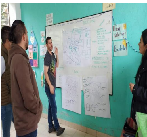
ILUSTRACIÓN No. 11 Levantamiento informes técnicos mantenimientos IE Distrito 17D01

Para realizar el levantamiento de informes técnicos (detalles constructivos, cálculo volumétrico, presupuestos referenciales, análisis de precios, factibilidad, viabilidad, especificaciones técnicas en la Institución Educativa Santa Isabel, Alfredo Pérez Chiriboga y Club de Leones de Franklin), se contó con profesionales contratados por servicios profesionales, quienes estuvieron encargados de este proceso, para realizar mantenimientos necesarios en las Instituciones Educativas: Santa Isabel, Club de Leones de Franklin y Alfredo Pérez Chiriboga ex Escuela Manuel Larrea, pertenecientes a la Dirección Distrital 17D01.