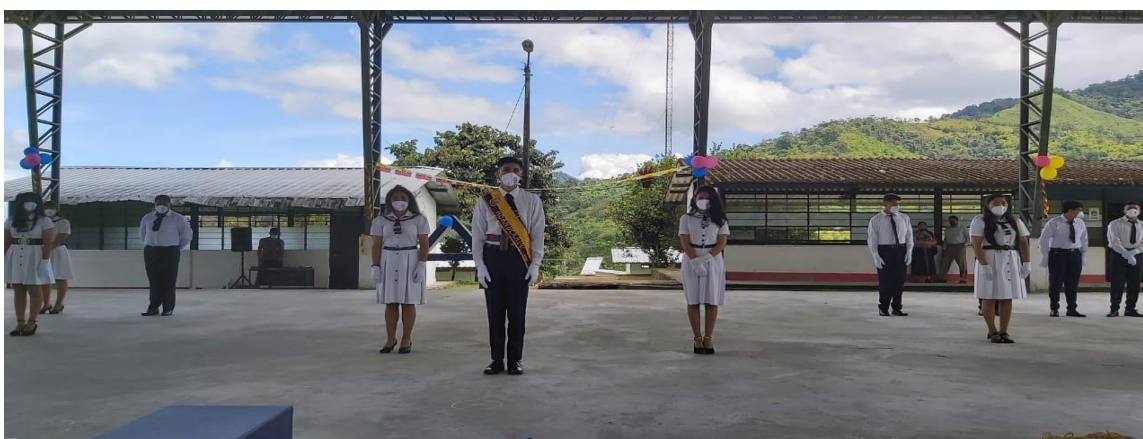
ILUSTRACIÓN No. 3 Juramento a la Bandera.

La Dirección Distrital de Educación 17D01, ha dotado a las instituciones fiscales de insumos de bioseguridad, se ha ofrecido asesoramiento a las instituciones de todos los sostenimientos para el mejoramiento de espacios, señalética, infraestructura y protocolos de bioseguridad con la finalidad de evitar índices de contagios en los integrantes de la comunidad educativa.