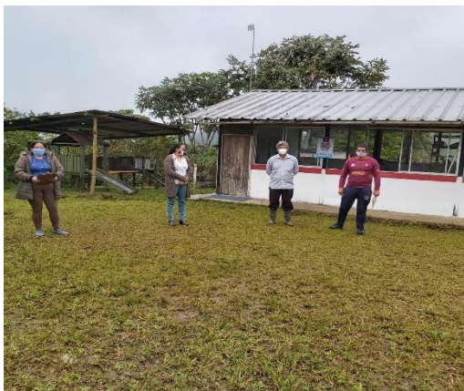
ILUSTRACIÓN No. 1: Visita a IE revisión, registro y autorización del PICE.