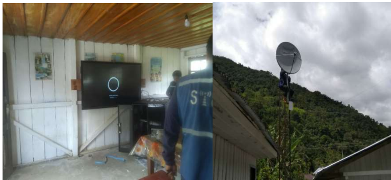
Fotografía 5 Instalación de Aula Virtual

Dotación de una Aula Virtual para la Escuela de Educación Básica 16 de Agosto de la parroquia Amazonas, por convenio entre MINEDUC y la empresa HISPASAT.