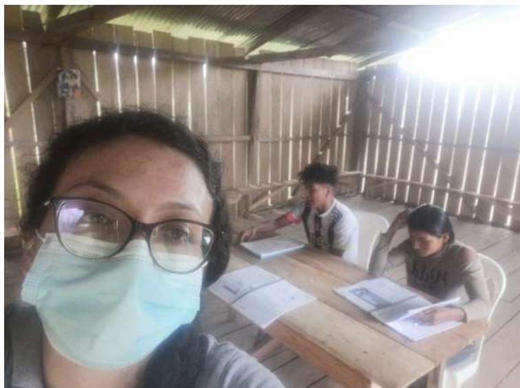
Fotografía 1 Nivelación Pedagógica