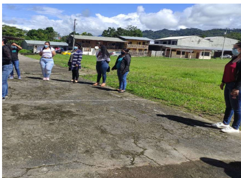
Fotografía 3 Taller Redes de Aprendizaje

Con la finalidad de atender las necesidades del sistema educativo intercultural bilingüe se dio inicio al proceso Quiero Ser Maestro Bilingüe 1 que contempla componentes como la diversidad lingüística y cultural de los pueblos y nacionalidades indígenas, la cosmovisión, el Modelo del Sistema de Educación Intercultural Bilingüe (MOSEIB) y la interculturalidad; en este proceso la Dirección Distrital 14D04 Gualaquiza San Juan Bosco Educación otorgó 8 nombramientos definitivos.