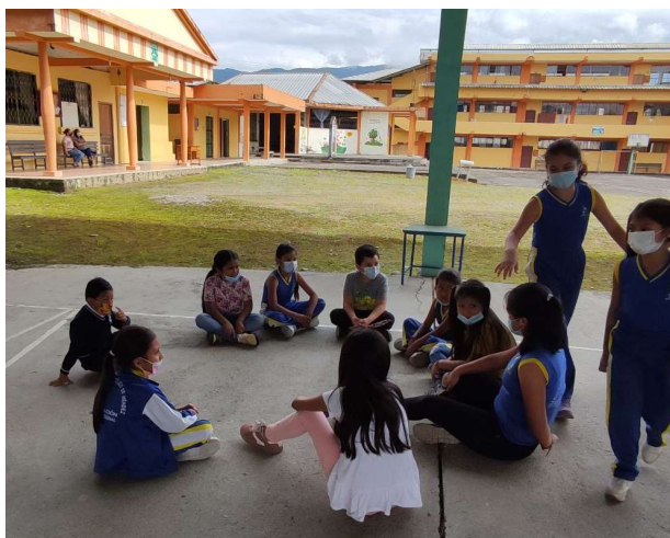
Fotografía 4 Prevención del embarazo, sexualidad

Alrededor de 7.413 actores de la comunidad educativa, que comprende entre estudiantes, docentes, directivos, representantes legales y funcionarios administrativos; fueron los beneficiarios de las acciones de prevención, promoción, restauración implementadas por los profesionales DECE en coordinación y apoyo de los directivos de las instituciones educativas y demás instancias de protección de derechos.