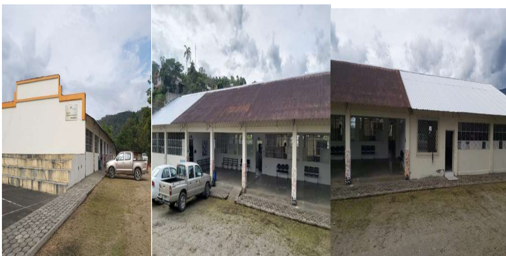
Fotografía 6 Nuevas Oficinas del Distrito

Mediante contrato de arriendo con el Vicariato Apóstolico de Mendez-Misión de Oriente, se trasladó las oficinas administrativas de la Dirección Distrital 14D04 Gualaquiza San Juan Bosco Educación, mismo que se encuentra ubicado en la calle Cuenca entre 24 de Mayo y 16 de Agosto.