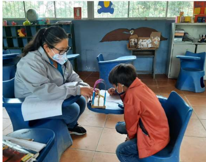
Fotografía 2 Evaluación Pedagógica