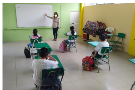
Figura N° 3: PUNTOS DE ENCUENTRO, PARTICIPANDO INSTITUCIONES EDUCATIVAS

Manta, Manujela Cañizares, Rosa Ávila de Gorriti, 12 de Octubre, Carabobo, Medardo Mora Sierra, Teresa de Calcuta, Lev Vigotsky, Sucre Eloy Alfaro, Mathew. Etc.