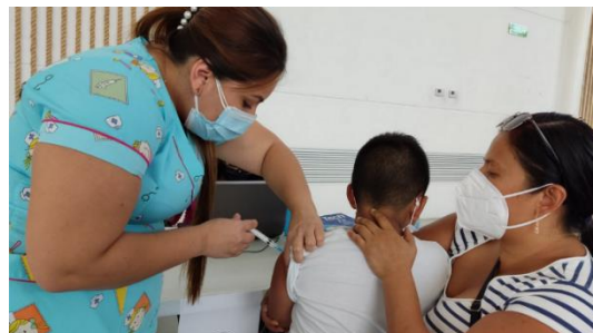
Figura N° 2: PICES AUTORIZADOS 68 INSTITUCIONES EDUCATIVAS POR EL DISTRITO 13D02 EN EL AÑO 2021, RETORNANDO A CLASES PRESENCIALES