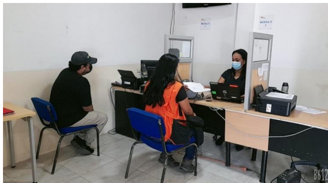
Figura N° 5: ENTREGA DE UNIFORMES PERSONAL DE CÓDIGO DE TRABAJO