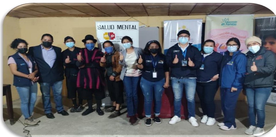
Ilustración 7. Salud Mental

En ninguna de las reuniones, mantenidas en durante el periodo 2021 se realizó alguna actividad, con respecto al tema.