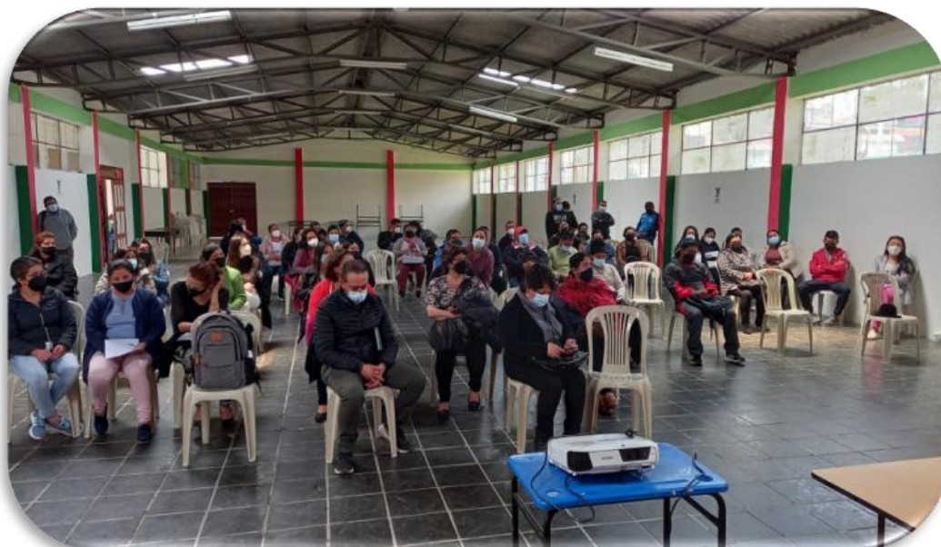
Ilustración 3. Curso MOOC