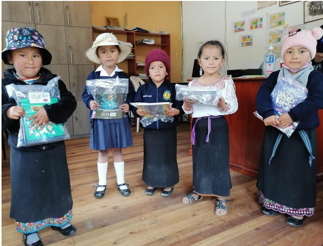
Ilustración 9. Entrega de textos escolares. Año 2021