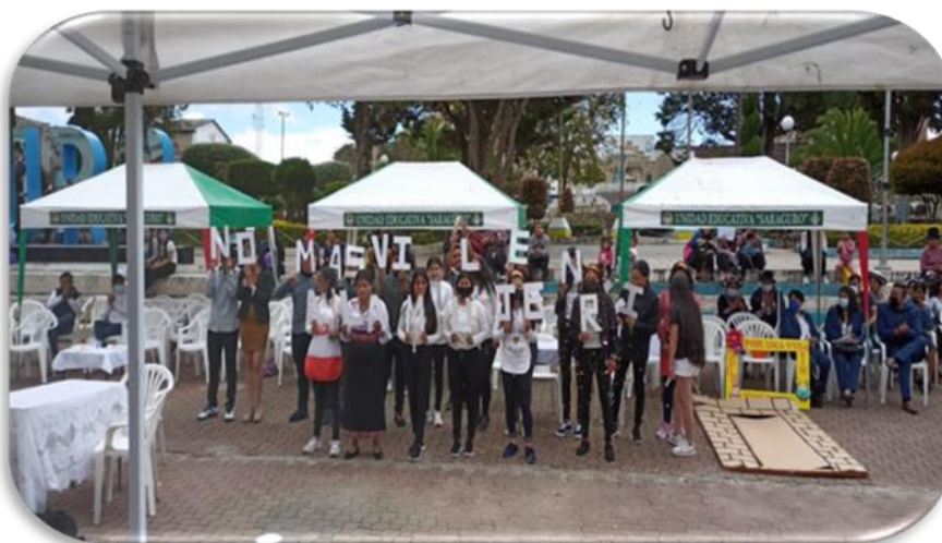
Ilustración 6. Promoción de derechos en el uso del internet.