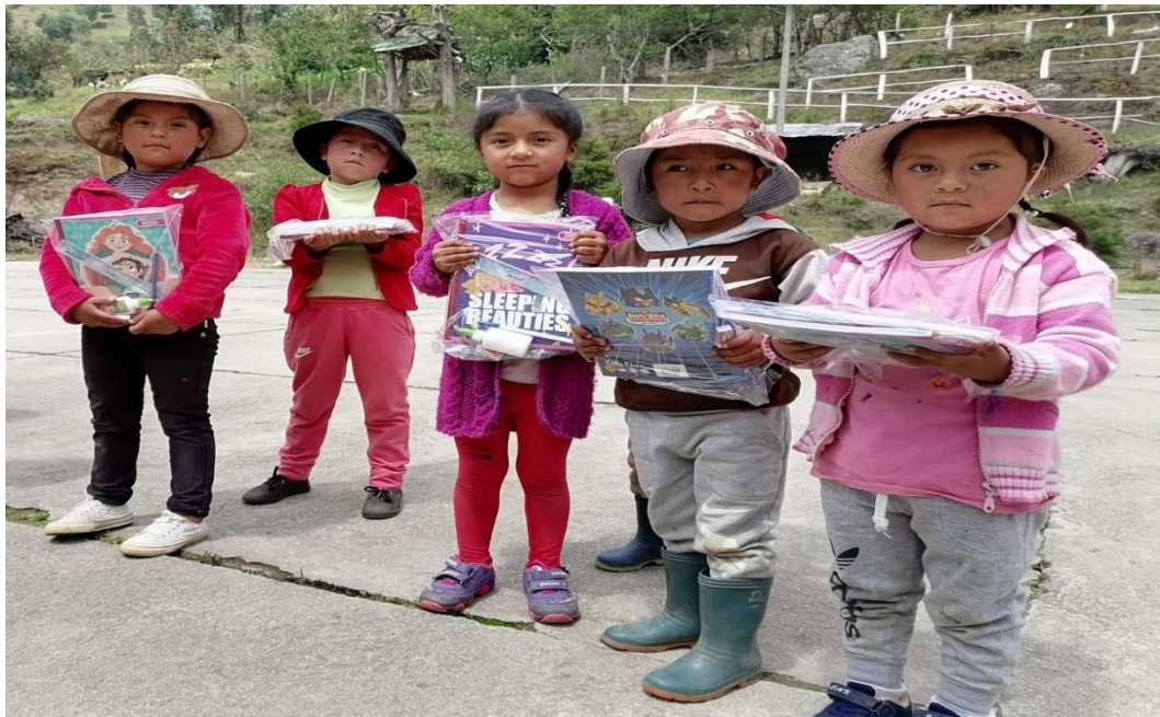
Ilustración 10. Entrega de textos

“La educación es un derecho fundamental Juntos cumplimos lo hacemos con todos ustedes”