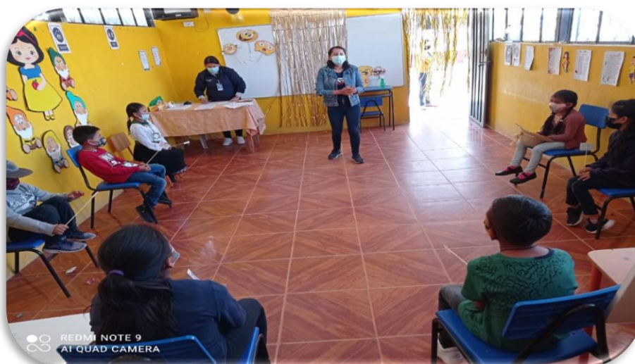
Ilustración 8. Salud Mental