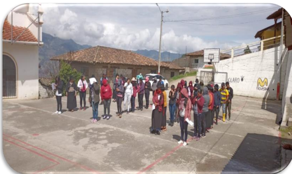
Ilustración 5. Educando en familia